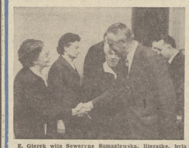
E. Gierek wita Seweryna Szmaglewską, literatkę, była więźniarkę Oświęcimia. C&F — Uchymiak

wzrostowi wydajności pracy. Znacznie zmodernizowano park maszynowy i bazę produkcyjną przedsiębiorstw. Nakłady na inwestycje i postęp techniczny wzrosły o jedną trzecią. Najlepsze rezultaty w zakresie usprawnienia procesów produkcyjnych osiągnięły: Gdańskie Przedsiębiorstwo Mechanizacji Budownictwa „ZREMB”, Gdańskie Zakłady Rybne, Fabryka Opakowań Blaszanych „Opakomet”, Zakłady Urzędów Okrętowych „Hydroster”, Zakłady Futrzarskie, Spółdzielnia Pracy „Gedania” i Gdańskie Zakłady Elektronizacji „U-nimor”. W „ZREMB” i GZR notuje się znaczny postęp w dziedzinie unowocześnień wyrobów. W ostatnim roku uzyskano tam siedem znaków jakości i kilka patentów. Sukcesy osiągnęli budowlani, którzy w latach 1973-1974 przekazali blisko 9 tys. mieszkań, wzniesli 11 obiektów towarzyszących i