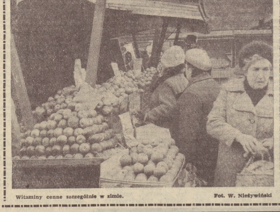
Witaminie cenne szczególnie w zimie.

Po niezbyt pomyślnych spotkaniach inauguracyjnych II rundy rozgrywek I ligi koszykarskiej, która zostanie rozpoczęta w najbliższym tygodniu, gdańscy koszykarze goszczą zespoły Polonii i Legii.