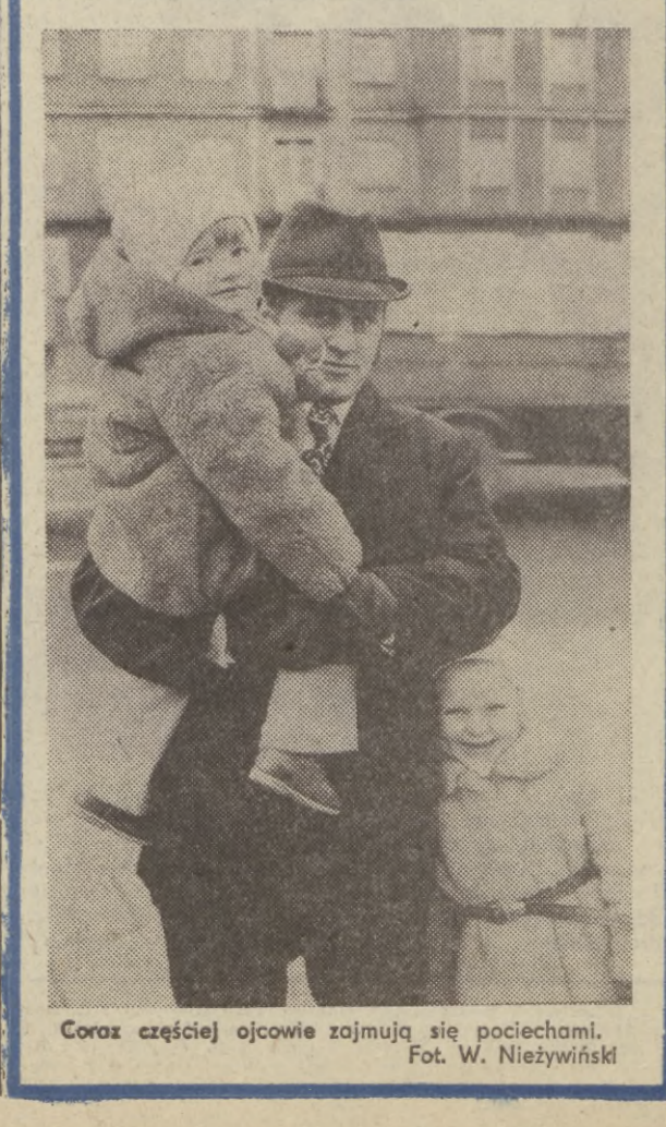
Coraz częściej ojcowie zajmują się pociechami.

Jak nas poinformował dyżurny synoptyk, dziś na Wybrzeżu będzie zachmurzenie umiarkowane. Temp. od +3 do +6 st. Wiatry dość silne, południowo-zachodnie.