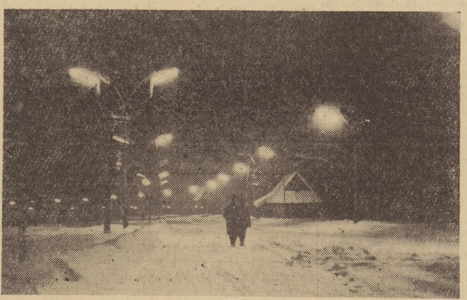
Krupówki B. nocą