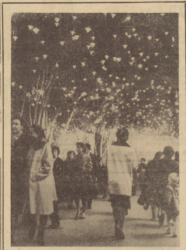
Świąteczna iluminacja paryskiej ulicy.

LONDYN (PAP). Deputowany do parlamentu pakistańskiego Wali Khan oświadczył, jak do-rosi agencja Reuters, iż w północno-zachodnim Pakistanie na granicy z Afganistanem znajdują się dwie tajne bazy amerykańskie: Czerate i Badabere. Obie leżą w niezachodniej odległości od znanej bazy lotniczej w Peshawarze, z której przed dwoma laty wystartował do swego niefortunnego lotu samolot „U-2” Francis Garry Powers.