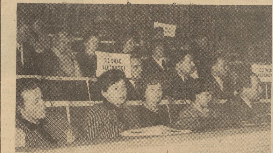
Na zdjęciu: Delegaci Związku Zawodowego Pracowników Łączności na sali CAF - fot. Szyperko

W pierwszej połowie więcej animuszu wykazywali Irlandczycy, którzy w pierwszych minutach przypuścili ostry szturm do bramki polskiej. Później gra się wyrównała, a na początku drugiej połowy Polacy wyraźnie przeważali, jednak po utracie drugiej bramki opadli z sił, co przesądziło wynik spotkania.