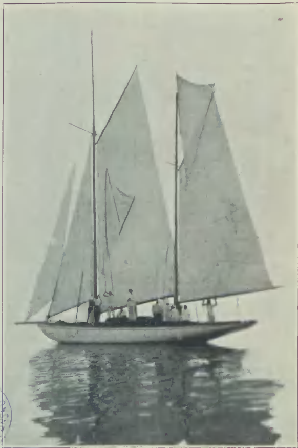
JACHT A. Z. M. „SWAROŻYC“