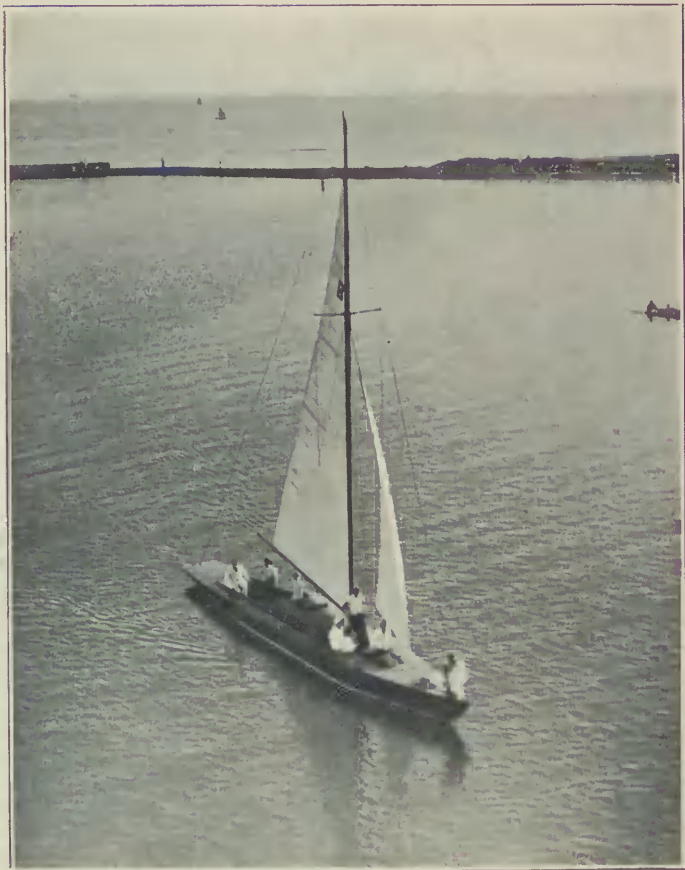
JACHT A. Z. M. „POŚWIST“