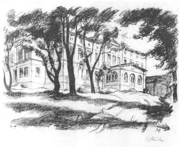
Rudolf Muchow, Pałac w Kusicach, litografia, 1924

Kusice to wieś o metryce średniowiecznej leżąca 3 kilometry na południe od Niemicy.