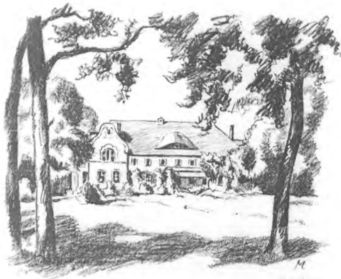
Rudolf Muchow, Pałac w Żegocinie, litografia, 1924

Wioska leży 5 kilometrów na wschód od Malechowa. Wieś jest wieś-rodzinną, z zespołem pałacowo-parkowym i folwarkiem we wschodniej części.