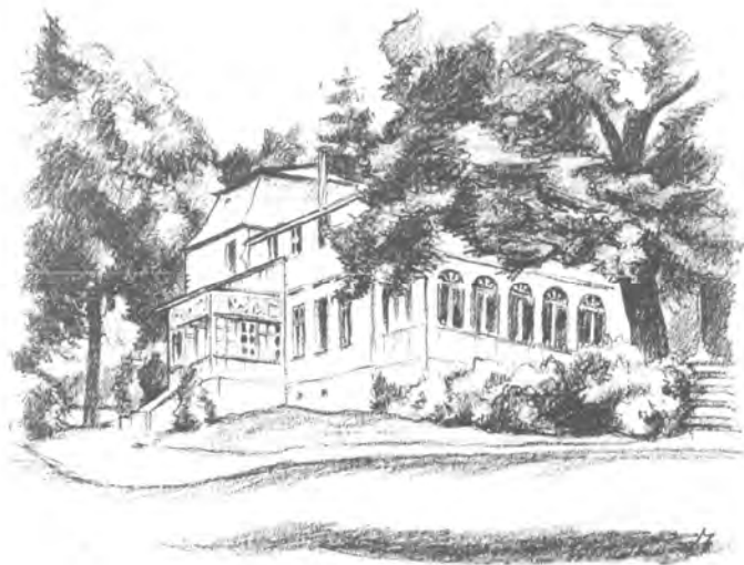
Rudolf Muchow, Pałac w Borkowie, litografia, 1924

W końcu XVIII wieku w wiosce mieszkało 3 chłopów i znajdowało się 9 domów.