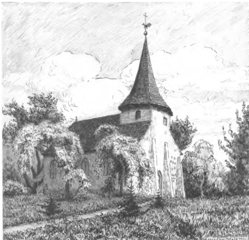
Rudolf Hardow, Kościół w Łąku, tusz, 1921

W dokumencie z początku XVII wieku wymienia się 11 chłopów posiadających zagrodę, 3 chałupników, kowala, 2 chałupników zajmujących się drogami. Natomiast w spisie mieszkańców z 1648 roku wymieniono sołtysa, 14 chłopów, 3 chałupników. W wiosce było wtedy 80 koni, 29 źrebaków, 103 krowy i jałówki, 13 owiec, 169 świń.