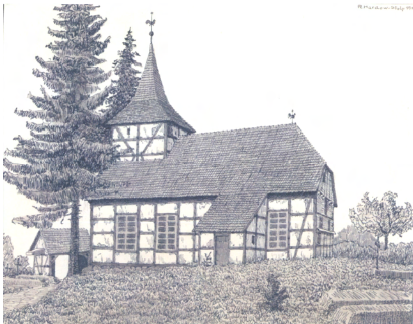
Rudolf Hardow, Kościół w Przystawach, tusz, 1914

L. Brüggemann podaje (1784), że we wsi znajdowały się 24 domy. Było 21 gospodarstw, w tym gospodarstwa nauczyciela i kowala. Mieszkał tu także leśniczy i budnik.