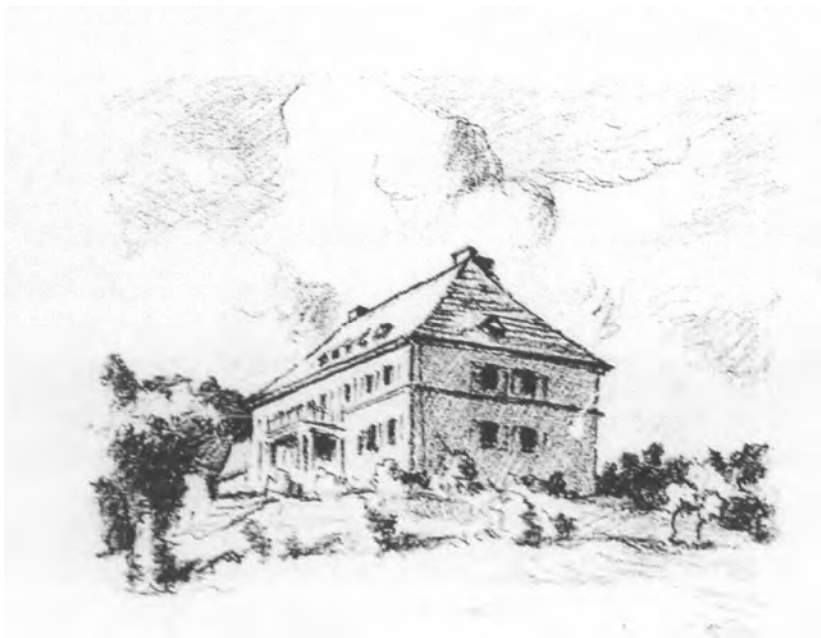
Rudolf Muchow, Pałac w Lejkowie, litografia, 1924

Wieś została zajęta przez Rosjan 2 marca 1945 roku. Niemcy zostali wysiedleni głównie w 1946 roku.