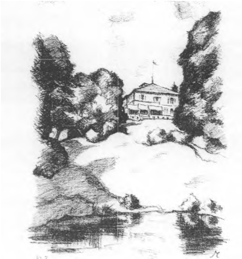
Rudolf Muchow, Pałac w Podgórkach, litografia, 1924

brecka i w rękach tej rodziny pozostawała do XVIII wieku. Następnie majątek przejęła rodzina Podewilsów z Ostrowca.