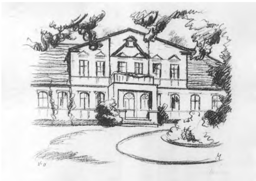
Rudolf Muchow, Pałac w Laskach, litografia, 1924

Laski leżą na południu gminy Malechowo przy drodze łączącej Borkowo i Jacinki.