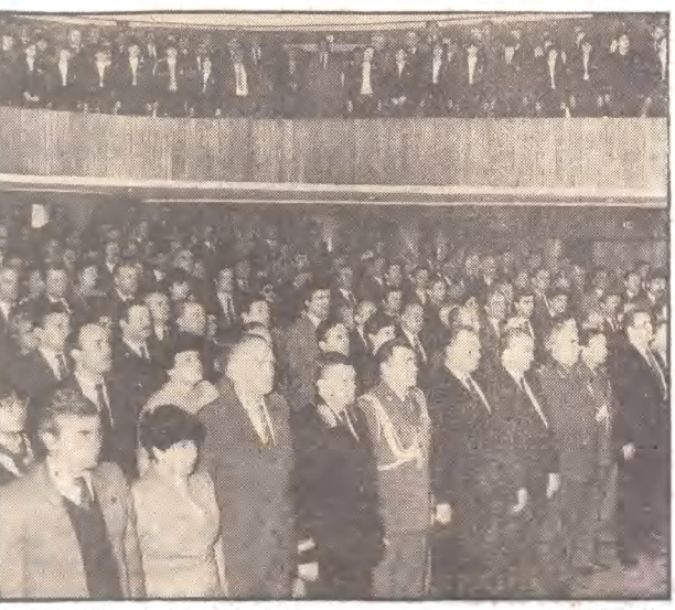
Uroczysta sesja w Teatrze „Wybrzeże”.

Przypominamy, że w nocy z 30 na 31 marca br. nastąpi w naszym kraju zmiana czasu zimowego na letni. O godzinie 1.00 trzeba przesuwać wska- zówki zegarków na 2.00. Tak więc 31 marca „póź- niej” o godzinie wszędzie i zajdzie słońce. Wschód nastąpi o godz. 6.13, a zachód o 18.08, a nie jak po- dają kalendarze o 6.13 i 18.08. Należałoby więc do- konać zmian także w tych zapisach. Nz.: Jeden z warszawskich kurantów na Starym Miście (jego też dotyczy zmiana czasu...)