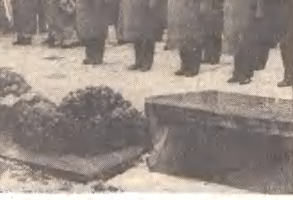
Składanie wieńców na Cmentarzu-Mauzoleum Żołnierzy Radzieckich.