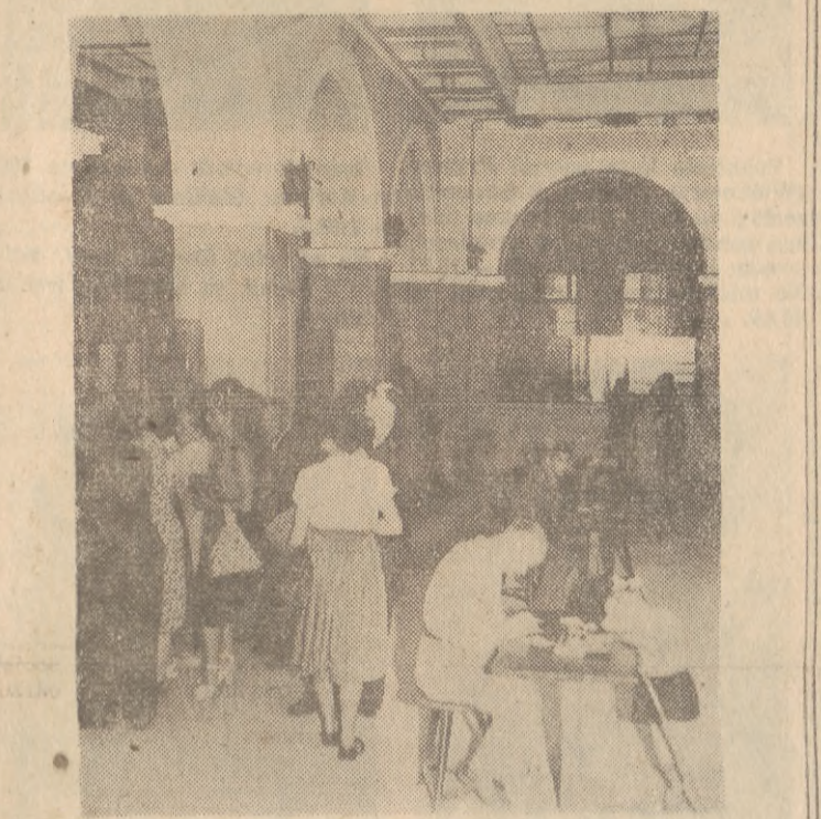
W nowoobudowanych kamieniczkach przy ul. Długiej pod nr 22 znalazł siedzibę Obwodowy Urząd Pocztowy Gdańsk 1, przeniesiony 26 bm. z ul. Bojowców 7/8.

Podkreślić należy wielką ofiarność pracowników urzędu, którzy bez względu na wiek i stanowisko własnymi siłami dokonali w ub. niedziele przenosin, dając dowód wysokiego wyrobienia społecznego i w całej pełni wykonując podjęte zobowiązanie obsługi klientów. W całym budynku pracy dla całej załogi i piękne wnętrza zabytkowego budynku, oto niektóre cechy oddanej do użytku mieszkańców Gdańska placówki pocztowej.