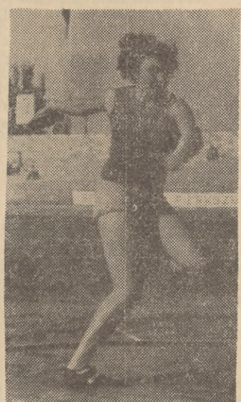
Wojnarowska (Spójnia — Gdańsk) zajęła w rzucie dyskiem II miejsce (38,44) ulegając tylko o 40 cm Konkównie.