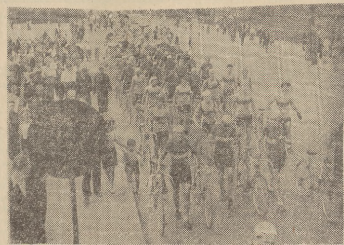
Kolarze, uczestniczący w I Wyścigu dookoła województwa gdańskiego, organizowanym przez redakcję „Dziennika Bałtyckiego”, ZW ZMP, WKKF i KS Stal przy Stoczni Gdańskiej, przemaszzerowali ulicami Gdańska na start ostry na Plac 1 Maja.