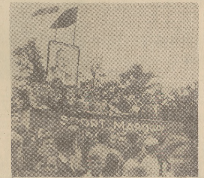
Z trybuny honorowej pożegnali kolarzy, startujących do I etapu, przedstawiciele młodzieży Wybrzeża.