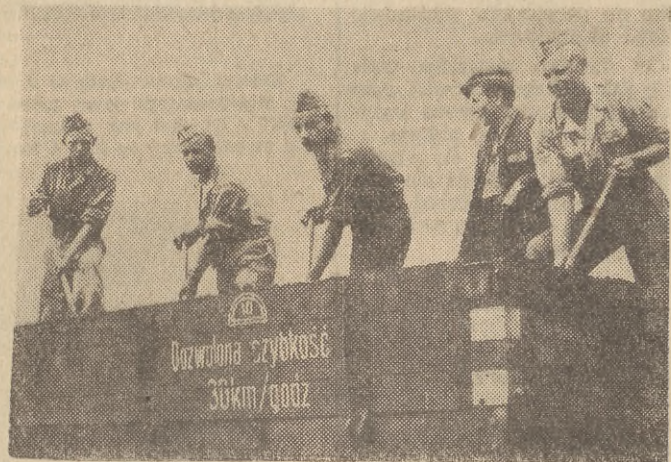
Również i dzięki nim — Junakom w zielonych mundurach, już w lipcu jeżdżą bedłami do Gdyni pociągami elektrycznymi.