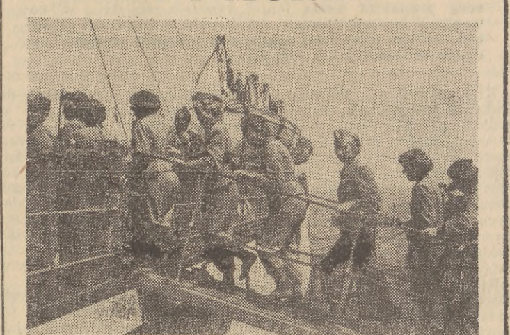
Trwające do 28 czerwca br. »Dni Morza« ściągną na Wybrzeże wycieczki z całego kraju. Pluton żeglowski z 173 Brygady »Stużba Polsce« w nagrodę za dobrą pracę w PGR Gajewo przyjechał do Sopotu. Junacy przybyli do brygady z woj. poznańskiego i wybrają od 175 do 180 proc. normy. Na zdjęciu: Junacy wchodzą na statek żeglugi przybrzeżnej »Panna Wodna«, by odbyć przejażdżkę po morzu.