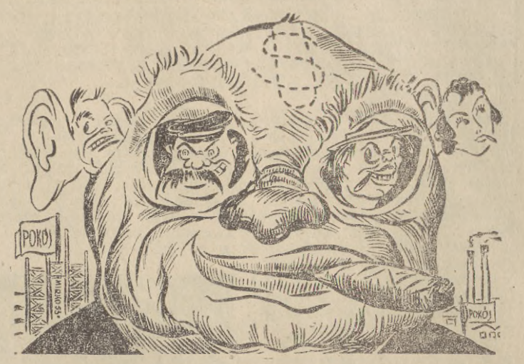
Wróg patrzy i słucha...