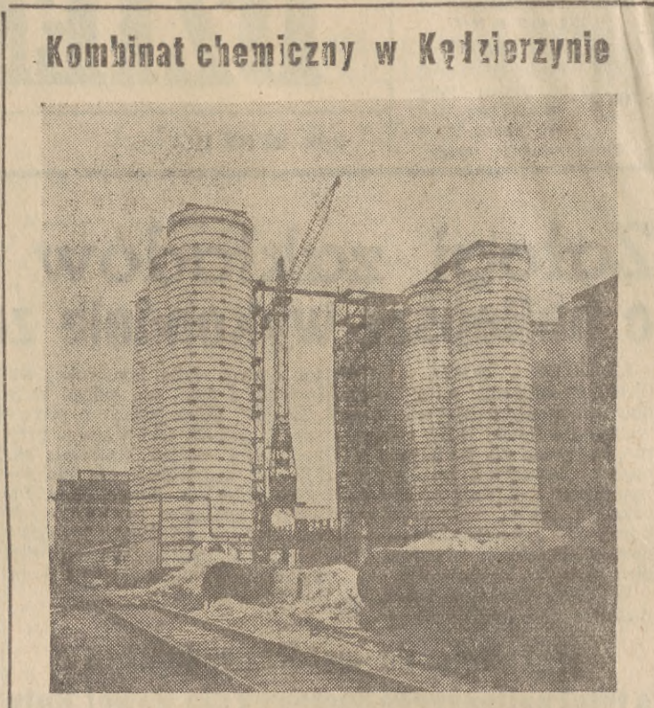
Kombinat chemiczny w Kędzierzynie W niedługim czasie rozpocznie się próbnny rozruch urządzeń poszczególnych oddziałów w obrytmym nowoczesnej fabryce nawozów azotowych — jednym z trzech wielkich działów kombinatu chemicznego w Kędzierzynie. W kilka miesięcy później fabryka wyprodukuje pierwszą partię wysoko wartościowych nawozów sztucznych. W miarę zbliżania się terminu uruchomienia zakładów kędzierzyńskich, przed założą i personelem technicznym stała zagadnienie zwiazane nie tylko z końcową fazą robót budowlanych, montażu maszyn i urządzeń, ale również z zagadnieniami skomplikowanych procesów wytwórczych różnych rodzajów nawozów. Zakłady w Kędzierzynie produkować będą bowiem m. in. nowe, nie wytwarzane dotąd rodzaje nawozów, dostosowane do potrzeb i wymagań rolnictwa. Tak np. zakłady wyprodukują saletryz granulowany, który jest nawozem o znacznie wyższej wartości użytkowej, w porównaniu ze znanym saletryzkiem, a równocześnie dużo łatwiejszy w użyciu. Również po raz pierwszy w kraju Zakłady Azotowe w Kędzierzynie Związku Radzieckiego, rozległą produkcję saletry amonowej granulowanej. Nawóz ten odznacza się wysoką zawartością azotu. Wysoka jakość azotu oznaczać będzie wytwarzanie w Kędzierzynie płynnego nawozu azotowego, przeznaczony głównie dla dużych gospodarstw rolnych. W przyszłości produkowany będzie również nawóz zawierający najwyższy ze wszystkich nawozów procent azotu — tzw. mocznik. O wielkości produkcji Zakładów Przemysłu Azotowego w Kędzierzynie świadczy fakt, że już w pierwszym etapie na uruchomienie dawać one będą dwukrotnie więcej nawozów, niż obecnie Zakłady Azotowe w Chorzowie i Tarnobrzegu łącznie. W momencie pełnego uruchomienia Zakładów produkcja ich wzrośnie o 60 proc. Na zdjęciu: Fragmenty wież absorpcyjnych w Zakładach Azotowych CAP

Dziś, po latach dziesięciu, wspomniany te historyczne wydarzenia skupieni w szeregach Frontu Narodowego walki o pokój i Plan 6-letni, w warunkach zwycięstwa władzy ludowej, w sytuacji, kiedy obóz demokracji i pokoju odnosi wielkie zwycięstwa. Przygotował je między innymi również czyn Kościuszkowców, D. J. Płoński