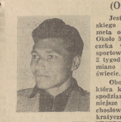
nych językach: MIR, FRIEDEN, POKÓJ, to jednak treść była ta sama.

Jesteśmy na stadionie Wojska Polskiego w Warszawie, gdzie znajduje się meta ostatniego etapu Wyścigu Pokoju. Około 50 tysięcy widzów przez 3 godziny czeka wytrwale na stadionie by powitać sportowców wielu krajów, którzy przez 2 tygodnie walczyli na trasie 2200 km o miano najlepszego kolarza amatora na świecie.