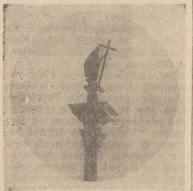
Fragment kolumny Zygmunta

Na stole leży stary, pożyłkiły z paroletniej starości numer warszawskiej gazety. Z płachty porzuczonego papieru patrzy pomarszczona twarz staruszki: porwana brudnymi rękami sypie na