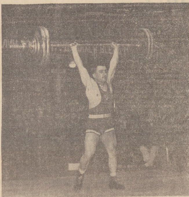
Mistrz olimpijski Czimizskian w czasie pokazów w Polsce w 1951 r.

ich wspaniałą klasę, dotychczas dla naszych zawodników niedoścignioną. W czasie pobytu radzieckich sztangiistów