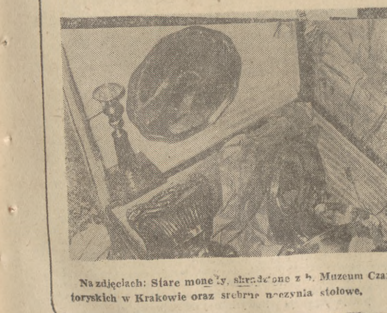
Na zdjęciach: Stare monety, srebrzone z h. Muzeum Czartoryskich w Krakowie oraz srebrne naczynia stołowe.