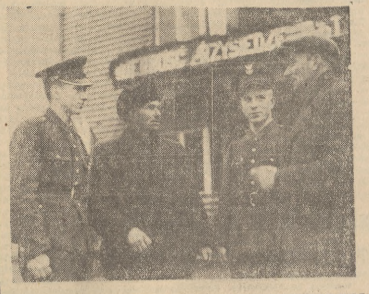
MEŁDY ROCZNIK POKOROWY CH SKŁADA PRZYSIĘGĘ WOJSKOWĄ NA WIERNOŚĆ NARODOWI POLSKIEMU