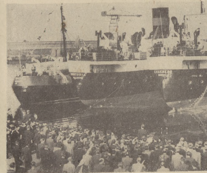
Stocznicy i goście z przodujących zakładów przemysłu ciężkiego z całej Polski serdecznie żegnali nowe statki, które w dniu Konferencji opuściły stocznice.