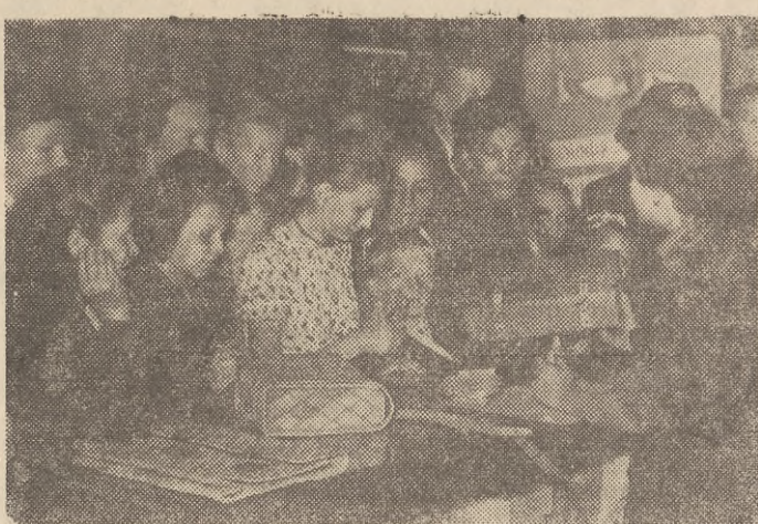
Na zdjęciu: Młodzież zao patruje się w teczki i tornistry w domu towarowym.