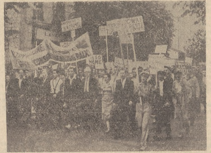
Cała Francja przyjęła amerykańskiego gaulitera Europy, generała Ridgway'a falą demonstracji i strajków. Na setkach manifestacji, które odbyły się we wszystkich departamentach Francji, rozlegały się okrzyki: „Ridgway mordera! Precz z Pinay'em!” Na zdjęciu: Manifestacja w Vitry. Tłum wznosi okrzyki protestacyjne. Napisy gloszą: „Ridgway — wynoś się, Pinay również”.

W Bordeaux policja szarżowała na pochod uliczny. Na dworcu odbył się wielki wiecu kolejarzy. Dokerzy Bordeaux strajkowali 6 godzin.