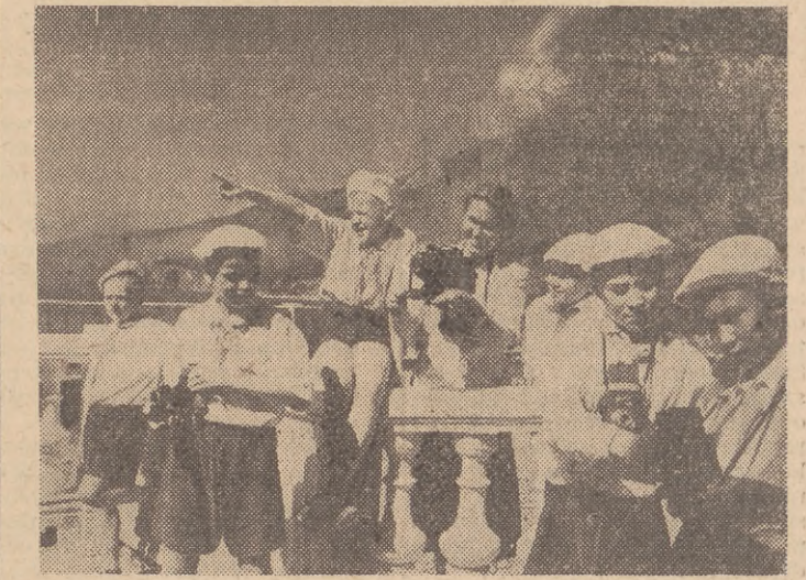
W Związku Radzieckim w 1951 roku ponad 6 milionów dzieci odpoczywało latem w obozach pionierskich, w sanatoriach, w schroniskach turystycznych itp. Na zdjęciu: Pionierzy na obozie w Arteku uczą się fotografować.