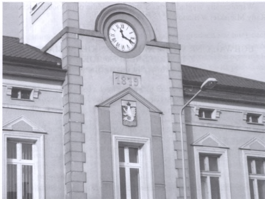
Wieża ratuszowa ozdobiona jest herbem Święców