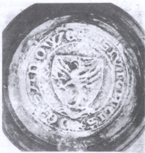
Na pieczęci Sianowa dostrzegamy herb rodu Święców

Najstarsza pieczęć miejska Sianowa ma średnicę 44 mm i pochodzi z XIV-stulecia. Na kratkowanym tle przedstawia ona tarczę herbową z rybogryfem zwróconym w prawo. Poniżej widnieje sfalowana woda. Na obwodzie odczytujemy napis: S ? SIVITATIS DE SANOWE.