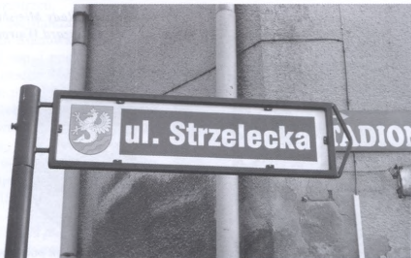
Herb dostrzec możemy także na tabliczkach nazywających ulice