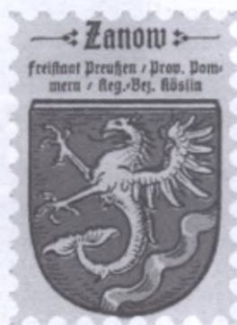
Przedwojenny znaczek pocztowy z wizerunkiem herbu Sianowa