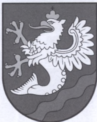
Współczesny herb Sianowa