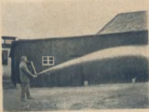
Wintrich-Schaumlöscher in Tätigkeit

Wintrich-Schaumlöscher werden auch in Spezialausführung zum Mitführen auf Kraftfahrzeugen, mit Spezialverschlußkappe und Riemenaufhänger geliefert. Der Mehrpreis beträgt bei normalen und frostsicheren Ausführungen für S 5 und S 15 jeweils RM 5.— für S 10 RM 7.— Die Maße und Gewichte sind für sämtliche Ausführungen gleich.