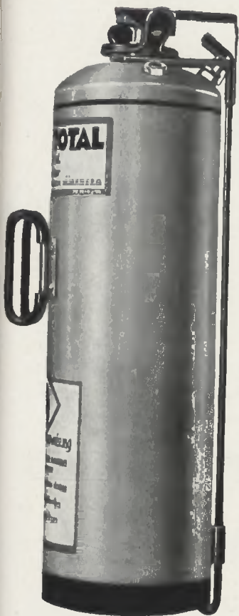
Apparat In der Aufhängevorrichtung.

Leicht zu kontrollieren, ohne Füllung zu vergeuden.