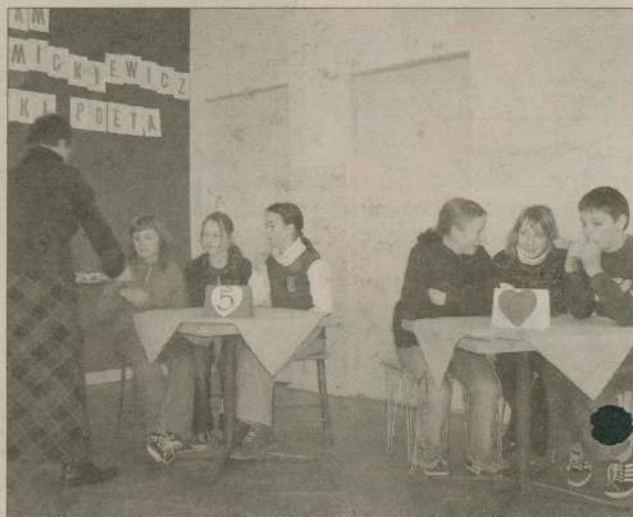
W szkole w Bukowie Adam Mickiewicz jest już postacią dobrze znaną.