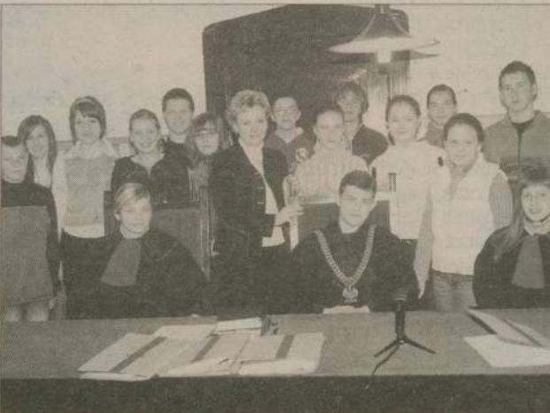
Pod okiem prezes sądu w Człuchowie (w środku) uczniowie dali też pierwsze próbnego przedstawienie „Sądu nad cywilizacją”.