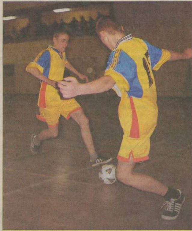
Po trzeciej kolejce dotychczasowy lider, OHP A, spadł na drugą pozycję.