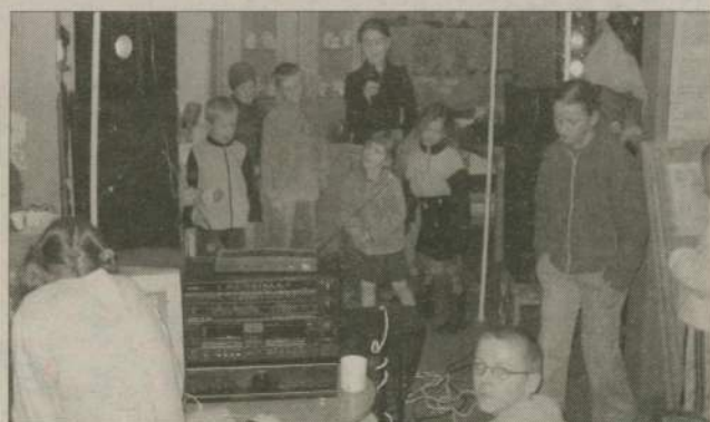
Jak twierdzą opiekunowie to spotkanie dało początek przyjazni i dalszym wzajemnym odwiedzinom.