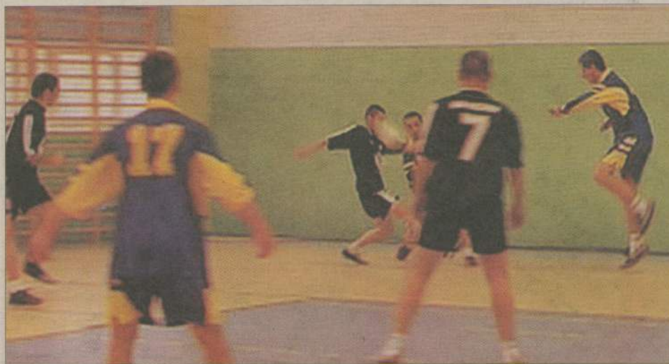
Kibice nie mogą narzekać na brak emocjonujących akcji i goli.

ZK Czarne - Hubbard 4:6 ZMW Bińcze - Trans Złom 4:14 ZMW Wyczechy II - ZMW Krzemieniewo 14:7 Aro Tim - Pal Drew 6:6 Leśnik Czarne - ZMW Wyczechy I 5:2