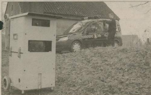
Ten fotoradar w krótkim czasie zrobił mieszkance Szczecinka cztery zdjęcia. Na fotografii Przemysław Wawron, strażnik gminny.