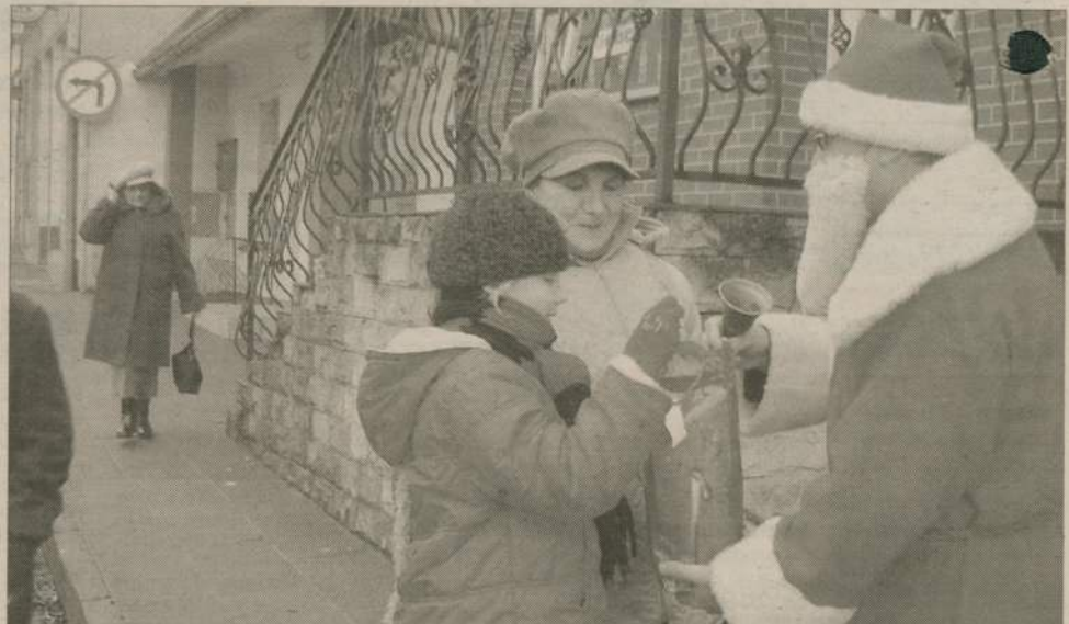
Ten nietypowy Mikołaj spacerował ulicami Debrzna. Bardziej spozstrzegawczy debrznianie rozpozнали w nim burmistrza.