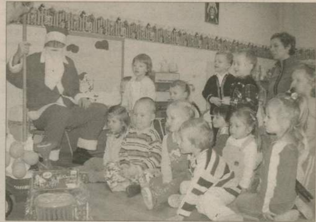
Najmłodsze przedszkolaki z ulicy Jacka i Agatki gościami z brodą przyjmowały w przedszkolu. Ich starsi koledzy bawili się w tym czasie na mikołajkach w Ośrodku Sportu i Rekreacji.