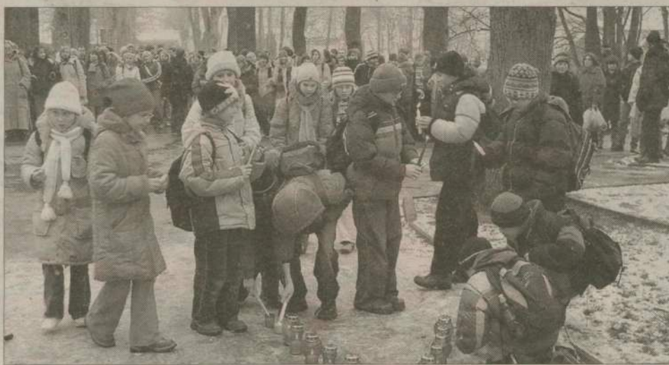
Czerwone lampki w kształcie wstążeczki - międzynarodowego symbolu solidarności z ludźmi żyjącymi z HIV i chorującymi na AIDS młodzież zapaliła w tym roku nie na Rynku, a przy zamku.