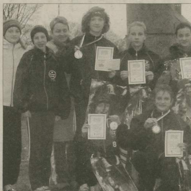
Lekkoatletki LKS Prime Food Brda wróciły z Jarosławca z trzema medalami.