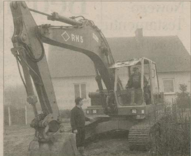
Z nowego wodociągu mieszkańcy będą mogli korzystać już w połowie grudnia.