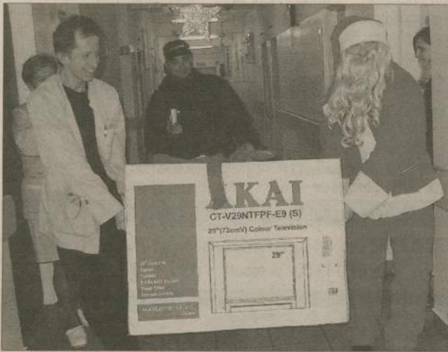
Telewizor, który trafił na oddział dziecięcy człuchowskiego szpitala ufundowali chorym dzieciom gimnazjaliści z Człuchowa.