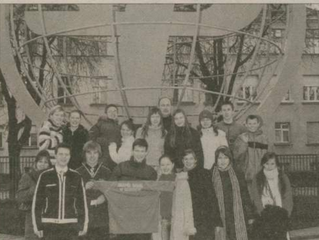
W Poznaniu oprócz Targów (na zdjęciu) młodzież zwiedziła starówkę i poznańską Farę.