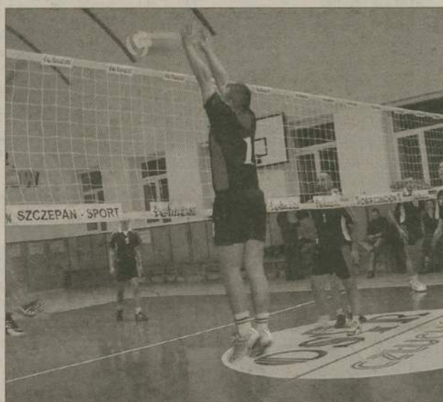
Politologii/Szczepan udało się skutecznie zablokować ataki mistrza ligi z ubiegłego sezonu - zespołu Poldanor Koczała.

W ostatnim sobotnim meczu weterani z Politologii/Szczepan wygrali z Poldanorem Koczała 3:2. Obie drużyny nie ustrzegły się jednak prostych błędów, sporo ataków i zagrywek trafiało w siatkę. Pierwszy set bez problemu wygrała Politologia, w drugim koczałanie nie potrafili utrzymać kilkupunktowej przewagi wypracowanej na początku i od remisu 10:10 toczyła się zacięta walka o każdą piłkę, zakończona szczęśliwie dla koczałan. W trzecim secie znów górą była Politologia, wygrała 28:26. W czwartym Poldanor doprowadził do remisu i o zwycięstwie zadecydował tie-break. Jutro o godz. 13.30 rozpocznie się zaległy mecz Poldanoru z Prime Foodem, o godz. 15 zagra Sławęcina z Poldanorem, o 16.30 - SdN z Prime Foodem, a na 18 zaplanowano pojedynki drużyn z Człuchowa. (deef)