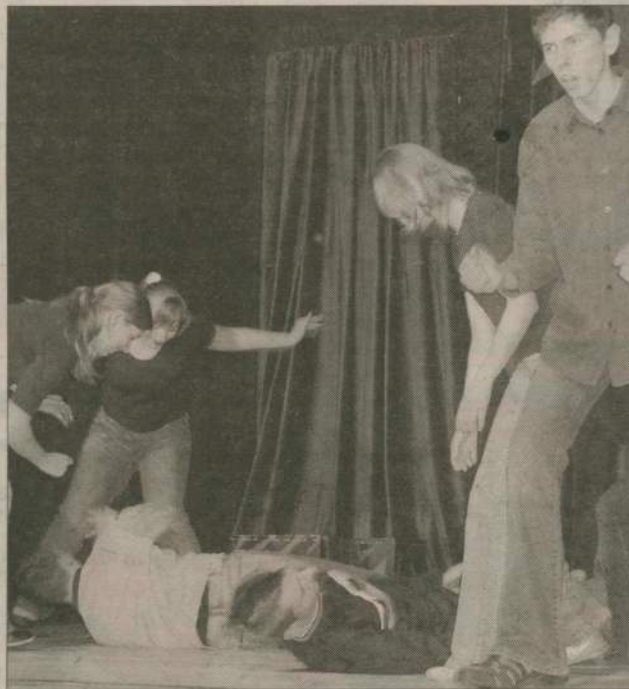
Spektakl „To...” rozbawił widzów do łez. Jednak jego przekaz był jasny - „To...” jest zaraźliwe i zabija. Pokazał też jak się przed „Tym...” chronić.

W tym roku uczestniczyło w nim aż 11 grup teatralnych - łącznie ponad 100 wykonawców. Z roku na rok rośnie też poziom spektakli. W gronie jury konkursowego rozważano nawet możliwość zmiany formy konkursu na przegląd - aby móc wyróżnić wszystkich uczestników. O tym, że spektakle się podobały świadczyła żywiołowa reakcja widowni. Młodzież szczególnie oklaskiwała "W