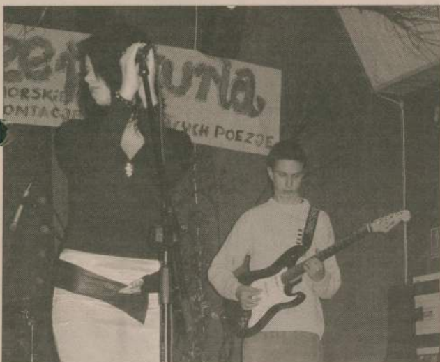
NoLi z Debrzna jak zwykle zaprezentowało się bardzo dobrze.