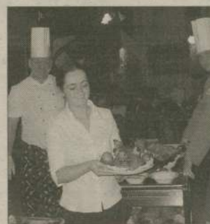
Może nie najłatwiejszy do zjedzenia, ale na pewno najładniejszy kąsek wieczoru...