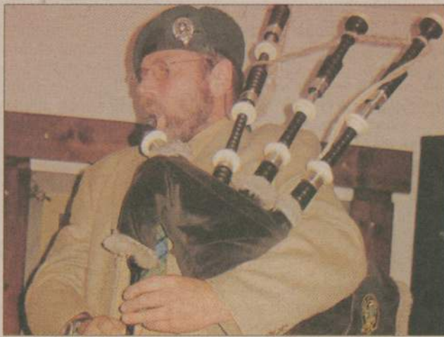
Nawet debrznianie nie znają nazwiska Niemca, który w ich miasteczku pojawia się dość często. Niemiec zwany Szkotem tuż przed loterią zagrał koncert na kobzie.