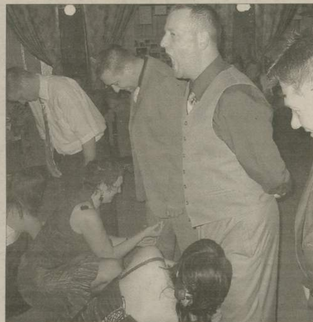
Znany i lubiany konkurs z jajkiem. Najbardziej zabawny był jak zwykle dla publiczności.