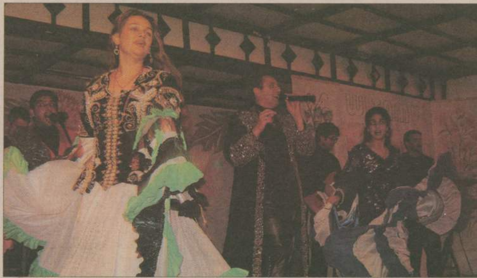
Zarówno muzyka jak i piękne tancerki zrobiły duże wrażenie na więźniach.