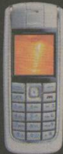
Nokia 6020 od 1 zł brutto