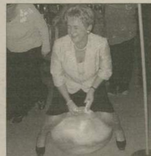
W tej konkurencji sprawnościowej mogły popisać się także panie.