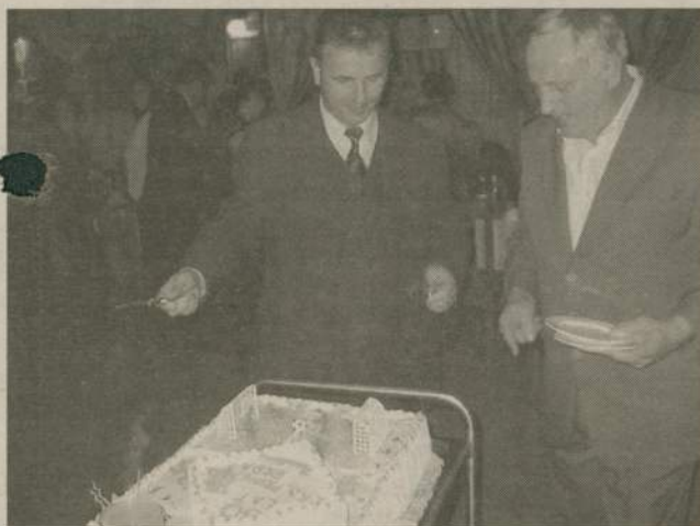
Hitem balu był ponad 20 kilogramowy tort z ponad 100 jaj imitujący płytę boiska z graczami i bramkami oraz pieczone prosiaki i szynki.