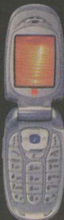
Samsung X480 od 1 zł brutto

Przyłącz się do nas, wybierz ofertę Twój Plan, a otrzymasz świąteczny prezent - Darmowe Rozmowy z wybranym numerem przez pół roku oraz SMS-y za 1 grosz.