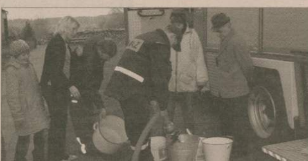
Zarówno mieszkańcy Międzyborza jak i strażacy z Rzeczenicy w końcu mogą odpocząć.