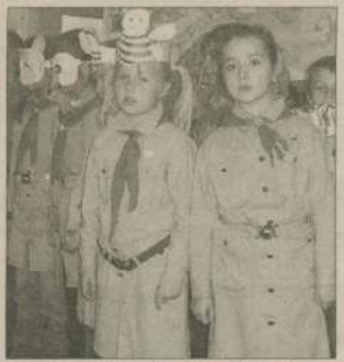
Spotkanie zakończyło się wspólnymi piasmami.