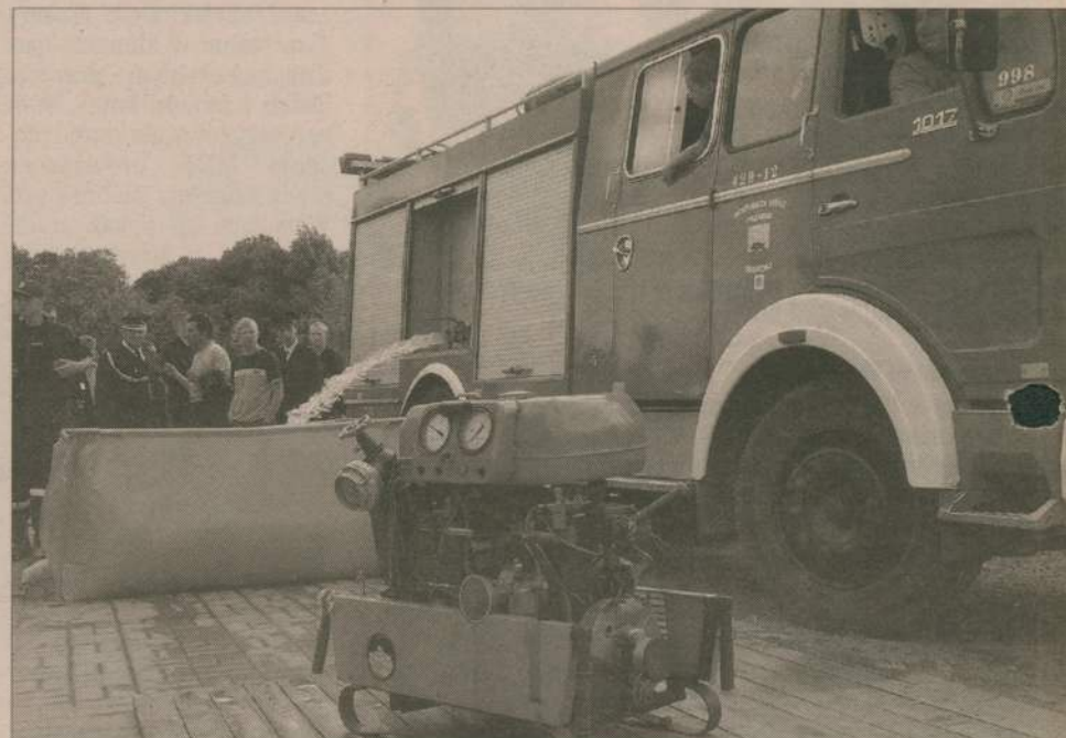
Gminne zawody OSP odbywały się przy okazji sześćdziesięciolecia jednostki. Debrznianie zajęli w nich drugie miejsce.