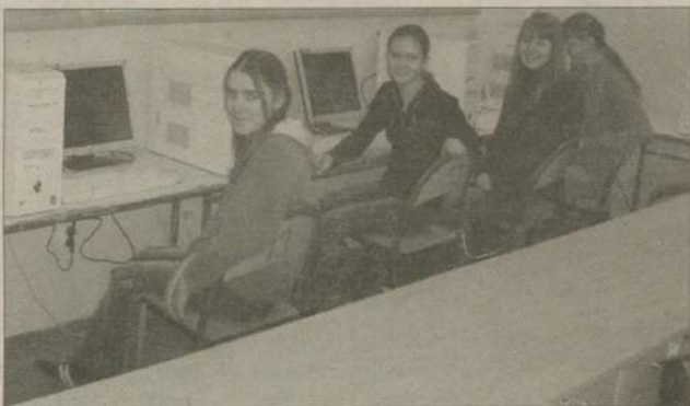
Pracownie są wykorzystywane także po lekcjach, w ramach zajęć świetlicowych.