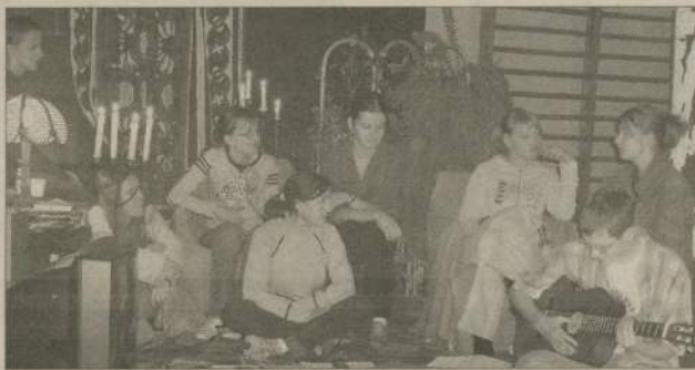
Dziś odbędzie się podsumowanie tygodnia profilaktyki. Na zdjęciu - młodzież gimnazjum w „Kronice śmierci przedwczesnej”

profilaktyki uczniowie człuchowskiego gimnazjum. Wystawy, pogadanki, debaty i przedstawienia odbywały się w także w szkołach ponadgimnazjalnych. Podsumowanie akcji, a także konkursów: