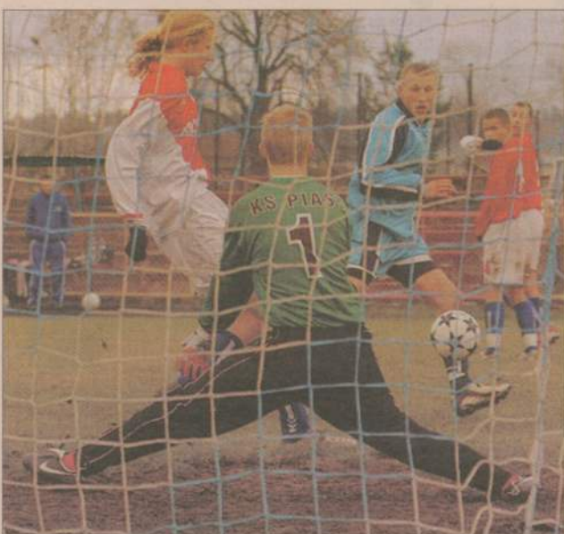
Bramkarz Piasta nie wpuścił w tym meczu ani jednej bramki.