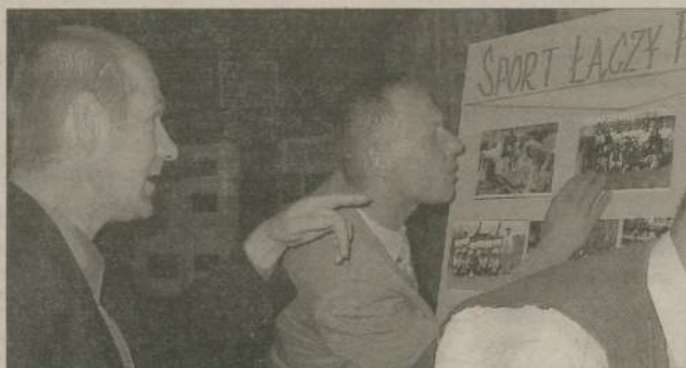
Na scenie głównej i w holu restauracji organizatorzy zaprezentowali 60 letni dorobek klubu w postaci wystawy fotografii z ponad 300 zdjęciami, 100 pucharami, 30 dyplomami. Wśród trofeów znalazły się także te uzyskane przez sport szkolny.