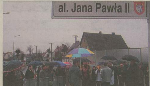
Człuchowianie oddali hołd Papieżowi m.in. nadając jego imię alei przy obwodnicy. Dziś znowu będą mogli udowodnić, że nie zapomnieli o Janie Pawle II.

Nie skończyło się na zapowiedziach i planach. Miejski Dom Kultury w Człuchowie organizuje wieczór poświęcony Papieżowi Janowi Pawłowi II. Dziś, 20 maja o godz. 19.00 otwarta zostanie wystawa pamiątek ze zbiorów prywatnych. Zobaczyć będzie można m.in. książki, publikacje poświęcone Papieżowi, medale, rzeźby, znaczki... Podczas wieczoru czytane będą wiersze Karola Wojtyły. Zaplanowano także montaż muzyczny i prezentację multimedialną „Symbol”. Wstęp jest wolny. Wszystkich w imieniu organizatorów serdecznie na ten papieski wieczór zapraszamy.