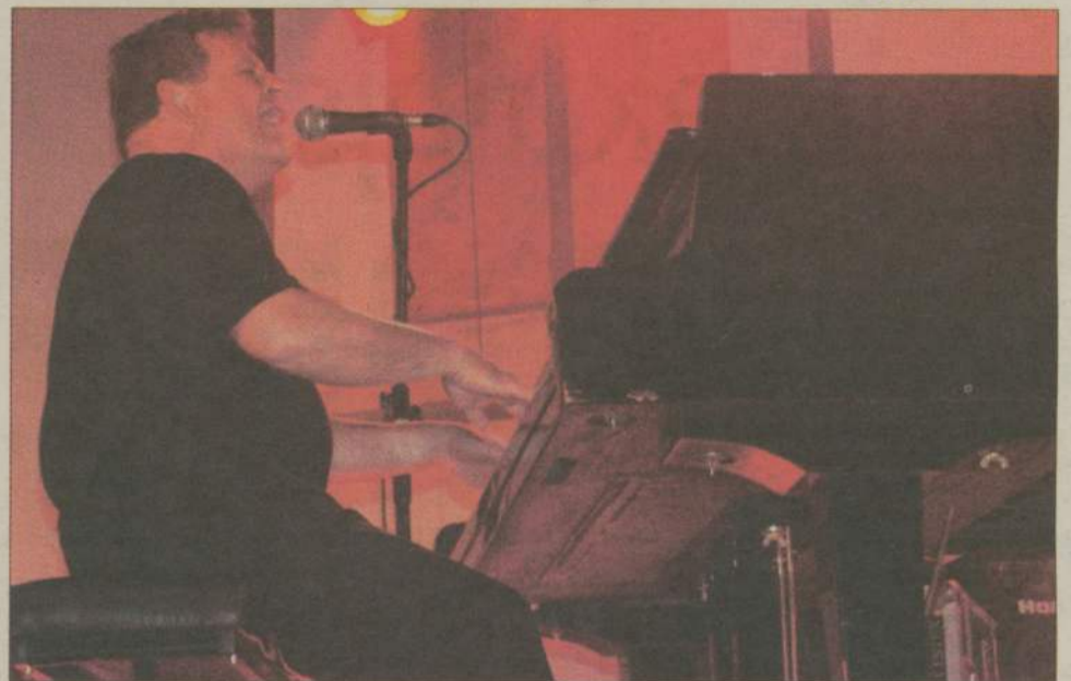
Al Copley, gwiazda światowego formatu, genialnie nawiązał kontakt z publicznością. Jego koncert nagrodzono owacją na stojąco.

Człuchowianie byli pod wrażeniem miejsca, muzyki, ale także otwartości wirtuozów, którzy po skończonym koncercie nie schodzili do