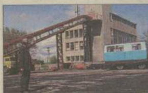
Mieszkańcy wspólnoty będą mieli nie tylko ciepłej, ale i ładniej.

Na osiedlu jest kilka wspólnot mieszkaniowych. Niektóre z nich już dociepliły swoje budynki. (pif)