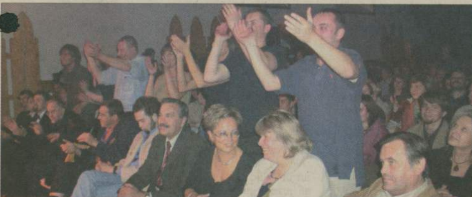
Publiczność nie ukrywała, że bawi się wyśmienicie.