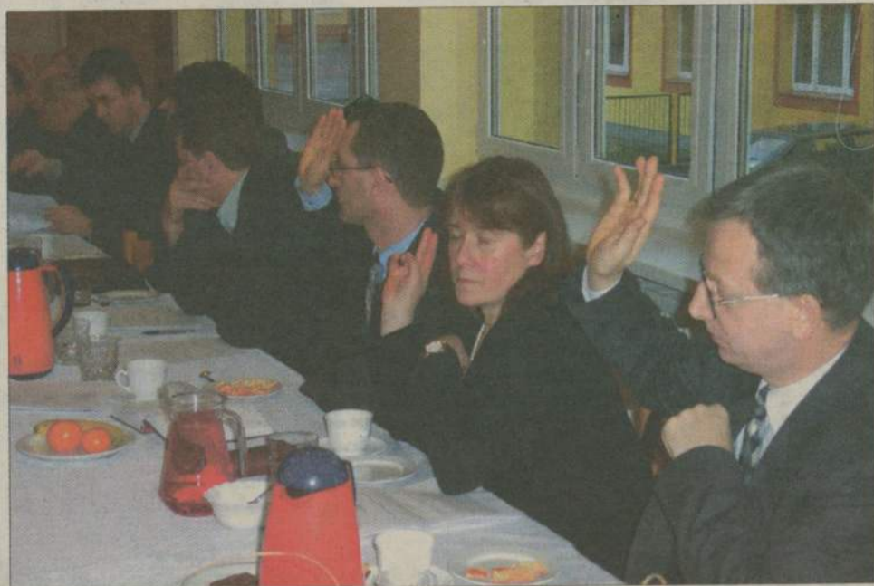
Oświadczenia majątkowe radnych powiatowych w tym roku bardzo szybko pojawiły się w Biuletynie Informacji Publicznej.