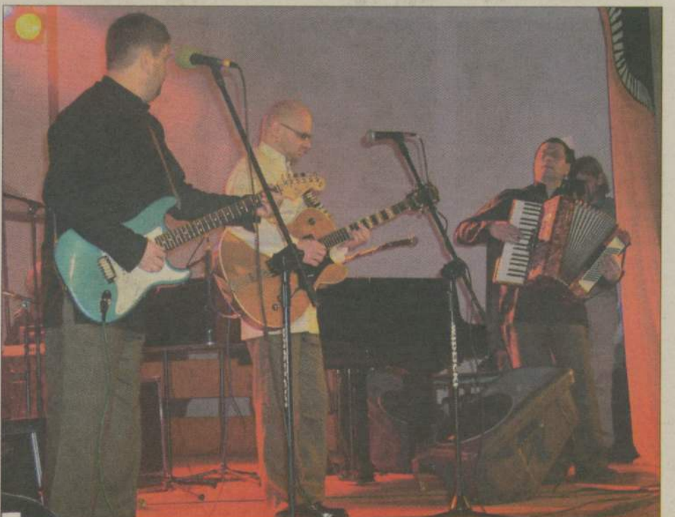
Blues Flowers wnieśli do festiwalu żart słowny.