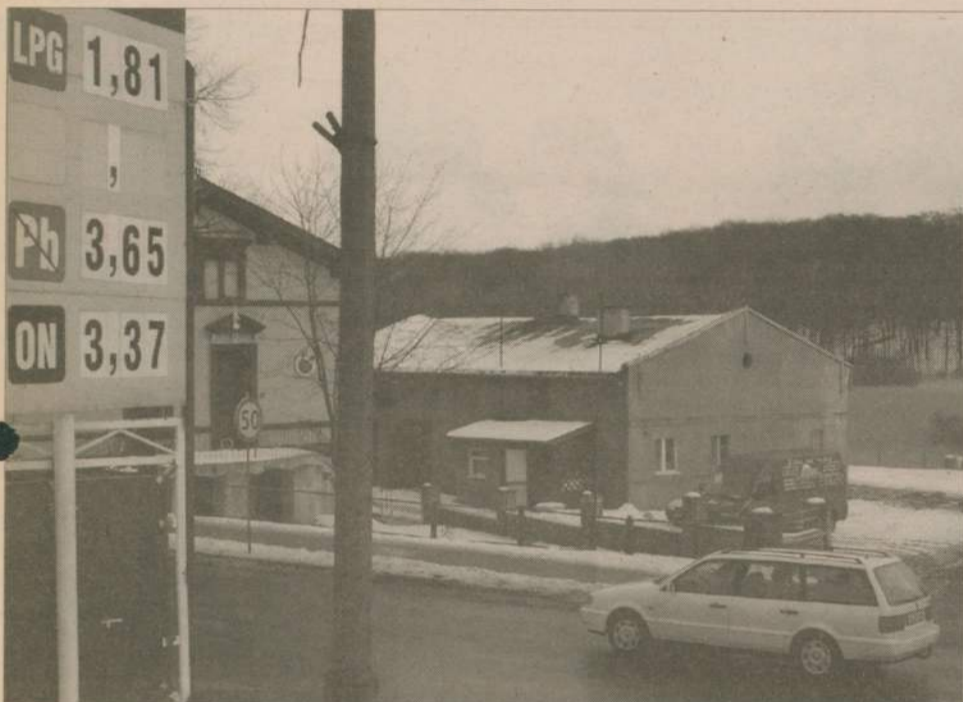
Region słupski to największe bezrobocie i... najwyższe ceny gazu.