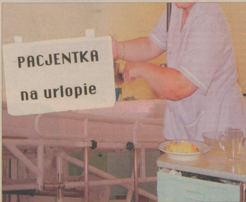
collage S. Gliwka

Formalnie wszystko jest w porządku. Pacjentkę przyjęto na oddział z powodu bólów brzucha 22 lutego i wypisano po ustąpieniu dolegliwości w stanie ogólnym dobrym 28 lutego. Dokumentacja zawiera zgodę pacjentki na leczenie szpitalne, informacje o zastosowanym leczeniu zachowawczym, wynik badania moczu, a nawet... kartę gorącz-