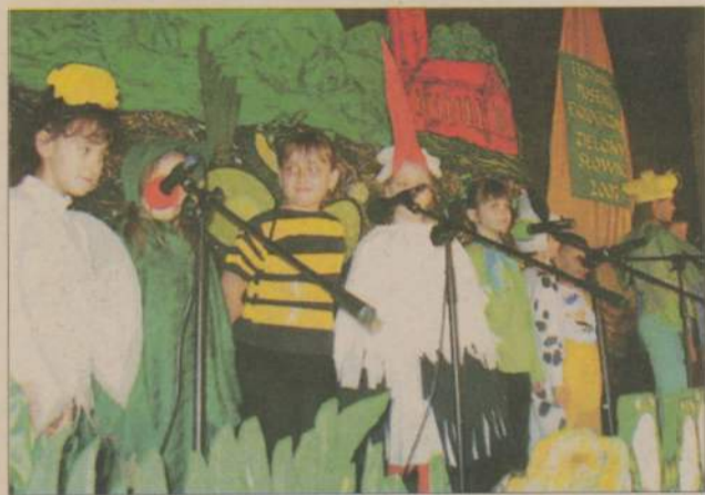
Zielony Słowik zaśpiewa już po raz czwarty.