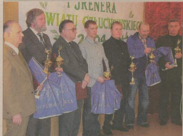
Nie wszyscy najlepsi sportowcy mogli być obecni na uroczystości w bursie. W ich imieniu nagrody odebrali trenerzy bądź rodzice.