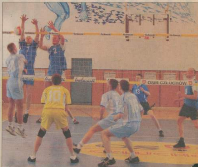
Stoczniovec Gdańsk nie sprostał LKS Kołczygłowy.