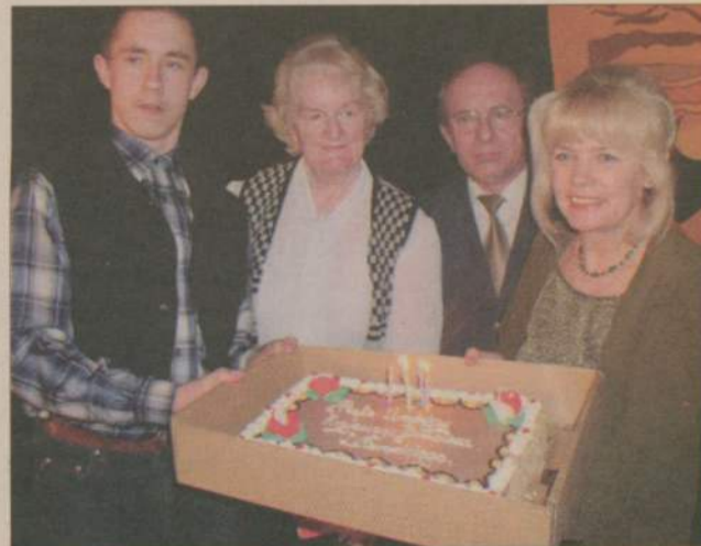
Czy i w tym roku nie zabraknie gości z Koszalina i tortu?

Filia w Człuchowie jest jedyną, jaką bractwo utworzyło poza Koszalinem. Zarząd stowarzyszenia bywa tu tyl-