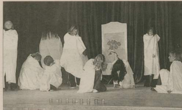
Debrznieńska młodzież zawiezie „Ostatnią spowiedź” do Wrocławia.