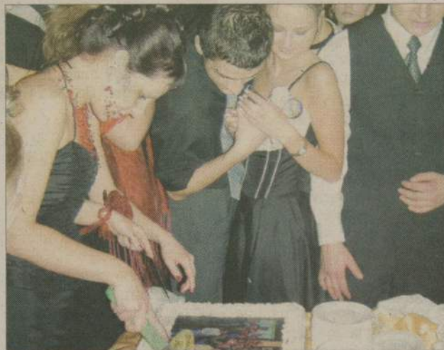
Tort ze zdjęciem uczniów nie był jedyną atrakcją balu.

W ubiegłym tygodniu bawili się uczniowie Zespołu Szkół Ponadgimnazjalnych, Zespołu Szkół Technicznych oraz Zespołu Szkół Technicznych. Studniówka rozpoczęła się tradycyjnym polonezem, a po nim przyszedł czas na walca angielskiego oraz wiekańskiego. Jak tradycja każe każda dziewczyna miała na sobie czerwoną bieliznę,