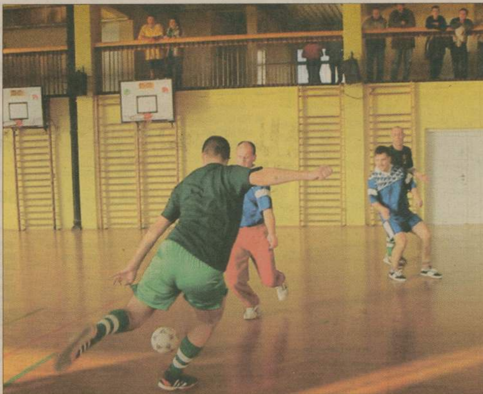
Wędkarze okazali się lepsi od policjantów i weszli do finału rozgrywek.