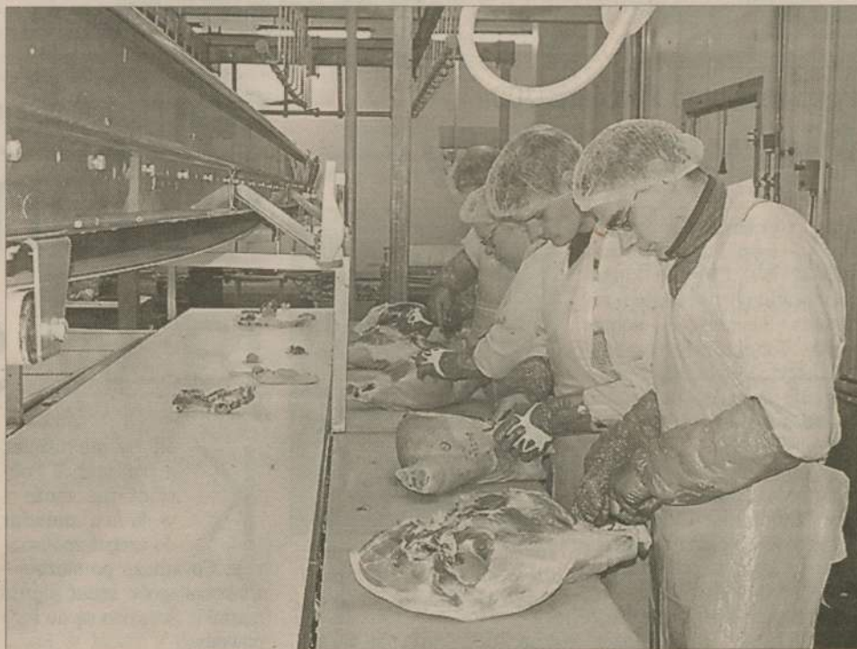
Jedną z firm, która w ubiegłym roku zwiększyła liczbę pracowników, jest Prime Food w Przechlewie.