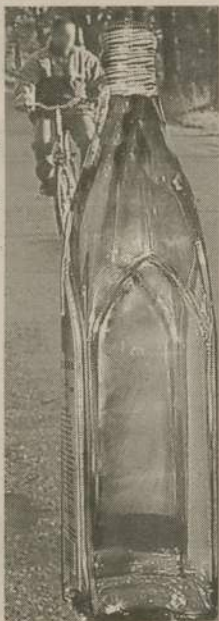
Collage: S. Gliwka