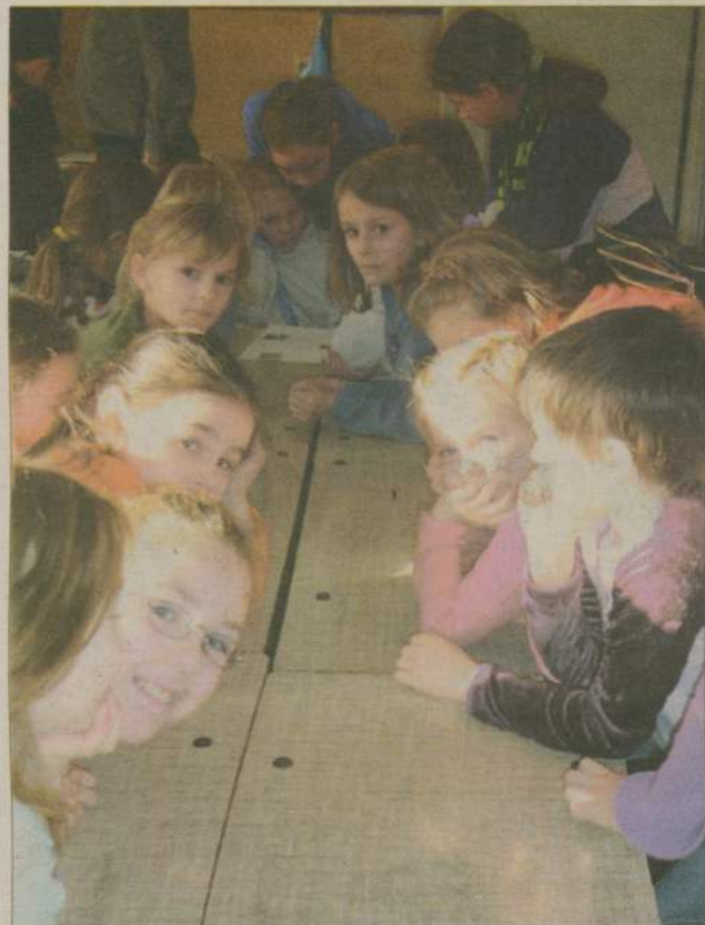
Sporo radości dało dzieciom wspólne rozwiązywanie testów i zabawy manualne.