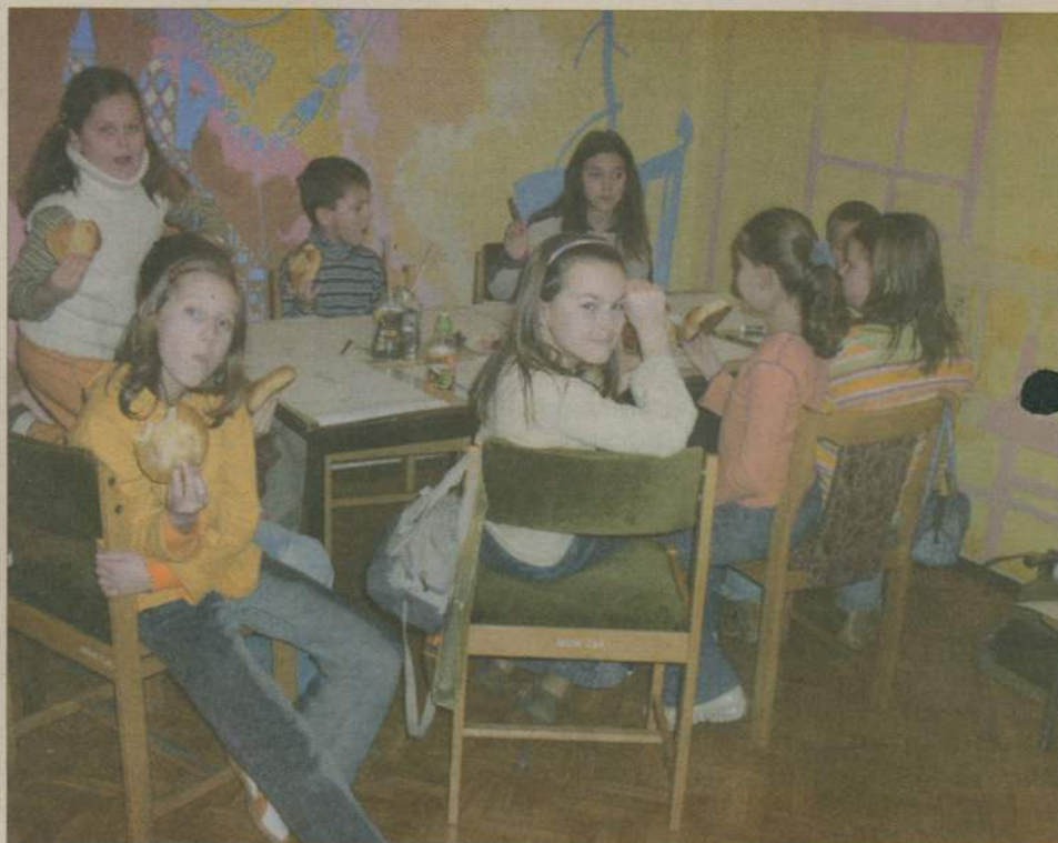
Uczniowie podczas ferii złaknieli są zabawy. Ale przyda się też coś „na ząb”. W człuchowskim MDK pomysłało i o tym.

Jak tu się cieszyć zimowymi wakacjami kiedy śniegu ani na lekarstwo? Mimo wszystko można i trzeba, bo... następane dopiero za rok. Na szczęście w zwalczanie nudy włączyły się lokalne ośrodki sportowe, domy kultury i szkoły. Rozwiązywanie krzyżówek czy raczej maraton na skakance i kręcenie hula hop? A może układanie wieży ze słomek albo turniej warcabowy? - te i wiele innych atrakcji proponuje Dom Kultury w Przechlewie. W programie tutejszych imprez feryjnych znalazły się także dzień kulinarny, maraton uśmiechu, lepienie figurek z masy solnej i odgadywanie artykułów spożywczych po smaku. A na zakończenie obowiązkowo - ognisko. Każda placówka ma własne pomysły na zagospodarowanie uczniom czasu wolnego od szkoły. Warto sprawdzić. Stefania Gliwka