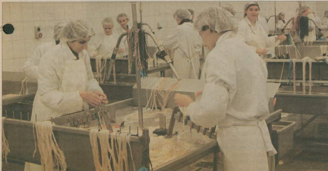
W jelielni West Pol w Rzeczenicy już teraz pracuje około sto osób. Zatrudnienie będzie jednak wzrastało.

Około 900 osób zmniejszyła się w ciągu roku liczba osób zarejestrowanych w Powiatowym Urzędzie Pracy. Wpływ na to miało powstanie nowych zakładów pracy - takich jak chociażby rzeczenicka jelielnia oraz rozwój tych istniejących, które zwiększały zatrudnienie