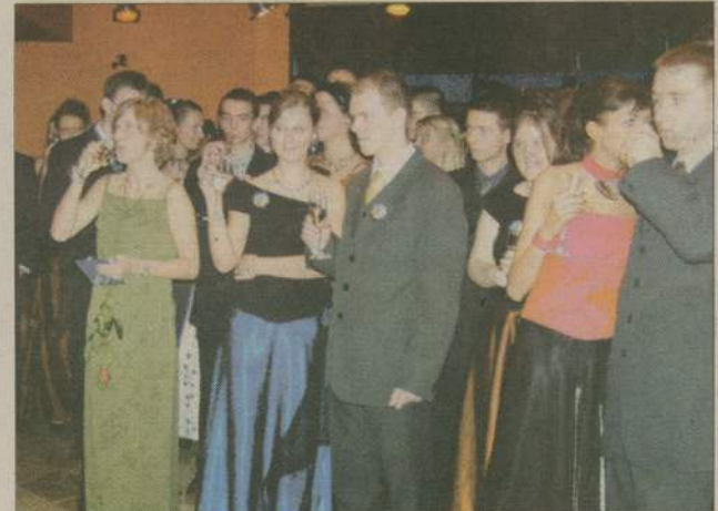
Uczniowie wzniesli toast za dobrą zabawę i pomyślne zdanie matury.

Zabrzmiął polonez, zaszeleściły suknie. Trwało to kilka, kilkanaście minut, ale tę chwilę wszyscy zapamiętają do końca życia. Dyrektorzy gratulowali uczniom dotarcia do studniówki, życzyli pomyślnego zdania matury oraz dostania się na wymarzone studia wyższe. Uczniowie podziękowali nauczycielom za włożony trud i poświęcenie w ich kształceniu.