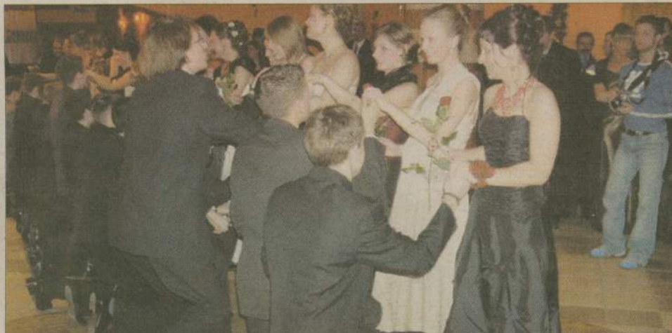
Prawdziwą klasę pokazali panowie. Paniom poproszonym do tańca w taki sposób nie wypadało odmówić.