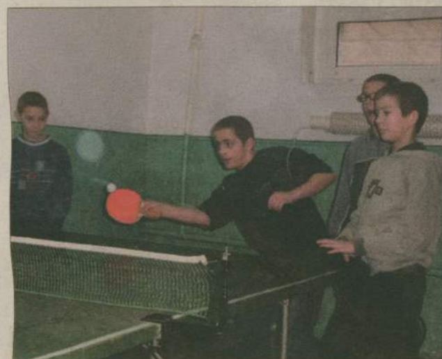
Przy zielonym stole rozgrywano zacięte pojedynki.