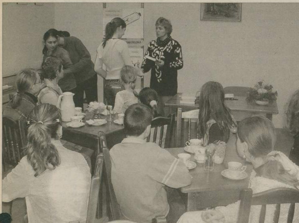
Nagrodami w konkursie były oczywiście cenne książki.