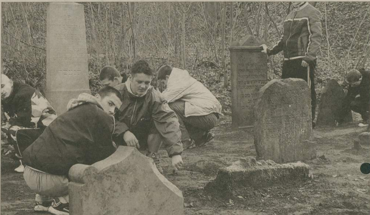
Dla tych chłopców porządkowanie żydowskiego cmentarza stało się pasją.