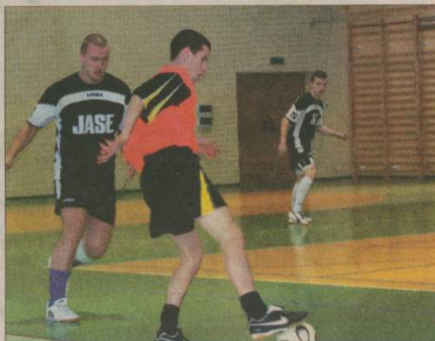
Niezwykle zacięty był już pierwszy mecz gdzie zespół ze Słupska zmierzył się z ekipą z Kartuz.