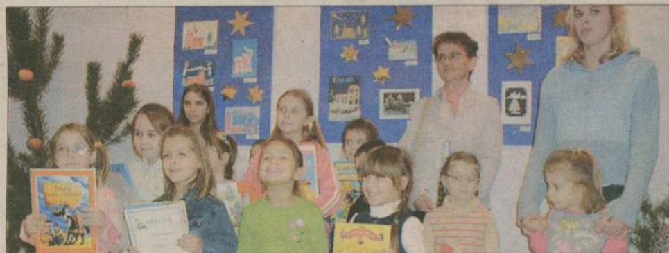
Pamiątkowe zdjęcie nagrodzonych uczestników konkursu.

Przedświąteczny konkurs plastyczny podsumowano także w Centrum Kultury Sportu i Turystyki w Debrznie. Prezentujemy zwycięzców w poszczególnych kategoriach i niektóre prace.