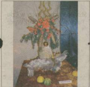
Korzeń drzewa w wersji świątecznej Stanisławy Sierant.