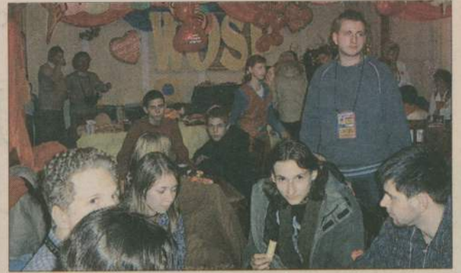
Czerwone baloniki, serduszka, ale przede wszystkim - wolontariusze co roku przypominają nam, że ruszyła WOŚP.

również w tym roku nie zabraknie przepięknych prac i ciekawych przedmiotów - czekamy na nie w Miejskim Domu Kultury (ul. Traugutta 2). Jesteśmy ciągle otwarci na nowe, ciekawe pomysły orkiestrowe, które chętnie włączymy do naszego programu. Szczegółowy program podamy jeszcze przed nowym rokiem. (ZEB. STEF)