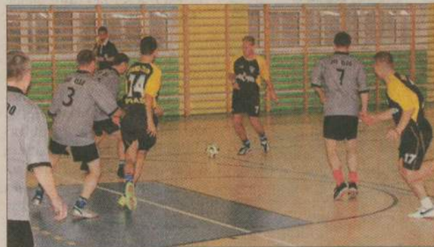
V kolejka dostarczyła dużo emocji i... zmian tabeli.