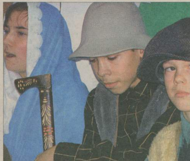
Przybieżeli... bohaterowie jasełek w Skowarnkach.