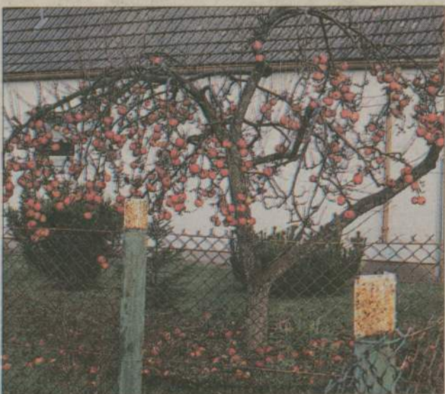
Ulica Kwiatowa to nie tylko kwiaty. Przy jednym z sąsiednich domów stoi jabłoń.