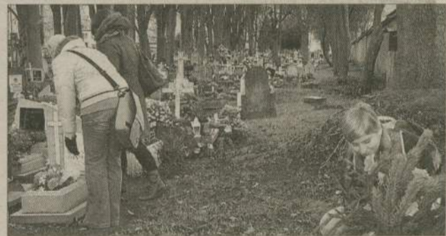
W poniedziałek młodzież z człuchowskiego „spofecznika” zabrała się za porządki na starym cmentarzu.