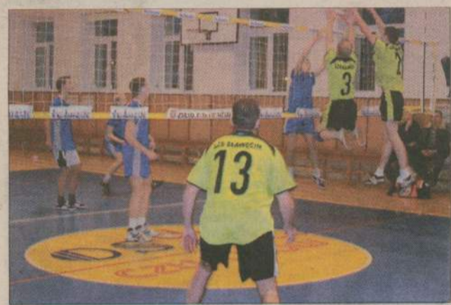
Pojedynek ZSA z drużyną ze Sławęcina był jednym z najbardziej pasjonujących spotkań sobotnich zawodów.

Mimo że siatkarze Prime Food LZS Brda nie grali w sobotę to zespół z Przechlewa nadal prowadzi w tabeli Amatorskiej Ligi Piłki Siatkowej. Przechlewianom wyrósł jednak bardzo mocny przeciwnik - SdN Chojnice. Zawodnicy z sąsiedniego miasta pewnie wygrali w sobotę oba swoje spotkania. Najbardziej zaciętym meczem było jednak spotkanie pomiędzy ZSA Człuchów a LZS Sławęcina. Początkowo wydawało się, że goście dość gładko zwyciężą. Ostatecznie jednak 3:2 wygrali młodzi zawodnicy z Człuchowa.