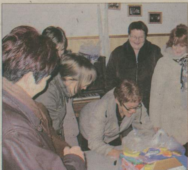
Efektom akcji zbiórki będzie ponad 20 paczek, które trafią do rodzin wielodzietnych, osób starszych i samotnych.

Przechlewo. Przedświąteczne spotkanie w bibliotece