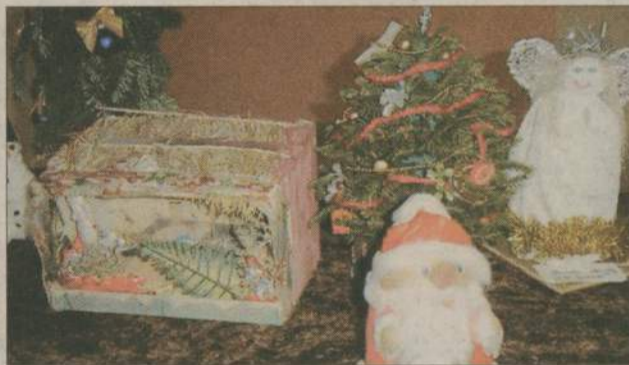
Dziecięce prace mają niepowtarzalny urok...