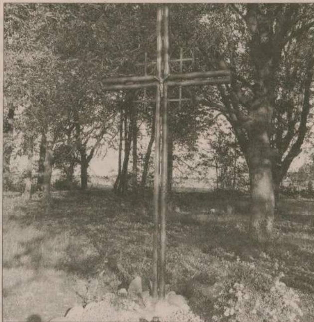
Fundując krzyż mieszkańcy Brzeźna dowiedli, że przebaczyli...

Uroczystość poświęcenia krzyża była więc prawdziwą lekcją historii, ale i współzycia narodów. Skorzystali z niej licznie przybyli mieszkańcy, w tym spora grupa młodzieży.