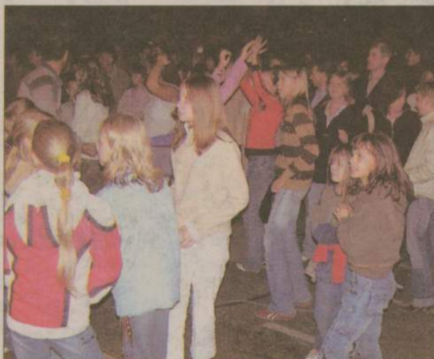
Takiej dyskoteki jeszcze w Koczale nie było.