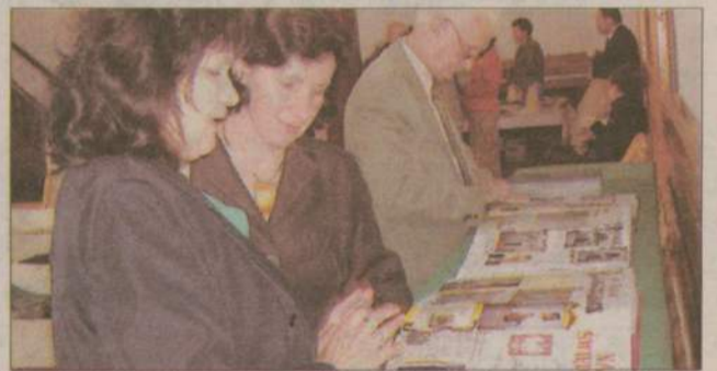
Przerwy między referatami były okazją do obejrzenia kronik Muzeum Regionalnego w Człuchowie.