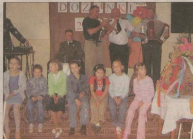
Nie zabrakło zabaw dla dzieci...

ŚLUPIA. Atrakcją dożynek w świetlicy wiejskiej był występ zespołu OSP. Tradycyjnie wystąpiły też Słupianki.