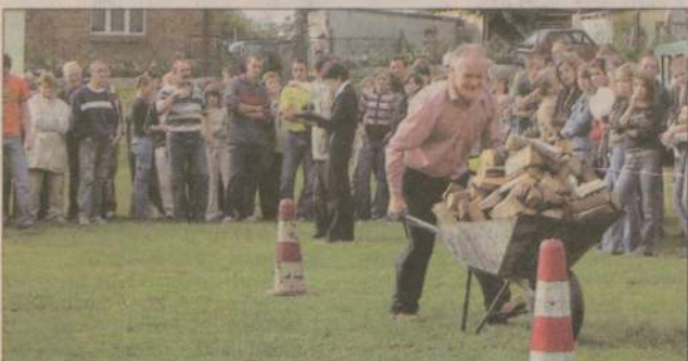
Ślalom z taczka - liczyła się precyzja i zachowanie ładunku w środku.