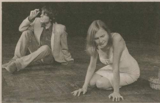
W 67 rocznicę śmierci Stanisława Ignacego Witkiewicza odbędzie się IX Ogólnopolski Konkurs Interpretacji Dzieł Stanisława Ignacego Witkiewicza „Witkacy pod strzechami”.