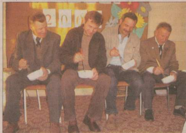
... i dorosłych.