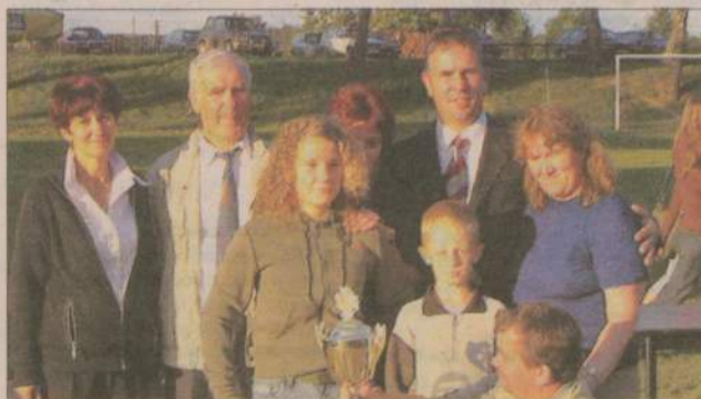
Mieszkańcy Pawłówka wygrali w punktacji drużynowej XVI Turnieju Wsi.