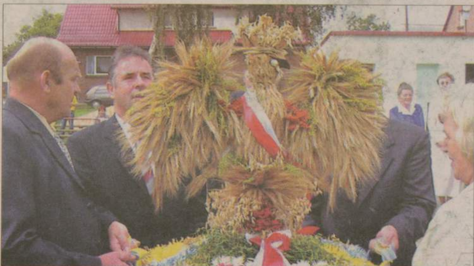
Mieszkańcy Dąbrowy zaskakowali wszystkich wieńcem w kształcie orła.

Pawłówko - 78 pkt Dąbrowa - 75,5 pkt Przechlewo - 68,5 Żolna - 67,5 Nowa Wieś - 65 pkt Pakotulsko - 61 pkt Szczytno - 49 pkt Płaszczycza - 8,5 pkt