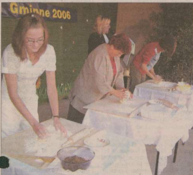
Prawdziwy sprawdzian dla rzeczenniczanki - lepienie pierogów.