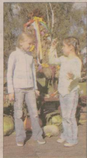
Coś dla siebie znalazły i dzieci.