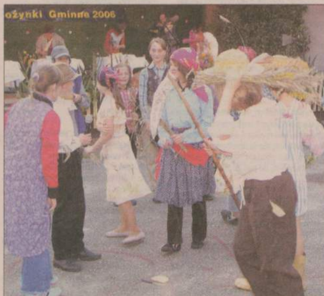
Widzom bardzo podobał się między innymi występ dzieci ze szkoły w Pieniężnicy.