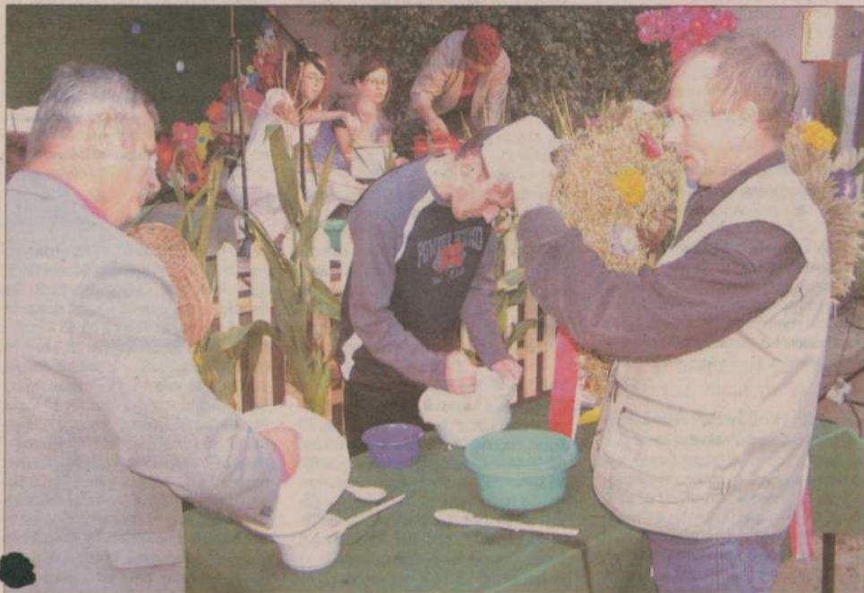
Ale jaja... dobrze się trzymają. Spora w tym zasługa panów, którzy tłukli je trzepaczką.

Lepienie pierogów, ubijanie piany i śmietany... - to tylko niektóre z wyzwań, które postawiono przed uczestnikami święta plonów w gminie Rzeczennica. Rzeczenniczanie zabawę dożynkową rozpoczęli mszą świętą i przemarszem z wieńcem ulicami miejscowości. Później, podczas spotkania w amfiteatrze mogli podziwiać występy dzieci ze wszystkich szkół z terenu gminy oraz przyglądać się (lub osobiście brać w nich udział) konkurencjom ściśle związanym z pracami domowymi. Ci najwytrwalsi uczestnicy dożynek zabawę zakończyli dopiero nad ranem gdy zabrzmiały ostatnie takty muzyki.