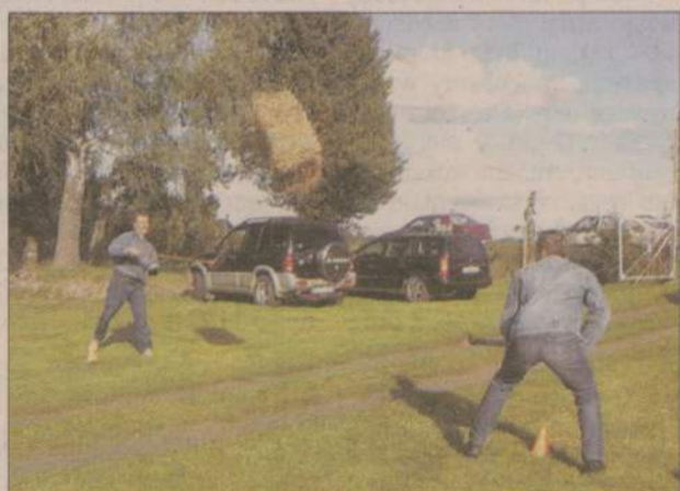
Konkurencja nawlekania koralików, rozpoznawania przypraw, przerzucanie baloników z wodą i... snopków - to tylko niektóre z dożynkowych konkurencji dla dorosłych.

GRZYMISŁAW. 30 podziękowań za całoroczny trud wręczono rolnikom podczas dożynek w sołectwie Grzymisław. Kulinarną atrakcją imprezy był dorodny prosiak przekazany przez starostę dożynek.