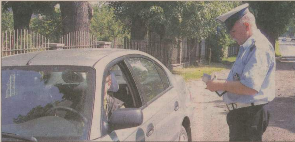
Przy nieaktualnych tablicach kontrole, w trakcie których mierzona jest prędkość mogły być mocno dyskusyjne...