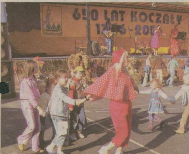
Przed południem świetnie bawiły się dzieci.