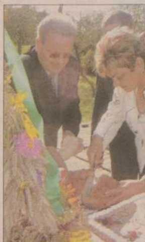
Tradycyjnie wójt gminy podzielił bochen chleba. Nie zabrakło jednak i ciasta...