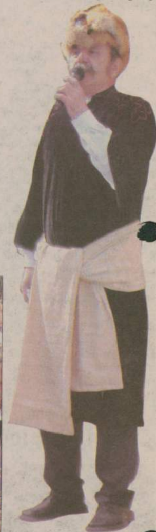
Na scenie zaprezentowali się wykonawcy z Głędowa. Recytowali fragmenty „Pana Tadeusza” odnoszące się do żniw.

Krzysztof Lichucki k.lichucki@prasa.gda.pl