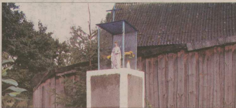
Kapliczka na skrzyżowaniu, tuż za mostem.