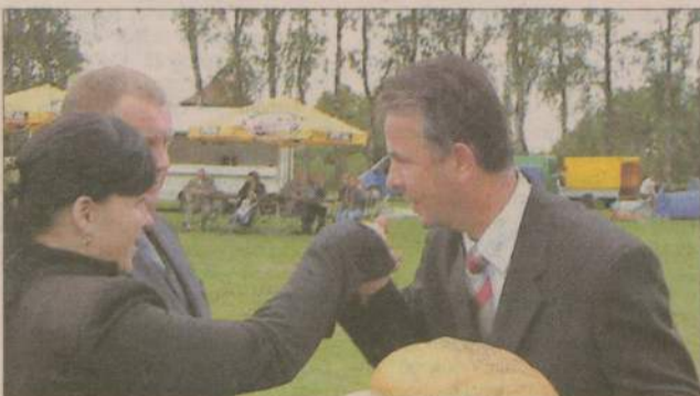
W dzień dożynek przed starościną nawet wójt kark zgiął...