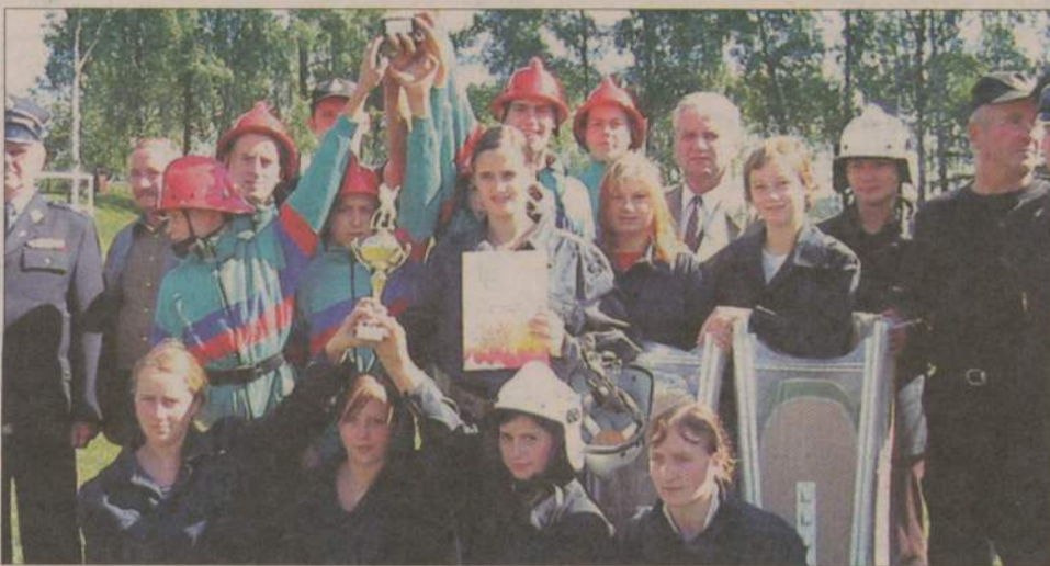
Wspólne zdjęcie drużyny z Bińcza.

Młodziowe drużyny pożarnicze z Mosiny i Bińcza okazały się najlepsze w Powiatowych Zawodach Pożarniczych Ochotniczych Straży Pożarnych. Na obiektach sportowych przechlewo OSiR-u w strażackich potyczkach wystartowały drużyny dziewcząt i chłopców do lat 15 oraz cztery ekipy kobiet. Łącznie przez płytę boiska przewinęło się ponad 200 strażaków z 5 miejscowości. Przeważały panie. W zawodach zabrakło gospodarzy, choć w czasie wakacji mocno trenowali na międzynarodowym obozie strażackim w Człuchowie. Najwięcej kłopotu młodym adeptom pożarnictwa sprawiały ćwiczenia bojowe. Ich przebieg obserwował m.in. Aleksander Gappa, starosta człuchowski i prezes Zarządu Powiatowego Ochotniczych Straży Pożarnych, dowództwo komendy PSP w Człuchowie oraz