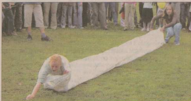
Młodszy zawodnicy mogli... przeczłapać się tunelem.