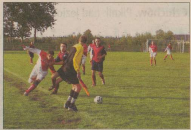
To był mecz walki. Nie tylko piłkarzy z piłkarzami, ale również zawodników Piasta z sędzią.

Z niewesołymi minami opuszczali boisko również piłkarze MKS Debrzno. Z czego bowiem się cieszyć, gdy w 23 minucie meczu