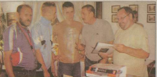
Na zdjęciu: nagrody odbiera drużyna Klan Ł.