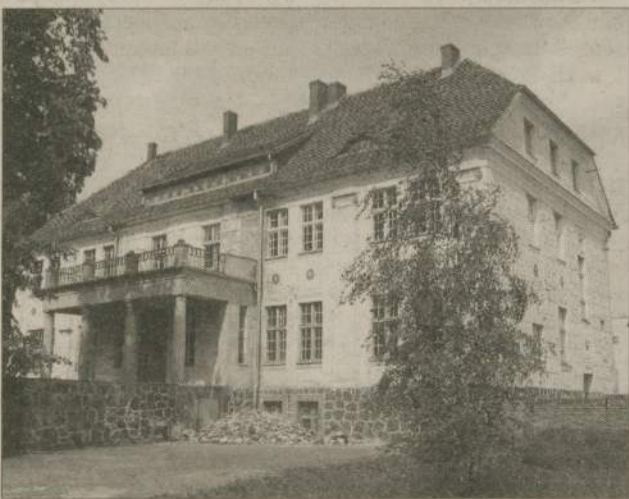
Trwa remont pałacu - najcenniejszego zabytku Dąbrowy.

(Dąmbrowa, 1140) stara wieś szlachecka należy do pierwszych wzmiankowanych na Ziemi Człuchowskiej. W historii Długosza jest wzmianka, że starosta człuchowski z okresu wojny trzynastoletniej, Jerzy z Dąbrowy pochodził właśnie stąd.