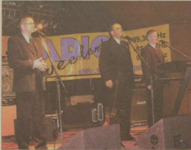
Tego kabaretu żadnemu z człuchowian nie trzeba było bliżej przedstawiać. Nic więc dziwnego, że występ OTTO cieszył się ogromnym powodzeniem.