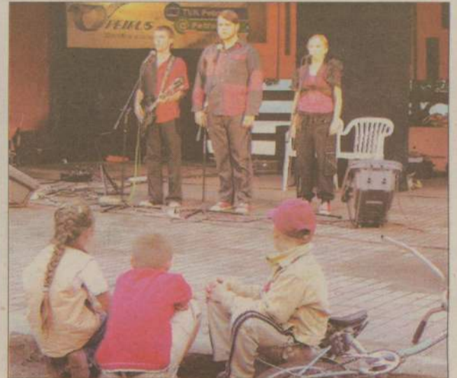
Kabaret Cegła nie miał zbyt dużej publiki.