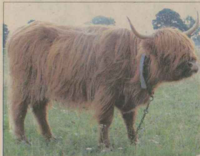
Reks ma być jedną z atrakcji dla „miastowych”.