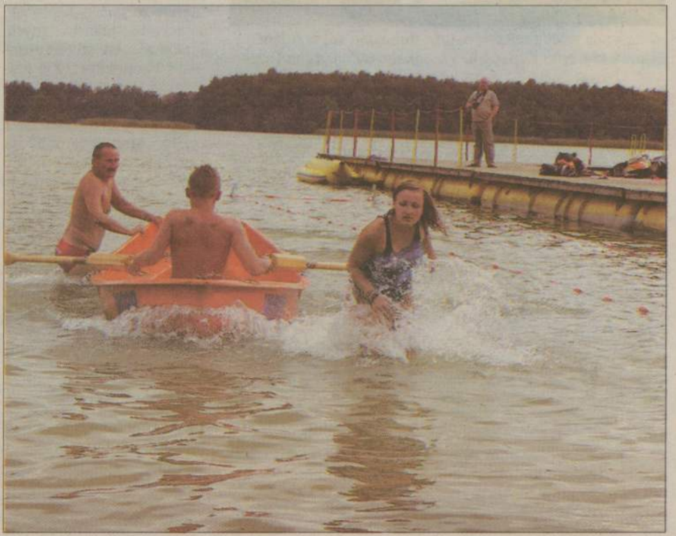
Ratownik czy ratowniczką - nieważna płeć - ważne, żeby dać z siebie wszystko.