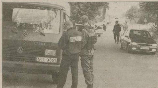
Razem - ale oddzielnie. Każda ze służb sprawdzała co innego...

Powiat człuchowski. Wspólna akcja Mundurowi silni razem