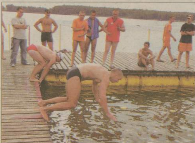
Pierwszą z konkurencji było pływanie z przeszkodami.