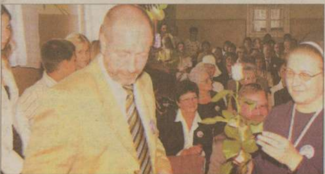
W zjeździe uczestniczyło ponad 250 absolwentów.