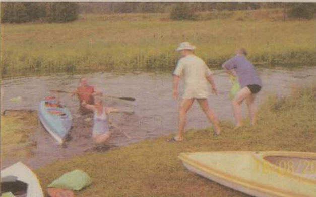
Mimo wielu miłych i mniej miłych atrakcji humory dopisywały.