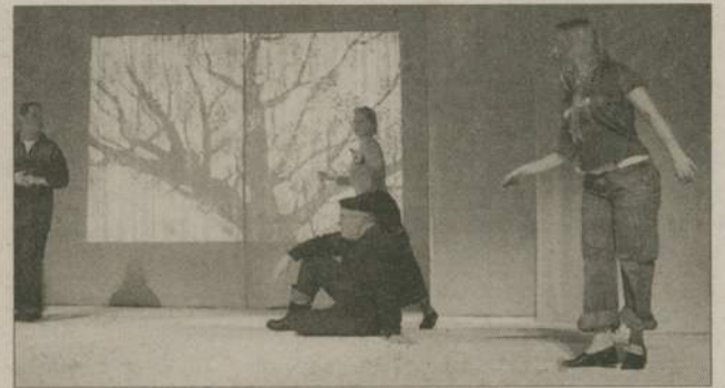
„Ferdynand” to propozycja Nowego Teatru na początek trzeciego sezonu artystycznego.