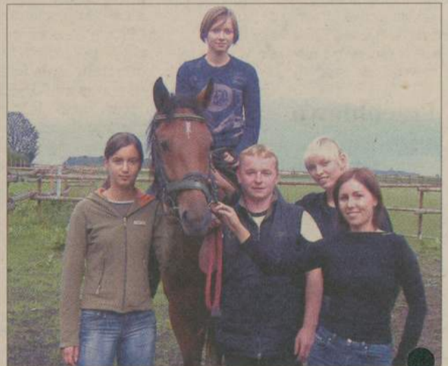
Klub Jeździecki „Galop” skupia miłośników koni. Nie jest wymagane posiadanie własnego wierzchowca.

Krzysztof Lichucki k.lichucki@prasa.gda.pl