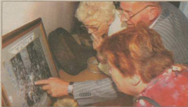
Wzruszająca była wystawa archiwalnych zdjęć.