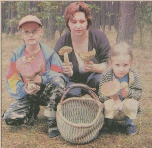
Takie okazy nie zdarzają się co dzień.