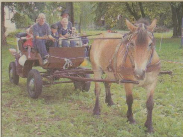
Dochód z przejażdżek bryczką zostanie przekazany na komitet rodzicielski.

Przejażdżki bryczką i wierzchem, recytowanie wierszy, konkurencje dla dzieci i rodziców oraz dużo muzyki - to wszystko w ramach „Pożegnania wakacji”, które w minioną sobotę zorganizowano w Starym Gronowie.