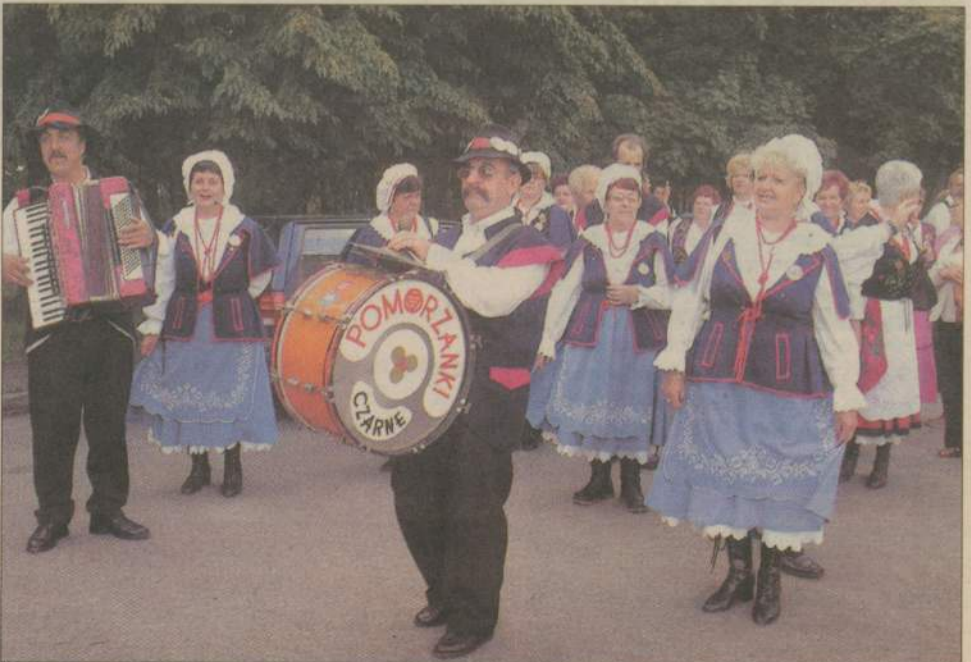
Ulicami Czarnego przeszedł barwny tłum uczestników Festiwalu Kultury Ludowej. Nie zabrakło w nim Pomorzank.