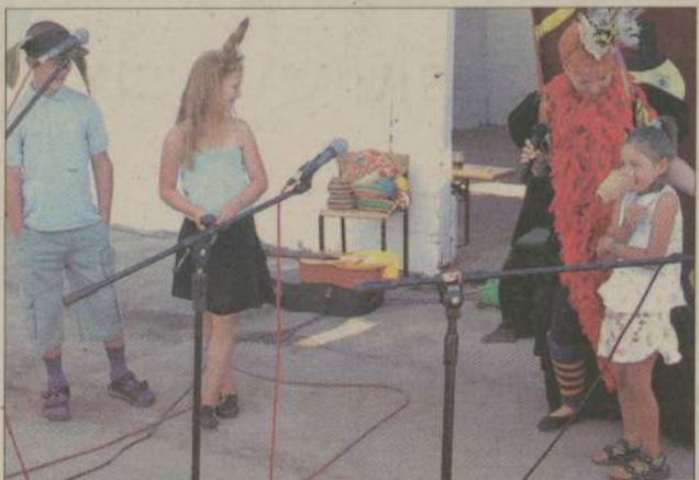
Maluchom z Boboszewa przypadł do gustu teatrzyk z Bydgoszczy, który prezentował m.in. wiersze Jana Brzechwy.