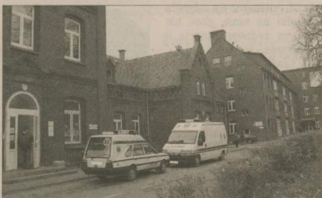
Jest szansa na nową karetkę pogotowia. Na razie człuchowianie muszą liczyć na dwa, lecz już ambulanse.