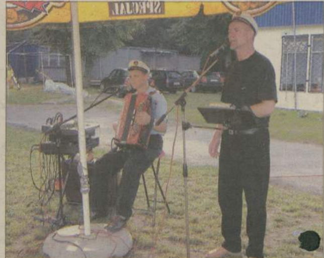
O atmosferę żeglarską zadbał zespół Kubryk z Ustki.