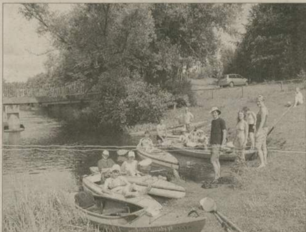
Kajakarze z „Beczki” są pod wrażeniem szlaku Brdy.