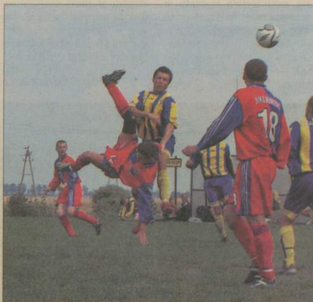
Zawodnicy Korala (żółto-niebieskie stroje) nie pozwolili MKS-owi na wywiezienie z Dębicy nawet jednego punktu.

Drugą część spotkania mocnym uderzeniem rozpoczęli gospodarze. Debrznianie mieli bardzo dużo szczęścia, że strzał jednego z zawodników Korala trafił w poprzeczkę. Tempo gry w tej części spotkania znacznie osłabło. Piłkarze MKS bardzo rzadko zapuszczali się