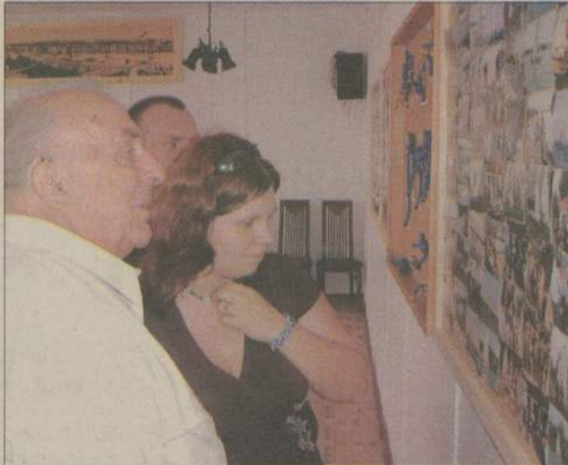
Jak zmienił się Yacht Klub przez 10 lat można było zobaczyć na specjalnie przygotowanej galerii.

Kwiaty, prezenty i życzenia - tego wszystkiego nie brakowało podczas urodzin Yacht Klubu. Klubowi stuknęło... 10 lat. Wszystko zaczęło się w 1996 roku, gdy grupa miłośników żeglarstwa powołała do życia organizację, jakiej w mieście nie było.