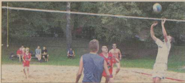
Podczas piątego turnieju zagrało 11 drużyn. Na zdjęciu: mecz Samwo (w czerwonych strojach) - Klan Ł.