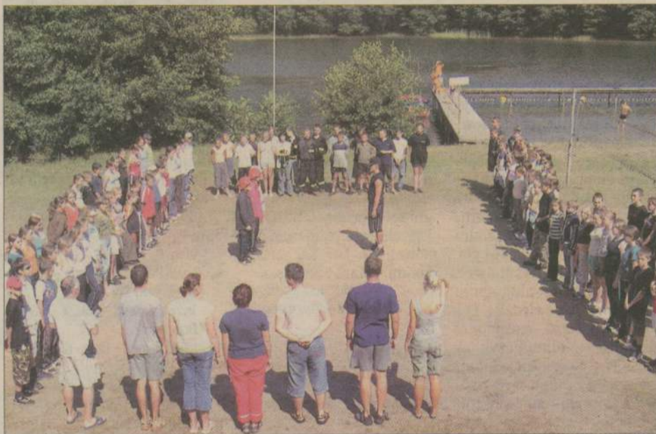
Codziennie rano wszyscy uczestnicy obozu spotykali się na apelu.