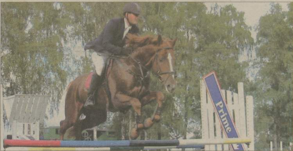
W zawodach wystartowało 47 koni z 17 klubów jeździeckich.