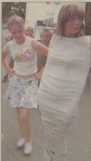
Jak zwykle w trakcie robienia mumii emocji nie zabrakło.