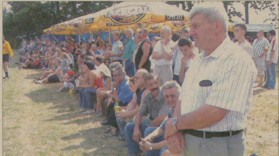
Tegoroczny festyn pobił rekordy frekwencji.