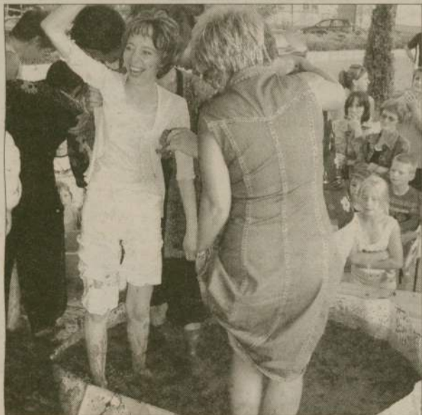
Atrakcją debrzneńskiej imprezy jest... udeptywanie porzeczek.