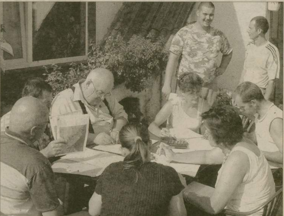
Członkowie komisji przyjmują wnioski gospodarzy z Czarnoszyc.

Mirosław Szalata db.czuchow@prasa.gda.pl