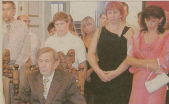
Fot. Krzysztof Lichucki