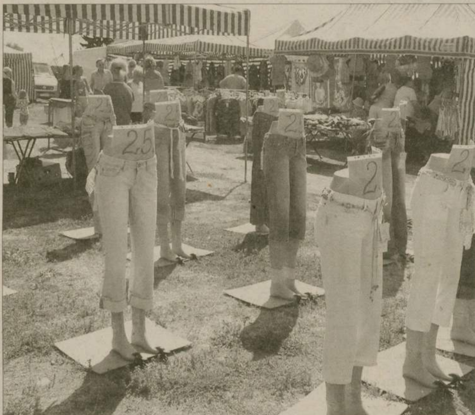
Takiej figury manekinom z debrzneńskiego targowiska mogłaby pozazdrościć niejedna kobieta. Te, które nie mają kompleksów mogą w każdą środę przyjść, przymierzyć i kupić. W końcu 25 złotych nie wydaje się być wygórowaną ceną. Za to jaki efekt...