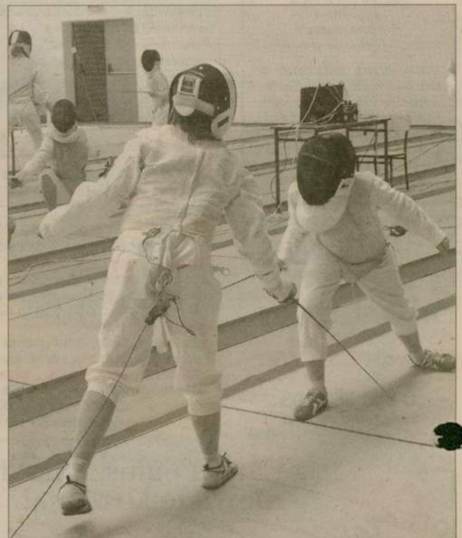
W nowej hali sportowej są świetne warunki do trenowania szermierki.

- Dla nas to bardzo budujące, że tylu jest chętnych na przyjazdy do bursy,