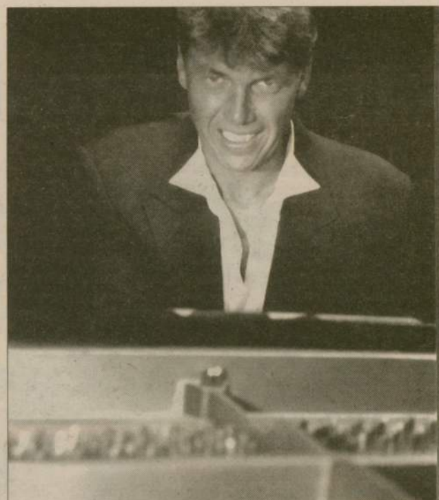
Jo Bohnsack jest jednym z najbardziej znanych niemieckich pianistów boogie-woogie.

Bilety w przedsprzedaży kosztują 15 zł, a w dniu koncertu - 18 zł. Można je kupić w Miejskim Domu Kultury w Człuchowie, ul. Traugutta 2, tel. (059) 83-411-32. 12 sierpień (sobota) - godz. 20 odbędzie się koncert galowy na dziedzińcu zamkowym (w razie niepogody w sali zamkowej) - wstęp płatny. 13 sierpień (niedziela) - godz. 16 - piknik boogie na dziedzińcu zamkowym - wstęp wolny.