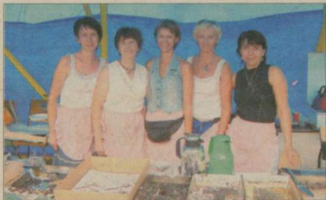
Panie z Koła Gospodyń Wiejskich w Głędowie serwowały wykonane przez siebie smakołyki. Uzyskane w ten sposób fundusze przeznaczą na działalność koła.

Mecz piłki nożnej między reprezentacją I ligi kobiet SP Victoria Sianów z oldbojami Znicz Głędowo, loteria fantowa, zabawa taneczna to nieliczne z atrakcji przygotowane na Festyn Święta Młodości.