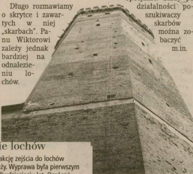
szukiwaczy skarbow można zobaczyć m.in.

Długo rozmawiamy o skrytce i zawartych w niej „skarbach”. Panu Wiktorowi zależy jednak bardziej na odnalezieniu lochów.