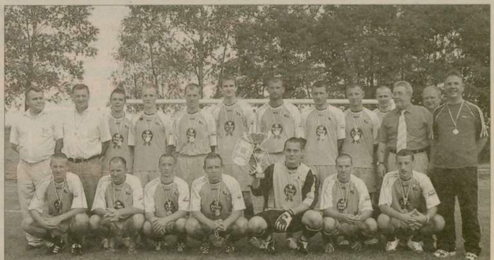
Dla przechlewickiej drużyny awans do IV ligi to historyczne wydarzenie.