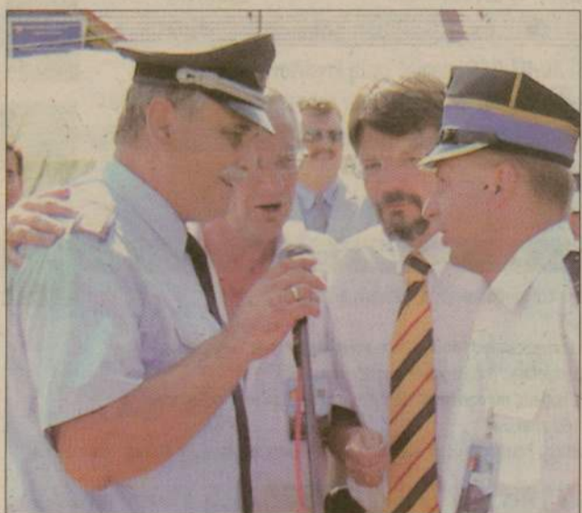
Zgrupowanie uważamy za rozpoczęte - tak starostwie i komendanci straży z Norheim i Człuchowa oficjalnie rozpoczęli obóz.

Tak duży międzynarodowy biwak zorganizowano w Człuchowie po raz pierwszy. Było to możliwe dzięki dofinansowaniu z Fundacji Polsko-Niemiecka Wymiana Młodzieży.