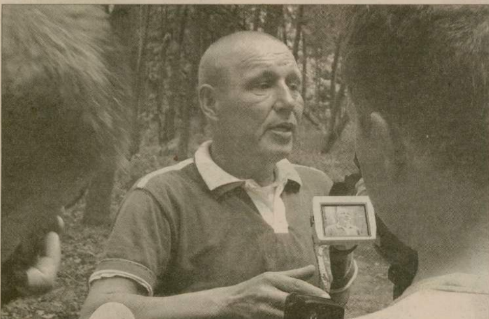
Nietypowa akcja zwróciła uwagę nie tylko lokalnych, ale również ogólnopolskich mediów.

Czekamy na kolejne wypowiedzi na naszym serwisie internetowym www.czuchow.naszemiasto.pl