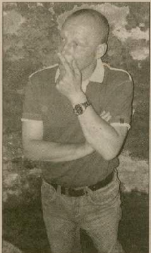
Swoją wizję jasnowidz rozpoczął w lochach zamkowych.

O istnieniu drugich lochów zamkowych świadczy fragment książki „Z minionych dni Człuchowa” Pawła Błażejewskiego (później Paula Blanki). Z jego relacji wynika, że na początku dwudziestego wieku na podzamczu wschodnim, koło tzw. bramy Luizy stało kilka bu-