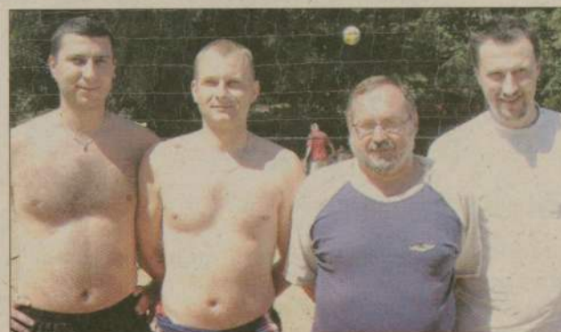
Drugi turniej plażowej piłki siatkowej wygrały... Stokrotki.