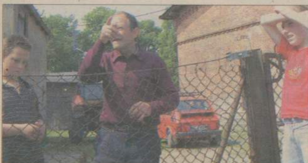
Mieszkańcy nie chcą oficjalnie wypowiadać się na temat zdarzenia. Ale wieś aż huczy...

Domisławianin może odpowiadać za „czyn nieobyčajny”. Gdyby potwierdziło się, że ktoś namawiał go do spacerów w stroju Adama, również taka osoba może stanąć przed sądem grodzkim. (pif)