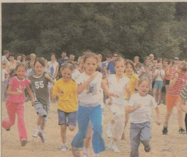
Na zdjęciu: w biegu ulicznym startują dziewczynki z klas I szkoły podstawowej