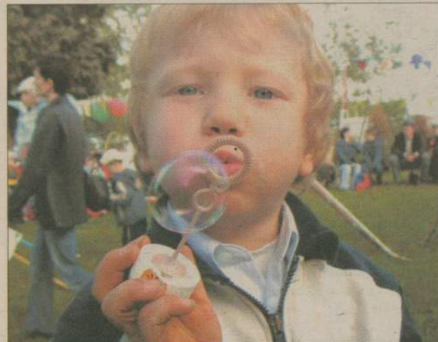
Robienie baniek mydlanych to dla czterolatka duża frajda.