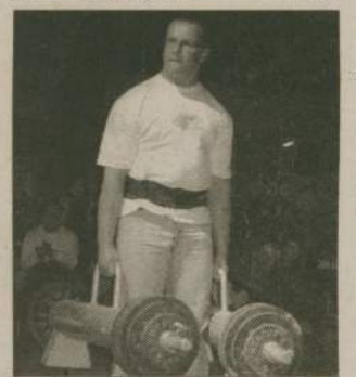
Jedną z konkurencji będzie spacer z walizkami.

Spacer z walizkami, wyciskanie belki, toczenie opony, waga płaczu, przeciąganie samochodu, spacer z lekturką... i wiele innych konkurencji czeka na siłaczy z Człuchowa w najbliższą niedzielę. Zawody Strong Man organizuje Fitness Club Champion z Człuchowa. Impreza rozpocznie się o godzinie 10 na parkingu koło banku PeKaO przy ul. Dworcowej. Zapisy uczestników trwać będą do ostatniej chwili. Organizatorzy zapewniają, że jest o co powalczyć. Oprócz satysfakcji wszyscy zawodnicy otrzymają upominki, zdobywcy trzech pierwszych miejsc - puchary i cenne nagrody. (stef)