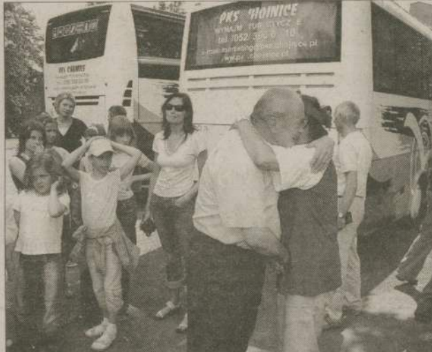
Człuchowianie, którzy przyjechali do Uszar pierwszy raz byli nieco zdziwieni takim przywitaniem. Ci, którzy byli po raz kolejny - po prostu witali się z przyjaciółmi.