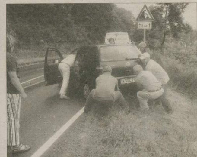
Polacy mają wiele wad, ale i zalet. Kiedy radni zobaczyli auto, które „wyrzuciło” na pobocze natychmiast rzucili się na pomoc. Dwie panie i dwójka małych dzieci znajdujących się w aucie były najpierw mocno przestraszone - potem gorąco dziękowały.