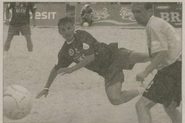
24 drużyny będą rywalizowały na plaży.