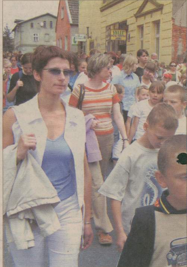
Tradycyjnie już uczestnicy Dni Młodości przeszli ulicami miasta prowadzeni przez orkiestrę.