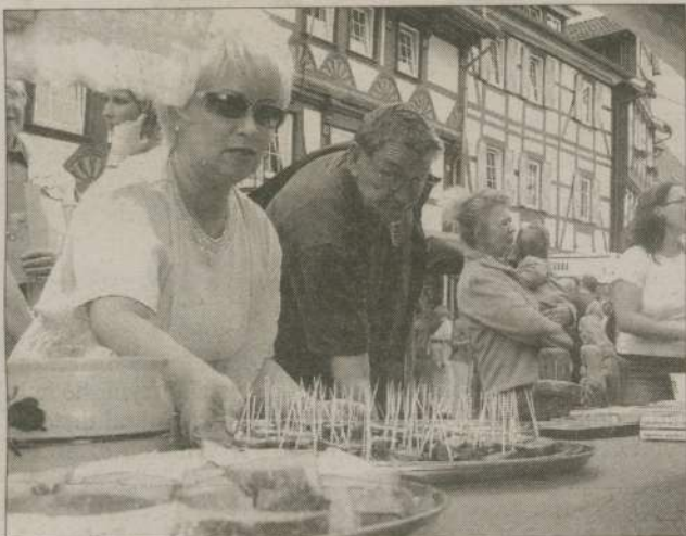
Takiego powodzenia materiałów promocyjnych o Człuchowie nikt się nie spodziewał - płyty z polsko-niemieckim filmem o naszym mieście rozeszły się błyskawicznie. Podobnie jak przywieziona z Polski kiełbasa.