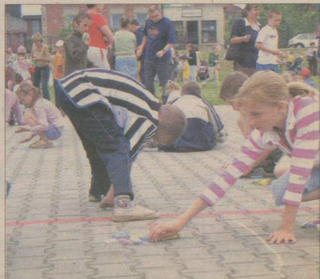
W konkursie rysunkowym dla dzieci nie było przegranych - drobne upominki otrzymali wszyscy uczestnicy.