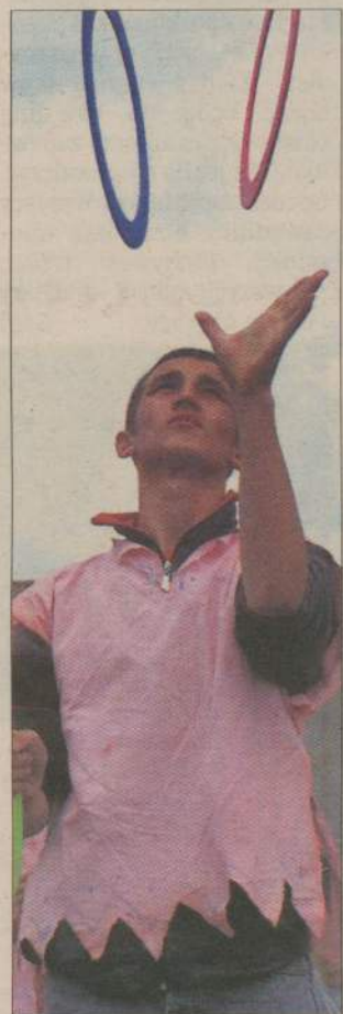
Bardzo efektownie zaprezentowali się żonglerze, którzy nad Debrzynkę przyjechali z Malechowa.