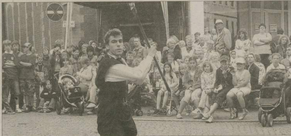
Występy dzieci z Klubu Małego Artysty, tancerek z Miejskiego Domu Kultury i rycerzy powitała i pożegnała prawdziwa burza oklasków. Finałową piosenkę śpiewali nawet ci, którzy nie znali polskiego.

Rozmów ze sobą z pewnością nie brakowało podczas Dni Człuchowa w Uszar zorganizowanych z okazji tysiąclecia tego miasta. Nawet kiedy zawodziły umiejętności językowe. Do Niemiec pojechały w sumie 74 osoby - samorządowcy, dzieci z Klubu Małego Artysty, tancerki z zespołów tanecznych przy MDK i członkowie bractwa