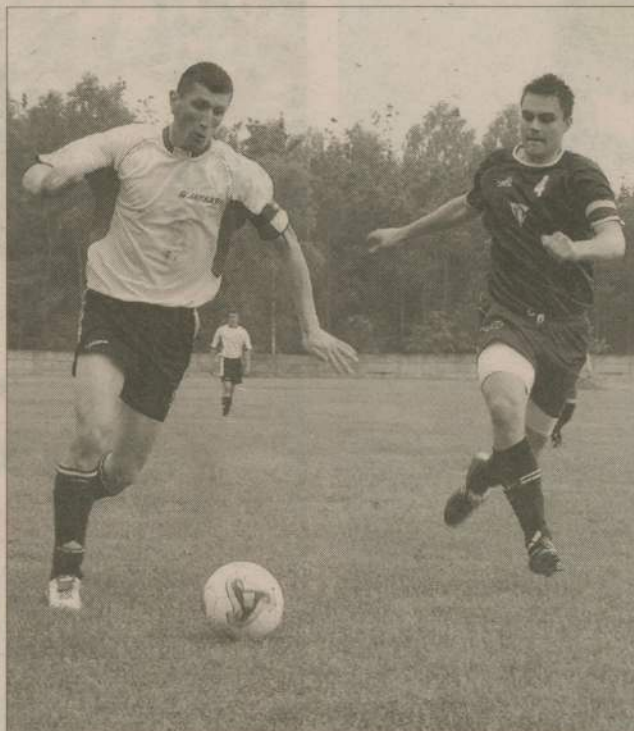
Zawodnicy z Czarnego (w jasnych koszulkach) przegrali pierwszy mecz barażowy z tczewianami.