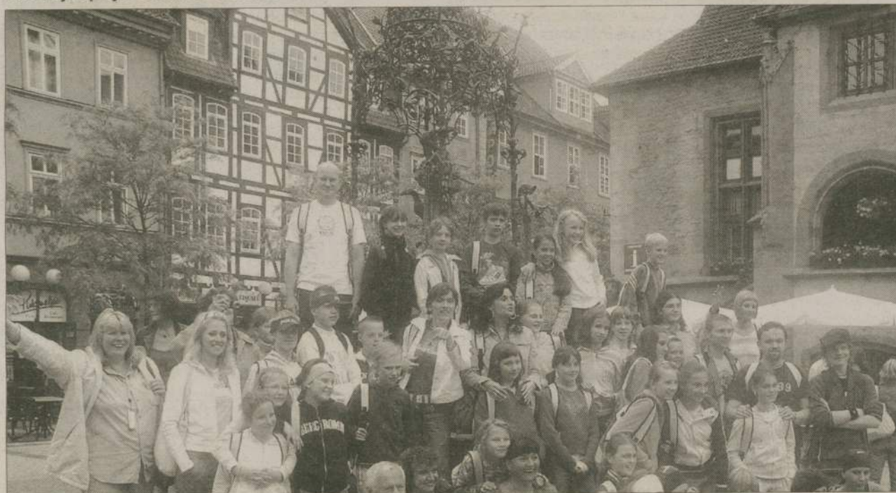
Göttingen - miasteczko uniwersyteckie kilkadziesiąt kilometrów od Uszar posłużyło jako oprawa do pamiątkowego zdjęcia.