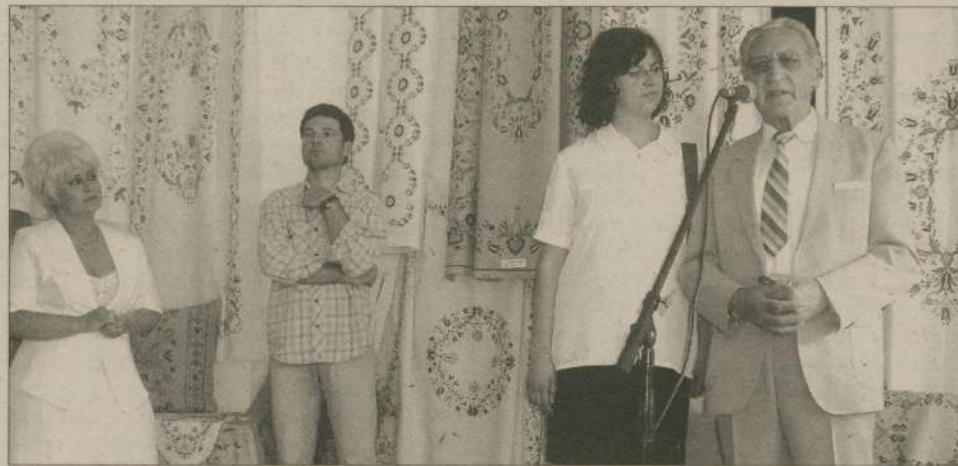
Wystawę haftu kaszubskiego wcześniej mogli oglądać mieszkańcy Konstancji (Niemcy), teraz prace hafciarek podziwiać mogą człuchowianie.