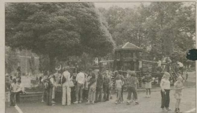
Młodzież, wspólnie z uczniami niemieckiej szkoły uczestniczyła w lekcjach biologii, geografii i angielskiego w gimnazjum. Dzieci - w lekcjach śpiewu, niemieckiego i matematyki w Szkole Podstawowej. Na zdjęciu - już po dzwonku na boisku podstawówki.