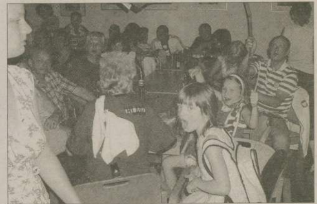
W meczu piłki nożnej Polska-Niemcy zdecydowana większość kibiców dopingowała polską drużynę. Zwłaszcza, że oglądali go w salce... polskiej parafii katolickiej, prowadzonej przez polskiego księdza.