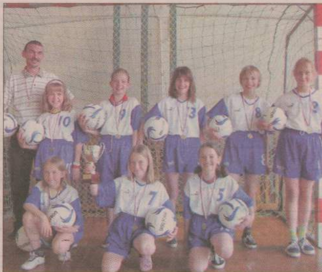
Przechlewskie piłkarki znalazły się w ścisłej czołówce finału turnieju im. Marka Wielgusa.