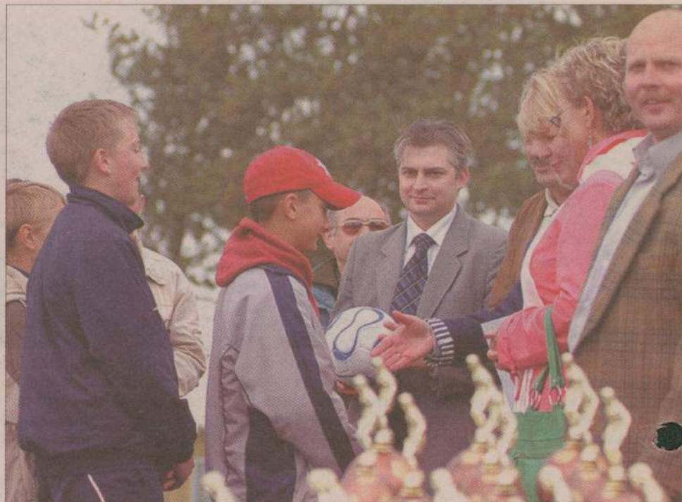
Nagrody dla młodych piłkarzy wręczono w przerwie niedzielnego meczu na stadionie OSiR Człuchów.