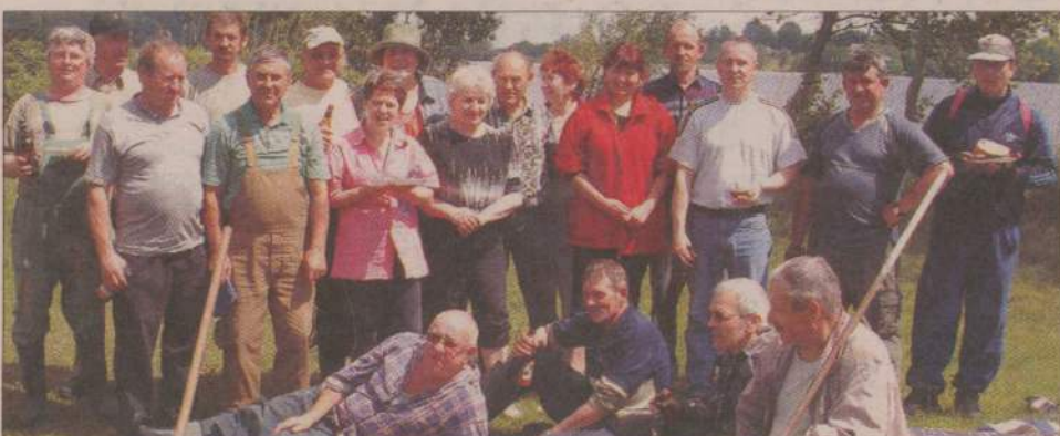
Uczestnicy sobotniego czynu społecznego posprzątały teren nad Jeziorem Urzędowym, a później zorganizowali piknik.