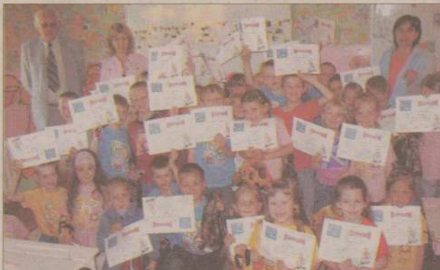
Dzieci z przedszkoli człuchowskiej gminy wiejskiej (na zdjęciu dzieci z Wierzchowa) odebrały nagrody za udział w III edycji konkursu plastycznego „Świat w Oczach Dziecka”.