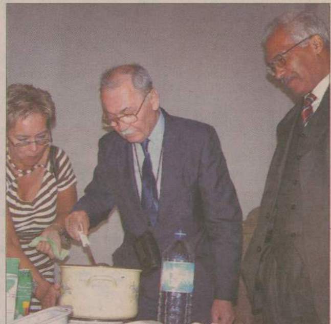
Ślodyczy prosto z Egiptu i prawdziwej kawy „po arabsku” mogli skosztować goście „Dnia z Egiptem”.