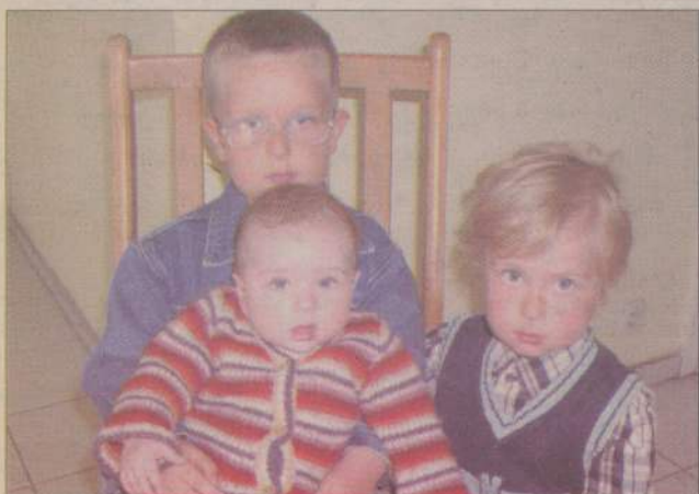
Uśmiechu na twarzy, słonecznych promyków w pochmurne dni lata, zimy, wiosny i jesieni, to o czym marzysz by twoje było, a czego pragniesz by się spełniło...