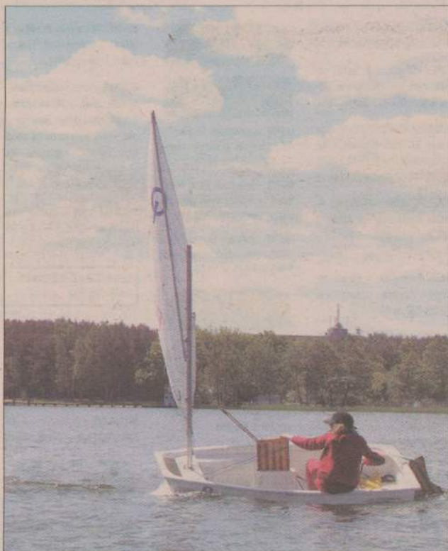
Na jeziorze Rychnowskim zaroilo się od białych żagli.