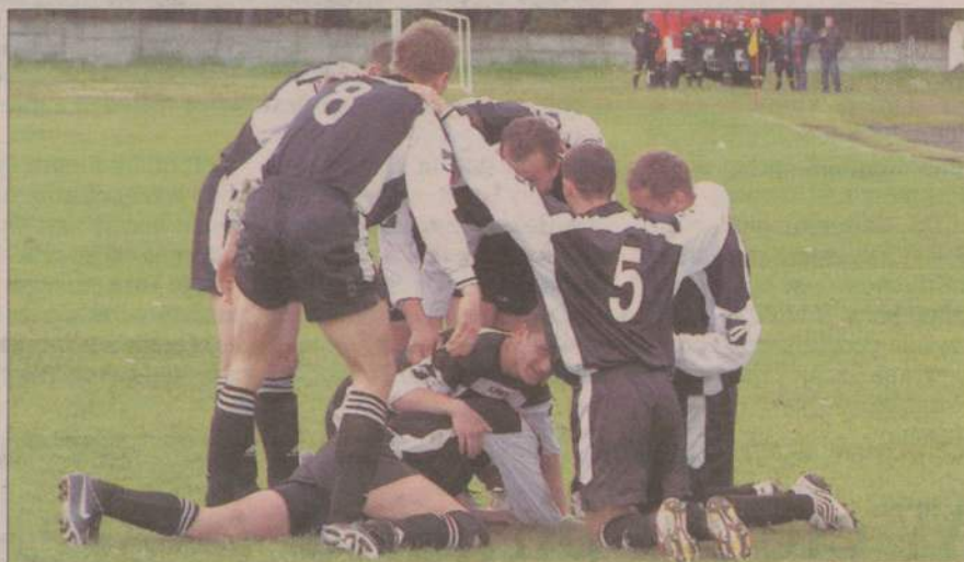
Tak piłkarze Czarnych cieszyli się po zdobyciu trzeciej bramki w meczu z Pogonią Lębork.