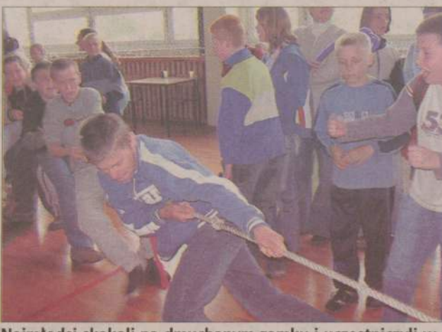
Najmłodszy skakali na dmuchanym zamku i uczestniczyli w zabawach przygotowanych przez wychowawców. Starszym uczniom najbardziej spodobało się przeciąganie liny, tym bardziej, że po potyczkach klasowych naprzeciw siebie stanęli uczniowie i nauczyciele.