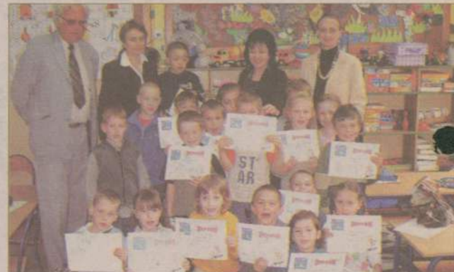
Nagród było sporo - do Urzędu Gminy wpłynęło 125 prac wykonanych różnorodną techniką (na zdjęciu dzieci z „zerówki” w Polnicy). Dzieła „małych artystów” można podziwiać w budynku Urzędu gminy Człuchów.