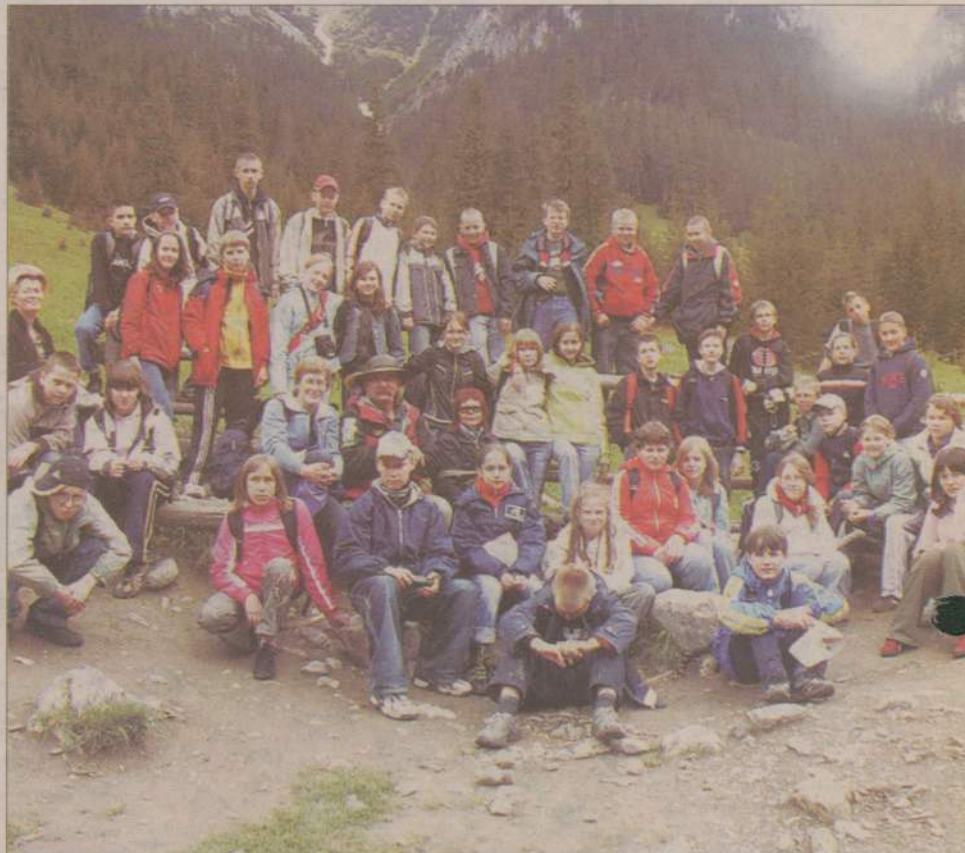
Pamiątkowe zdjęcie w Dolinie Kościeliskiej.