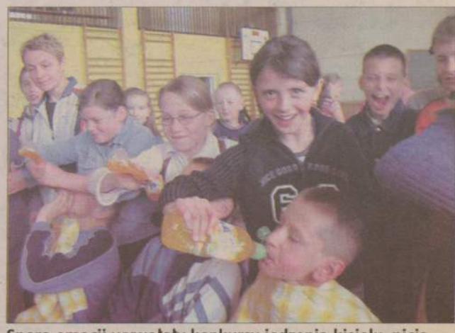
Sporo emocji wywołały konkursy jedzenia kisielu, picia przez smoczek czy pompowania baloników. W przerwach dzieci mogły skorzystać z napojów i ciasta przygotowanego przez rodziców, a na koniec zabawy wszyscy otrzymali paczki ze słodkościami.