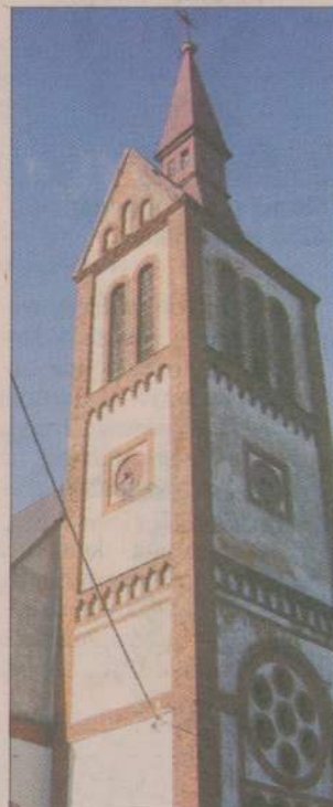
Kościół w Starym Gronowie powstał w XIX wieku. Jego wieża wymaga teraz kapitalnego remontu.

chy kryjącej dach na miedzianą, wymianę okien, położenie tynków i fugowanie cegły - potrzeba jeszcze około 20 tysięcy złotych. - Niestety, fundusze parafii nie pozwalają na to, by sfinansować tę inwestycję - powiedział ksiądz Dariusz Gojko, proboszcz parafii w Debrznie, do której należy kościół w Starym Gronowie. - Możemy jedynie dolożyć w formie pożyczki z parafialnego funduszu remontowego tysiąc złotych miesięcznie do momentu rozpoczęcia prac, czyli tyle, ile zbieramy od parafian na naprawę wszystkich kościołów w parafii. Jak łatwo obliczyć, nawet pożyczka z parafialnego funduszu remontowego nie wystarczy, by uzbierać brakującą kwotę. - Prosimy ludzi, którym nie jest obojętny los naszego kościoła, o wyrozumiałość i dalszą ofiarność - zaapelował Piotr Tłock. Bożena Szczygieł