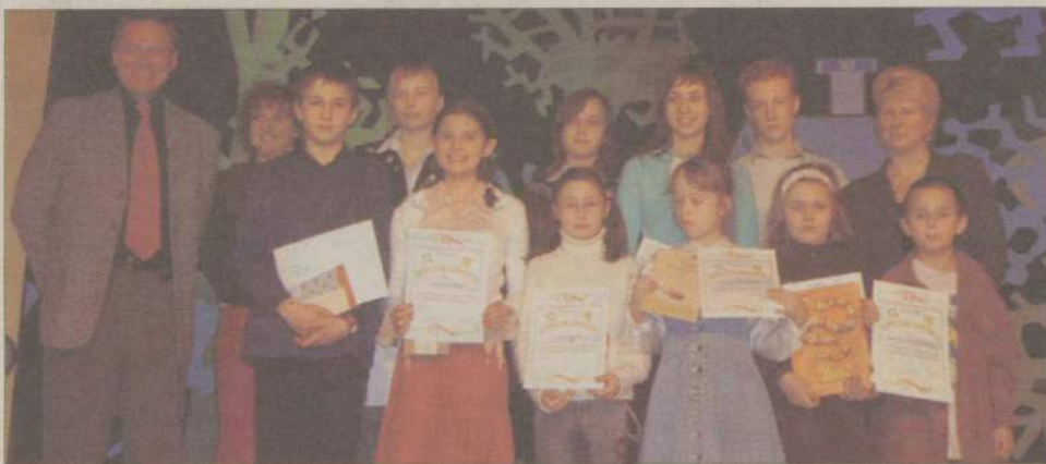
Wszyscy wyróżnieni wykonawcy zostali wytypowani na eliminacje rejonowe.