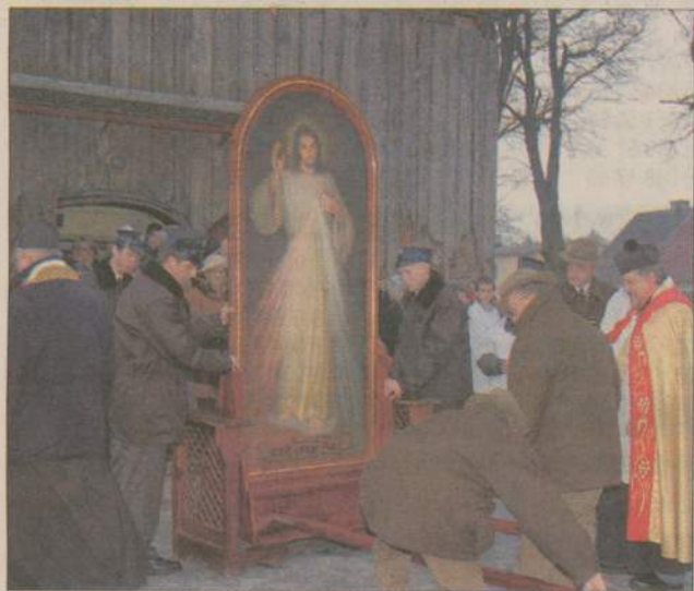
Przez tydzień mieszkańcy Czarnego adorowali Obraz Jezusa Miłosiernego. Był to również czas rekolekcji wielkopostnych dla mieszkańców miasteczka.