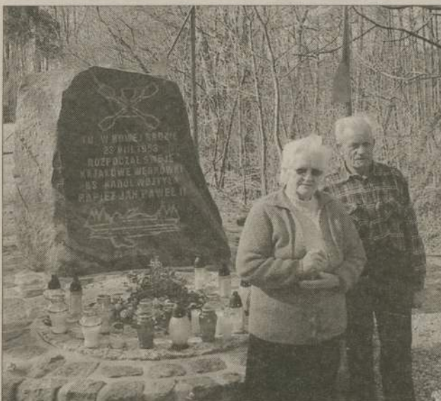
Mieszkańcy Nowej Brdy po śmierci Ojca Świętego spotkali się przy obelisku znajdującym się w miejscu skąd Karol Wojtyła wyruszał na swój pierwszy spływ kajakowy.