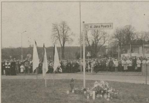
Dokładnie przed rokiem człuchowska obwodnica otrzymała imię Jana Pawła II.

W niedzielę minie dokładnie rok od śmierci Jana Pawła II. Podobnie jak w całej Polsce również w rejonie człuchowskim ten dzień będzie miał szczególny wymiar. W niektórych miejscowościach uroczystości związane z rocznicą rozpoczną się już kilka dni wcześniej.