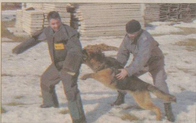
Jedna z pierwszych lekcji „instynktu obronnego”. Bronić musi się jednak nie pies ale pozorant.

Zza budynku na placu gdzie szkolone są psy patrolowe wybiega człowiek w grubym skafandrze i rękawicach. Prowokuje pieski, które rwą się do ataku. To jeden z etapów nauki „formy czynnej instynktu obronnego” czyli agresji. Psy, które są aktualnie szkolone dopiero zaczynają lekcje, trzeba więc w szczególny sposób zwracać uwagę na ich zachowanie. Na tym etapie patrolowców uczy się również przeszukiwania pojazdów, pomieszczeń, nie przyjmowania pokarmów