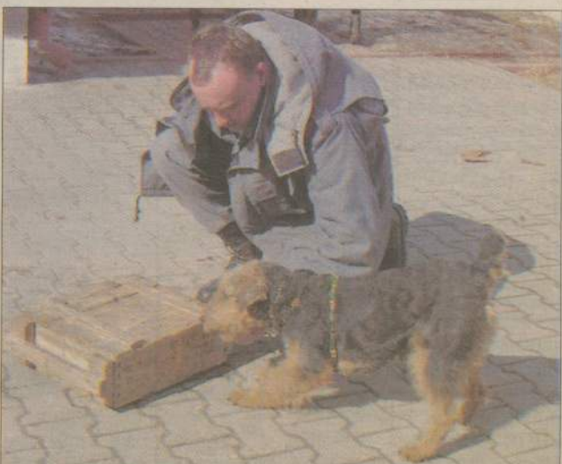
Taki mały, ale jakiego ma nosa do narkotyków...

- Bardzo pozytywnie oceniam pracę piesków w naszym zakładzie. Te wartownicze stanowią dodatkowy element zabezpieczenia zakładu, coraz większą rolę odgrywają jednak psy specjalne wyszkolone w wykrywaniu narkotyków. O ile rola tych pierwszych być może zostanie ograniczona i w dużej mierze zastąpi je elektronika to robotę piesków specjalnych trudno przecenić. Nie tak dawno mieliśmy przypadek, gdy ktoś usiłował wnieść na teren zakładu narkotyki w paście do zębów. Była ona oryginalnie zapakowana, co więcej w tubce znajdował się dodatkowo specjalny pojemnik, w którym były ukryte środki odurzające.