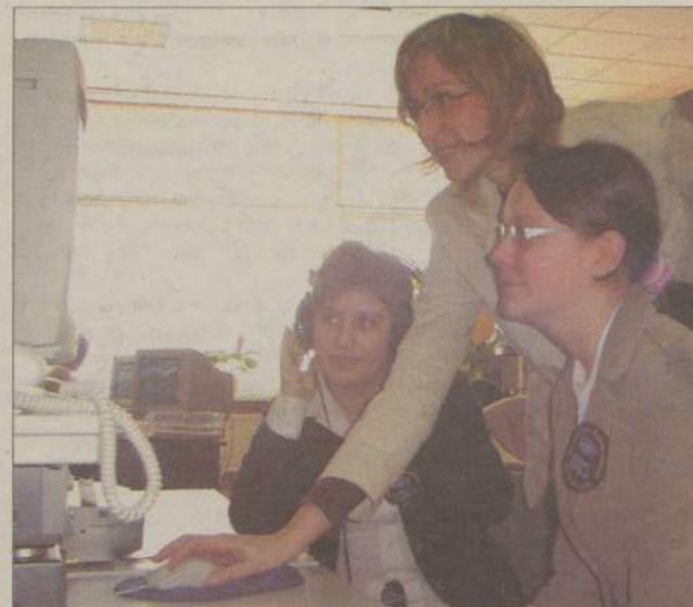
Dwie uczennice Zespołu Szkół Społecznych spędziły „Dzień Przedsiębiorczości” w Radio Weekend.