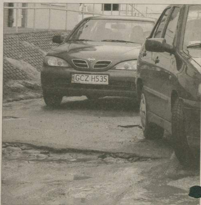
Dziura nad dziurami czyhała na ul. Krzyżowej. Czy jeszcze tam jest? - Warto sprawdzić.

Czy burmistrz dotrzymał słowa? Tych, którzy chcą to sprawdzić zapraszamy na drogę... albo lepiej ulicę Krzyżową. (pif)