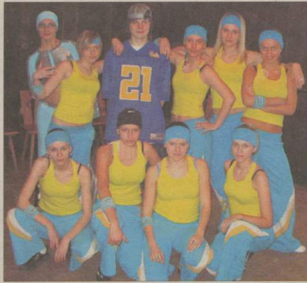
Zespół ReFlex tańczy głównie hip-hop. W Brusach zaprezentował się poza konkursem.