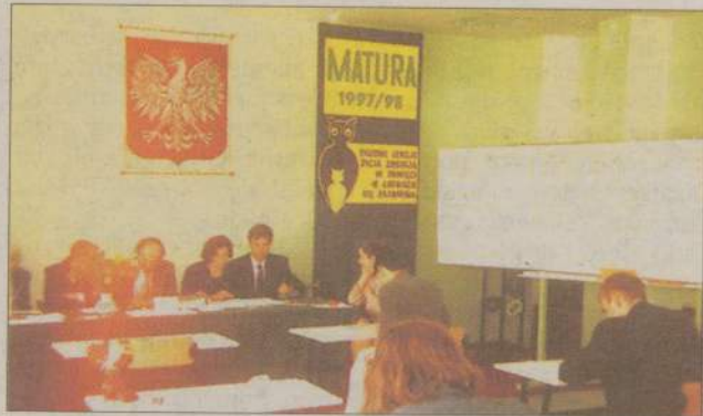
Dekadę temu, podobnie jak teraz, najbardziej stresującym egzaminem była matura.

Największa szkoła zawodowa w powiecie - Zespół Szkół Technicznych w Człuchowie ma 45 lat.