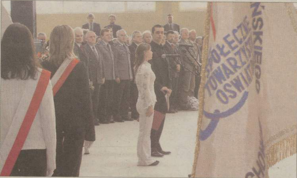
Jubileusz szkoły zbiegł się z otwarciem nowoczesnej hali sportowej.