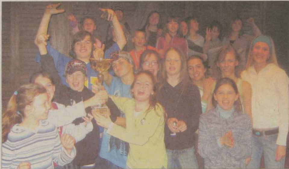
Czulchowskie zespoły po ogłoszeniu wyników miały się z czego cieszyć...