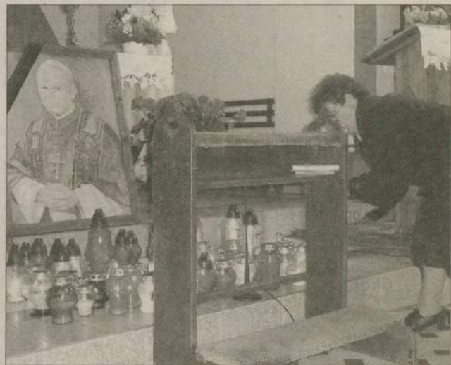
W tym roku mieszkańcy Debrzna spotkają się w kościele na widowisku poświęconym Papieżowi.