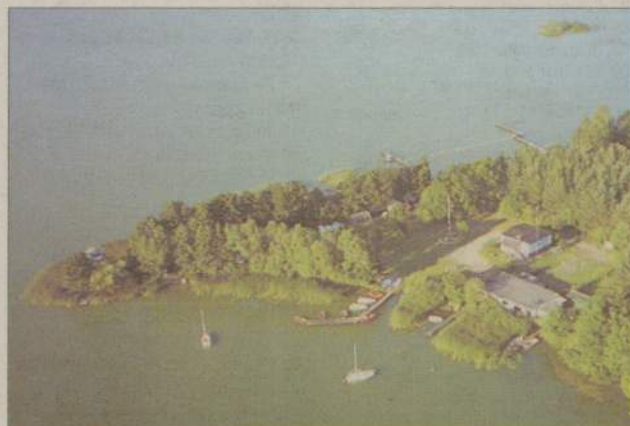
Kąpielisko Ośrodka Szkoleniowego WOPR podczas ubiegłorocznego podsumowania sezonu letniego w Gdańsku zostało wyróżnione jako najlepsze kąpielisko śródlądowe w województwie pomorskim.

Stowarzyszenie zwróciło się również do Wielkiej Orkiestry Świątecznej Pomocy o przekazanie nowoczesnego fantoma do nauki reanima-