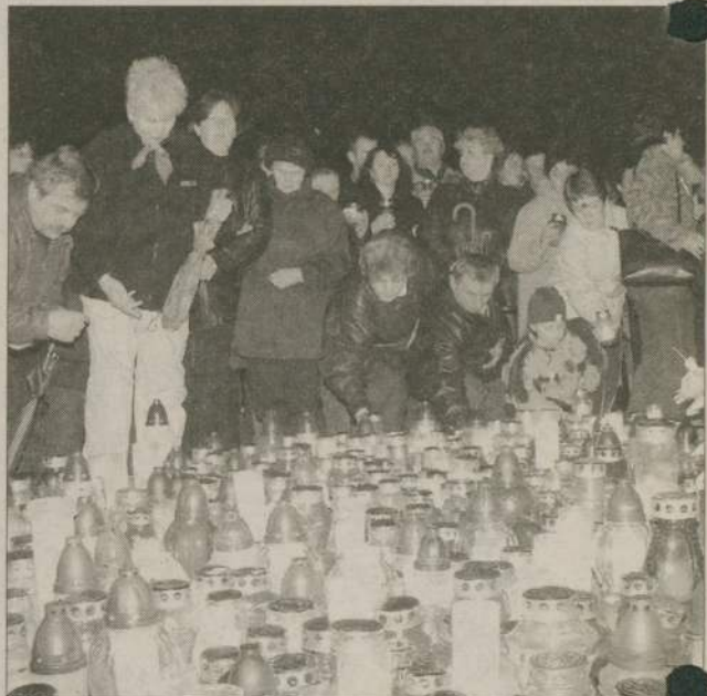
Tysiące mieszkańców Czarnego przez kilka kwietniowych dni 2005 roku spotykało się aby oddać hołd zmarłemu Ojcu Świętemu.