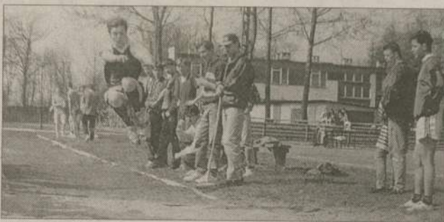
Zajęcia sportowe mają tu długą tradycję...

Krzysztof Lichucki k.lichucki@prasabalt.gda.pl