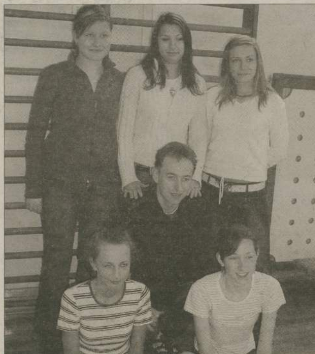
Drużyna siatkarek z Zespołu Szkół Ponadgimnazjalnych (na zdjęciu w niepełnym składzie) z opiekunem.