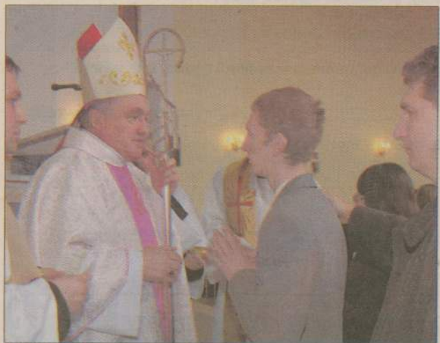
Dla kilkudziesięciu młodych mieszkańców Czarnego mianona niedziela była szczególnym dniem. Tego dnia otrzymali bowiem sakrament bierzmowania. Udzielał im go ksiądz biskup Kazimierz Nycz.