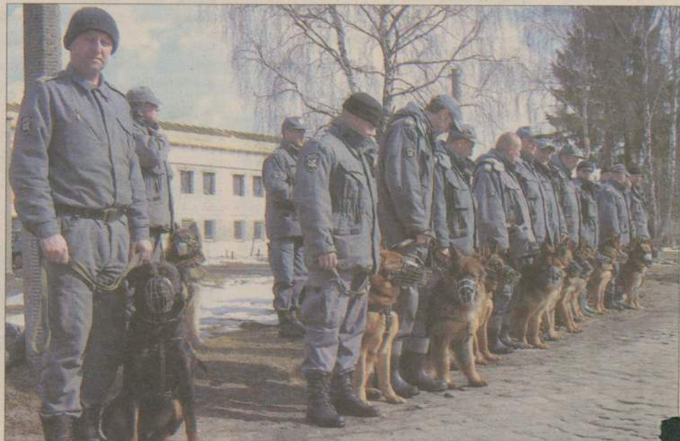
W tej chwili w Czarne szkolonych jest kilkadziesiąt psów.

Już po kupieniu pieska trzeba zapoznać go z przewodnikiem. Pies musi zaak-