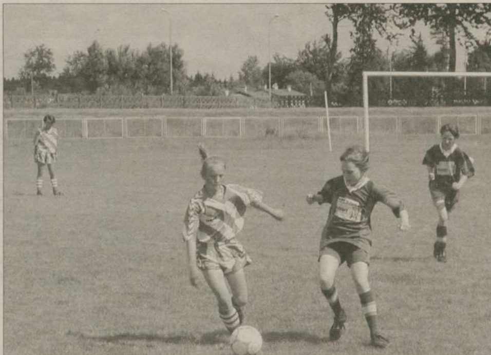
W turnieju Wielgusa mogą grać zarówno chłopięce, jak i dziewczęce zespoły piłki nożnej.

Od 26 kwietnia każde srodowe popołudnie na boiskach OSiR wypełniać będą mecze drużyn dziecięcych i młodzieżowych. Organizatorami ligi są OSiR Człuchów, KS Piast-Armed Człuchów, Powiatowy Ośrodek Edukacji, Kultury, Sportu i Turystyki w Człuchowie, UKS Olimp przy SP nr 1, UKS Relaks przy Gimnazjum nr 1 oraz