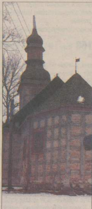
Jest szansa na to, że w przyszłości ten kościół będzie tętnił życiem.