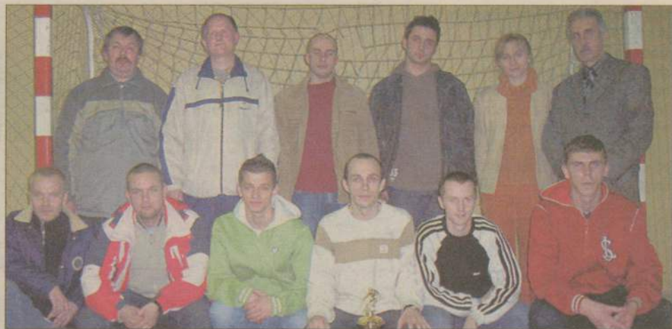
Od trzeciej kolejki zespół Auto Części Osowski tylko „na chwilę” oddał pierwsze miejsce w rozgrywkach. Na zdjęciu: zwycięzcy z organizatorami i sponsorami.

W sumie w lidze zagrało 8 drużyn, jedna z nich wycofała się po pierwszej rundzie. Uczestnicy rozgrywek spędzili na parkiecie hali Gimnazjum nr 1 w Człuchowie ponad 1100 minut, rozegrali 47 spotkań punktowanych i kilka towarzyskich, dwa oddano walkowerem. Na listę strzelców wpisało się 51 zawodników, razem trafiali do siatki 240 razy. Czterech pechowców strzelało do własnej bramki.