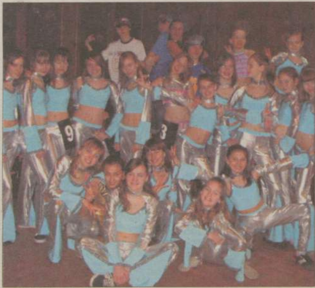
Switch jako duża formacja taneczna...