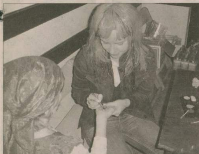
Podczas balu można było zadbać o dodatkowy „makijaż”.