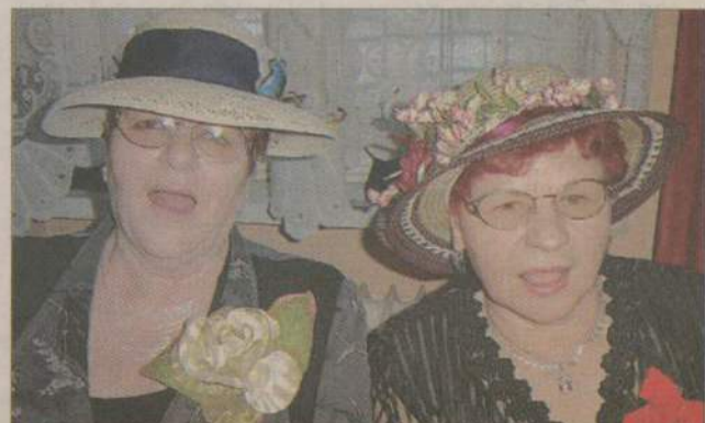
Tylko bez zdjęć - zdawały się mówić panie w kapeluszach.