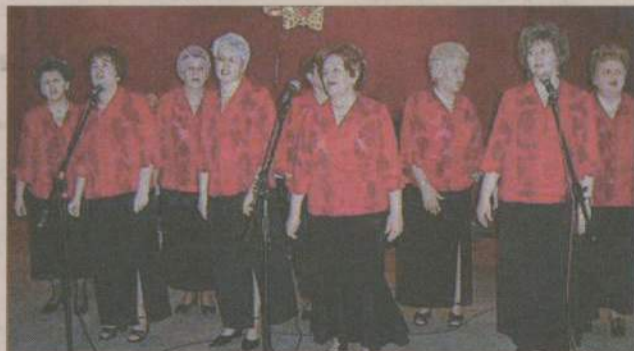
Słowinki zrobiły prawdziwą furorę nie tylko w karnawałowych strojach ale również gdy występowały w tradycyjnych uniformach.