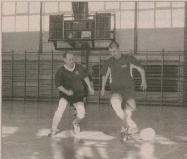
W ostatnim meczu turnieju Policja pokonała Urząd Skarbowy 6:1.