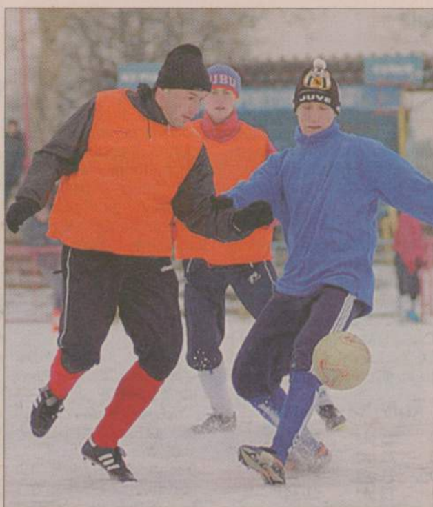
Piłkarzom Piasta nie udało się pokonać chojniczan w żadnym ze sparingów.