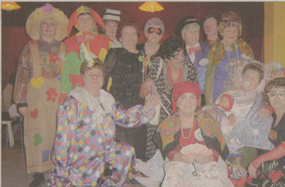
Tak prezentowali się uczestnicy konkursu na najbardziej oryginalny strój karnawałowy.

Salwy śmiechu można było usłyszeć w trakcie ostatkowego balu karnawałowym zorganizowanym przez debrzneńskie koło Związku Emerytów i Rencistów.