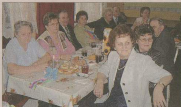
Nie wszyscy przygotowali stroje karnawałowe - wszyscy jednak dobrze się bawili.