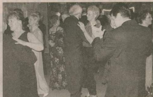
W V Karnawałowym Balu Charytatywnym wzięło udział 120 osób.