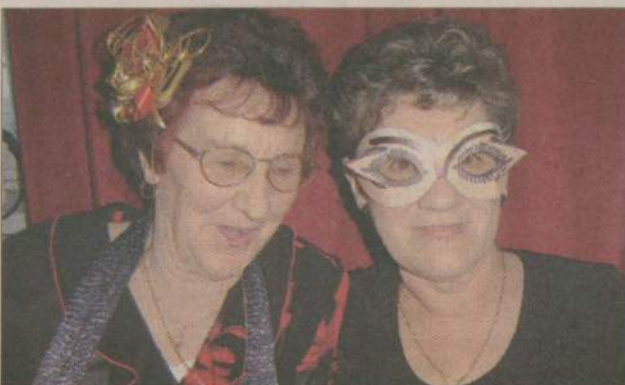
I kto tu ma większe oczy?