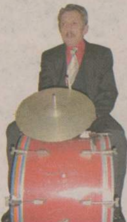
Przy takich instrumentach nie trzeba martwić się nagłośnieniem.