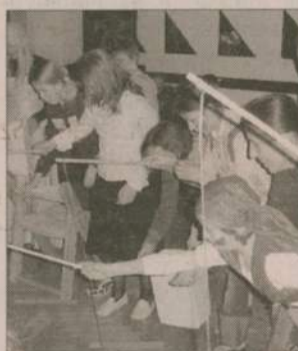
Wiaderko, wędka i... na ryby. Pomysłowych konkursów nie brakowało.