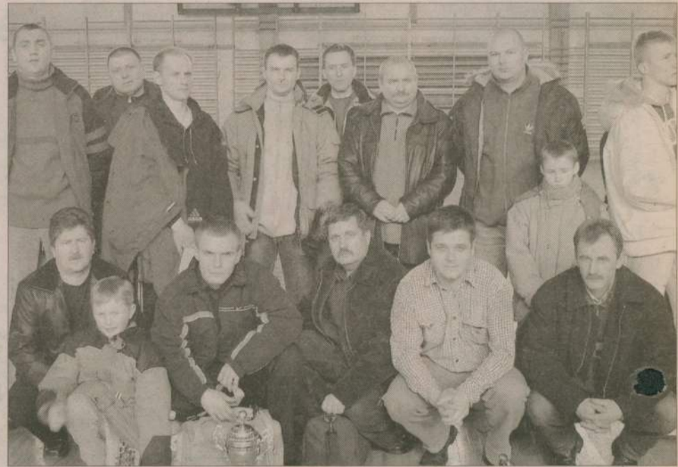
Policjanci zagrają teraz o super puchar starosty człuchowskiego.