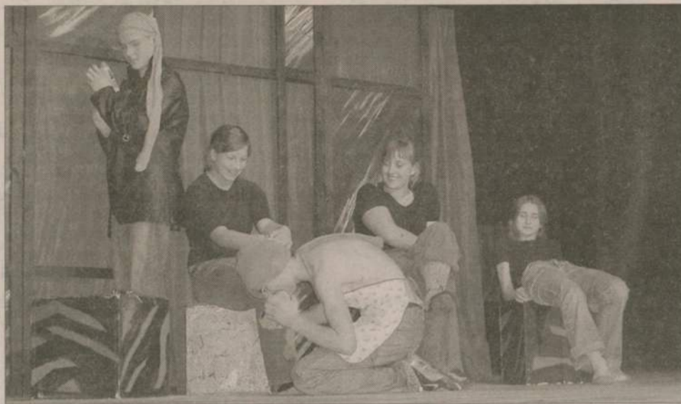
Możemy się zarazić już w chwili narodzin, na podwórku, w szkole, u fryzjera... Na szczęście to tylko kabaret w wykonaniu Grupy Przyjaciół Profilaktyki.

- Przeszli przez pierwszy etap, na który zgłosiło się sto