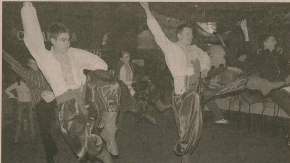
Studniówka zgodna z tradycją, ale... ukraińską. Zarówno stroje jak i tańce warto zobaczyć.