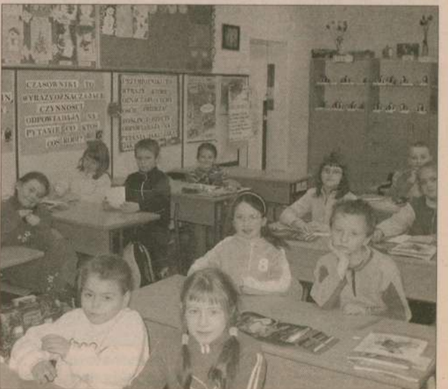
W Zespole Kształcenia i Wychowania w Koczale uczą się dzieci z całej gminy.