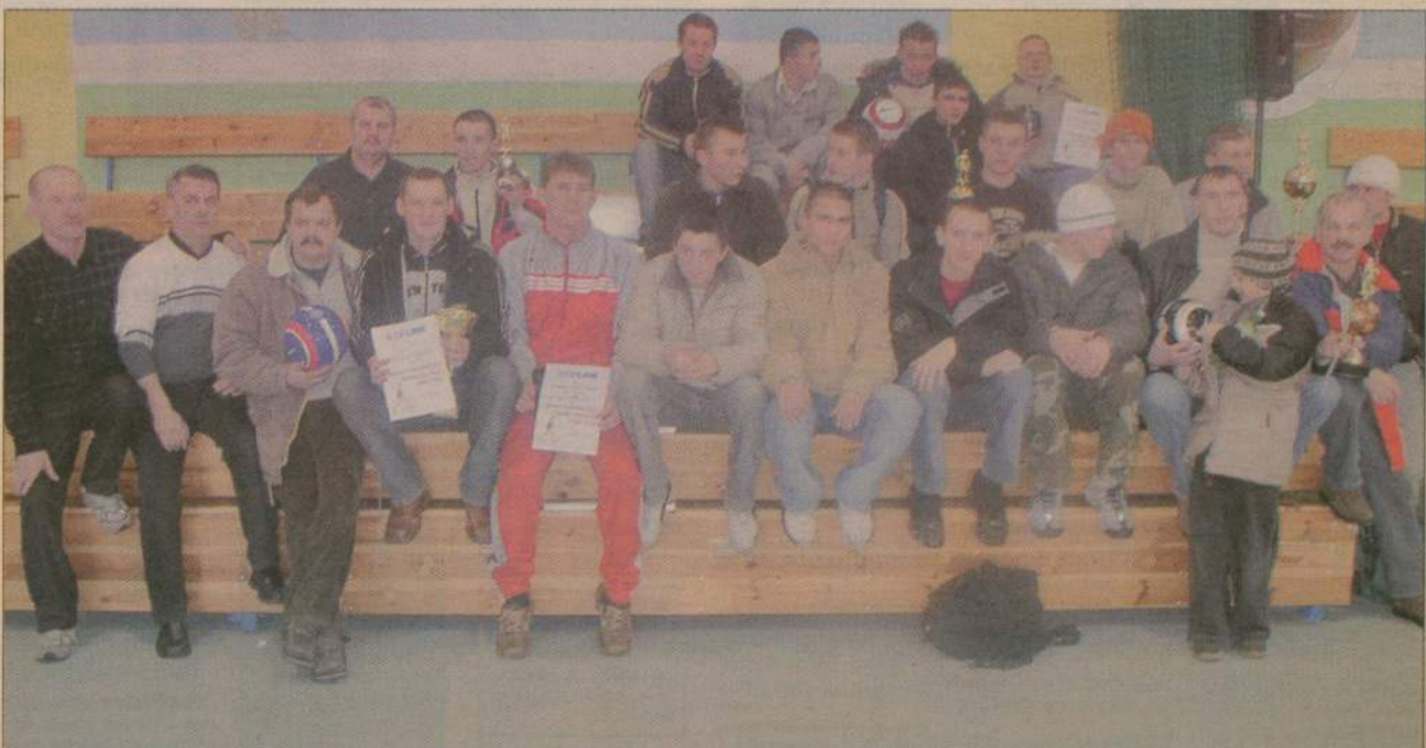
Każda drużyna, która uczestniczyła w rozgrywkach otrzymała puchar i nagrodę.