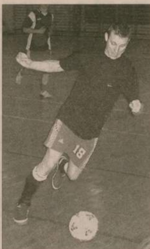
Mecz między OHP A oraz FC Rychnowy stały na dosyć wysokim, jak na amatorów poziomie.

Ostatni poniedziałkowy mecz Kadra oddała bez walki, ponieważ drużyna nie stawiała się w komplecie. Po dziewiątej rundzie spotkań zespół zajmujący trzecie