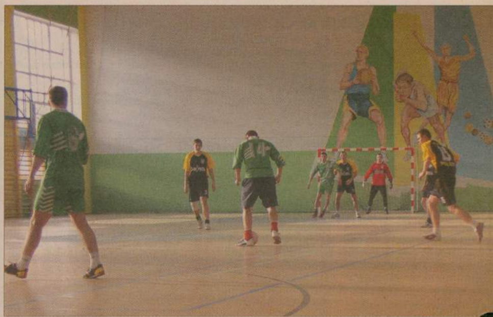
Ostatnie spotkanie ligi było decydujące. Zwycięstwo Trans Złomu (żółto-czarne stroje) 4:1 potwierdziło, że drużyna ta nie ma sobie równych.

W sumie w I Otwartej Powiatowej Lidze Piłki Nożnej