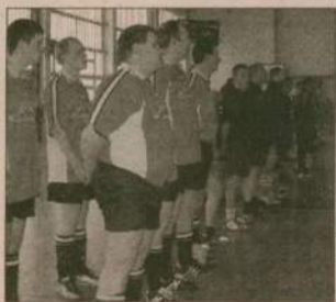
W turnieju zegrali m.in. strażacy-ochotnicy z niemieckiego Prenzlau.