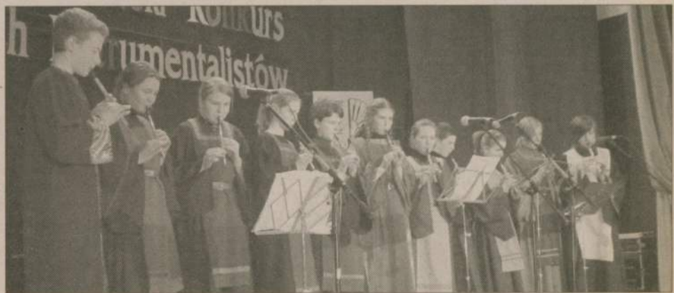
Aż stu czterech uczestników wzięło udział w III Człuchowskim Konkursie Młodych Instrumentalistów. Zagrały fortepiany, akordeony, gitary, flety, flazolety...

Gappa, starosta człuchowski. Patronat medialny nad imprezą objął „Dziennik Człuchowski”. (stef)