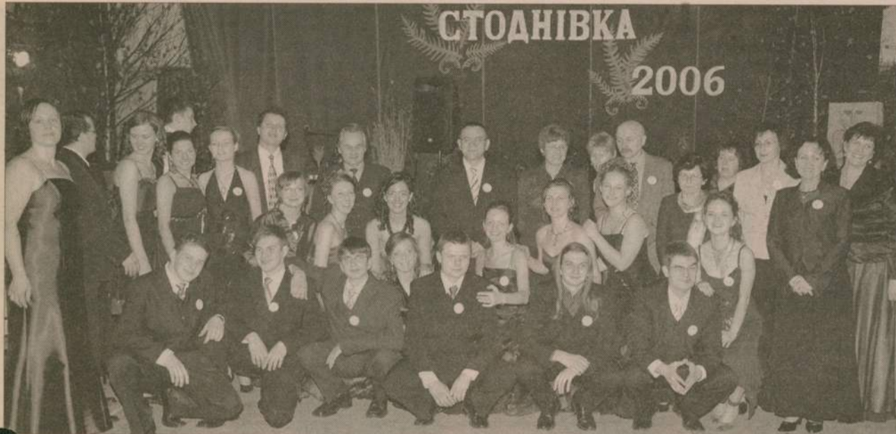
Wśród uczniów liceum w Białym Borze nie brakuje osób z rejonu człuchowskiego.

sobótkowej scenerii bawili się na studniówce uczniowie trzeciej klasy I Liceum Ogólnokształcącego z ukraińskim językiem nauczania im. Tarasa Szewczenki w Białym Borze.