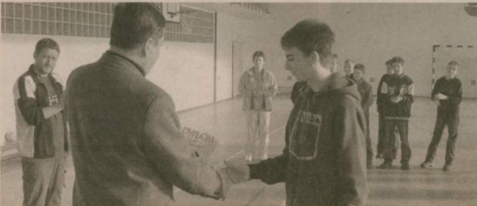
Drużyna SP Debrzno pokonała rywali i zagra w finale wojewódzkich mistrzostw w mini piłce ręcznej.