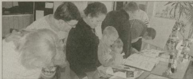
Takiego bogactwa wspomnień można tylko pozazdrościć.

Przeglądanie kronik było jedną z atrakcji ostatniego zjazdu Pomorskiego Wojakowskiego Oddziału Polskiego Towarzystwa Turystyczno-Krajoznawczego, który odbył się w Czarnem. Księgi zajęły kilka ławek - a jak się dowiedzieliśmy, była to tylko niewielka część bogatego zbioru. I. nic dziwnego, bo członkowie kół mają co zapisać i wspominać. Napięty