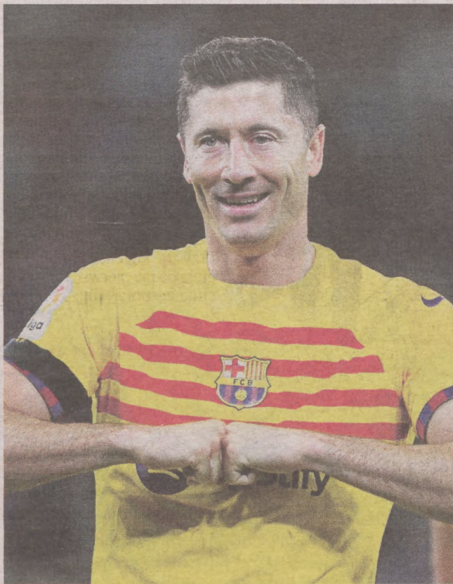
Robert Lewandowski strzelił dwa gole, a jego Barcelona wygrała 4:2 i mogła świętować zdobycie mistrzostwa

Wiele wskazuje na to, że na ostatniej prostej „Kanonierzy” pogrzebali swoje szanse na mistrzostwo. Jakub Kiwior nie uchronił swoich kolegów przed wysoką porażką na własnym stadionie z Brighton (0:3). Piłkarzom Mikela Artety pozostaje już tylko liczyć na cud i... matematykę. Nie dość, że strata do Manchesteru City wynosi 4 „oczka”, to jeszcze drużyna z niebie-