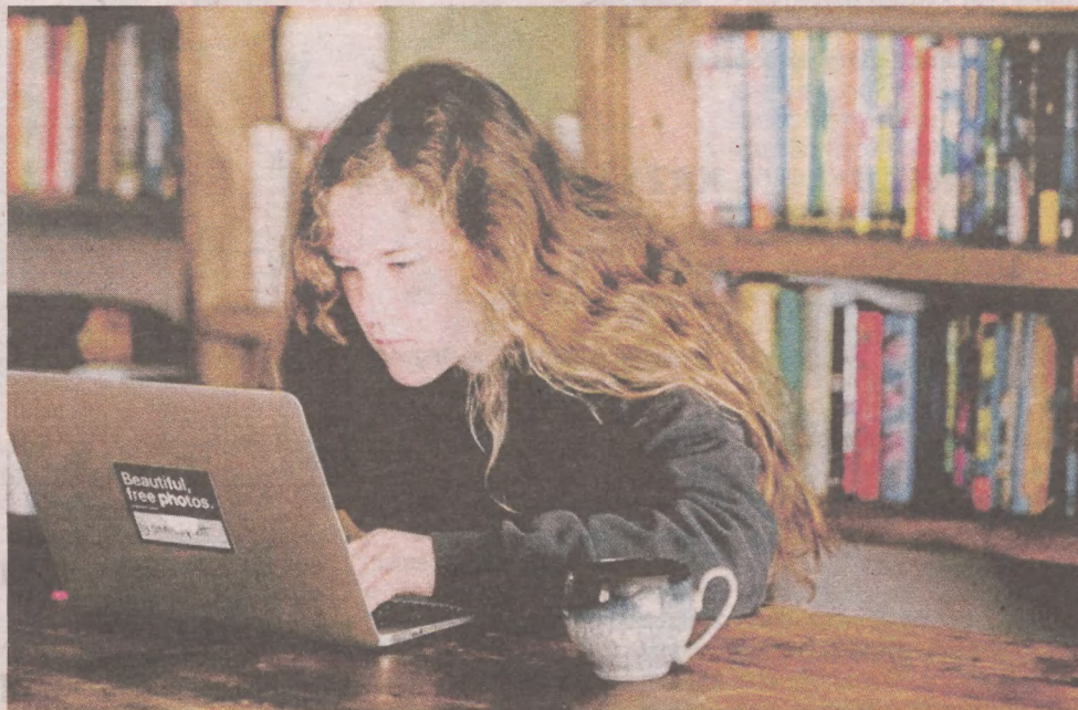
Polskie prawo pozwala niepełnoletnim na prowadzenie własnej działalności gospodarczej. Po zmianach ma być to jeszcze łatwiejsze

Działalności gospodarczej nie trzeba zakładać, jeśli w skali miesiąca zarabiamy poniżej 1745 zł. W lipcu zmienią się przepisy. W życie wejdzie nowelizacja, która sprawi, że limit przychodów uprawniający do prowadzenia działalności nierejestrowanej będzie wyższy. Zostanie on podniesiony