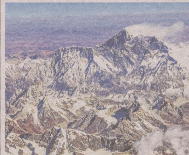
Mount Everest jest najwyższym szczytem Ziemi, wznoszącym się na rekordowe 8848 metrów