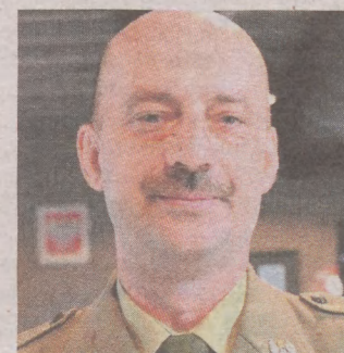
Gen. Bryś: - Młodzi ludzie chcą się szkolić, pracować z nowoczesnym sprzętem