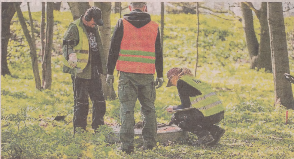
Najnowsza odsłona prac archeologicznych na Westerplatte

Również i teraz poszukiwane będą drobne zabytki metalowe z użyciem wykrywaczy metali. - Na całym terenie Westerplatte można spodziewać się bardzo ciekawych znalezisk - zaznacza Filip Kuczma. ©