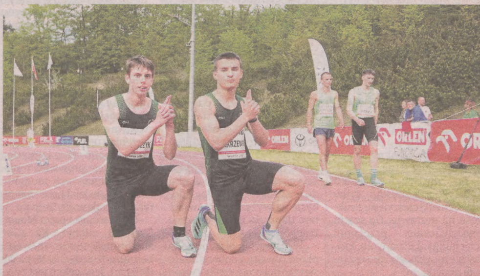
Sztafeta 4x200 m AML Słupsk triumfowała w kategorii do 20 lat

Krzysztof Głowinkowski krzysztof.glowinkowski@gp24.pl