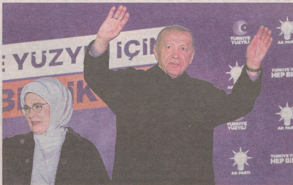
Erdogan jest prezydentem Turcji od 2014 roku. Dotąd wygrywał w pierwszych turach

Według relacji medialnych zwolennicy obydwu głównych kandydatów w wyborach prezydenckich rozpoczęli świętowanie w niedzielę po zamknięciu lokali wyborczych. Pojazdy, pełne trąbiących i machających flagami ludzi, przejeżdżały przez Ankarę. W wielu punktach stolicy rozlokowano policję, która czujnie obserwowała tłumy.