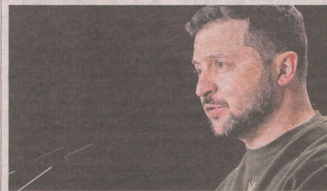
Zełenski ostatnio spotkał się z przywódcami wielu europejskich państw. Rozmawiał z nimi o dostawach broni

Brytyjczycy postanowili przekazać Ukraincom m.in. drony o zasięgu ponad 200 km. Zełenski liczył jednak przede wszystkim na myśliwce i inne samoloty bojowe, niezbędne w przeprowadzeniu kontrofensywy. PAP