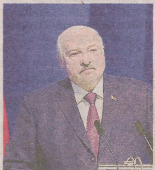
Prezydent Białorusi miał trafić do szpitala

Jak informuje Radio Swaboda, podczas niedzielnych obchodów w Mińsku zaplanowane było wystąpienie Aleksandra Łukaszenki. Białoruskiego przywódcy jednak zabrakło na uroczystościach, a jego wystąpienie