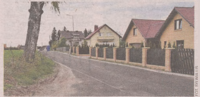
Droga w Ugoszczy była niedawno remontowana

- Okazało się, że na przebudowanej drodze gminnej łączącej dwie drogi powiatowe ktoś prawdopodobnie maszyną rolniczą ciągniętą po nawierzchni uszkodził jej warstwę ścieralną - mówi Ryś. - Wykonanie tej inwestycji miało i ma służyć wszystkim mieszkańcom na długie lata. Jeśli sami użytkownicy nie szanują inwestycji, nasuwa się pytanie, jaki jest sens realizacji podobnych przedsięwzięć w przyszłości? - dodaje. I wyjaśnia: - Droga została wyremontowana w ubiegłym roku z pieniędzy unijnych, przebiega między polami