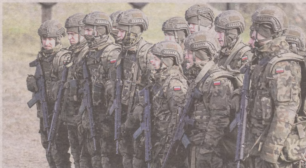
Wśród żołnierzy są także kobiety. Ćwiczą tak jak wszyscy. Nie ma żadnej taryfy ulgowej

Prowadzimy szereg działań promocyjnych i rekrutacyjnych. Obecnie WP w mojej ocenie jest bardzo atrakcyjnym pracodawcą, który zapewnia stabilne zatrudnienie, godziwe wynagrodzenie i możliwość rozwoju osobistego. Obecnie żaden żołnierz nie musi czekać 12 lat, aby pójść na kurs podoficerski. Te-