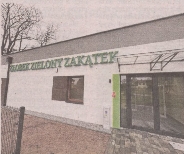
Nowy żłobek w Kołczygłowach. Otrzymał nazwę „Zielony zakątek”

Koszt prac budowlanych to ponad 2,7 mln zł. Do tego trzeba jeszcze doliczyć około 130 tys. zł jako wydatek na wyposażenie placówki. Inwestycja jest dotowana przez rząd - 1,5 mln zł pochodzi z Polskiego Ładu, a 660 tys. zł z programu Ma-