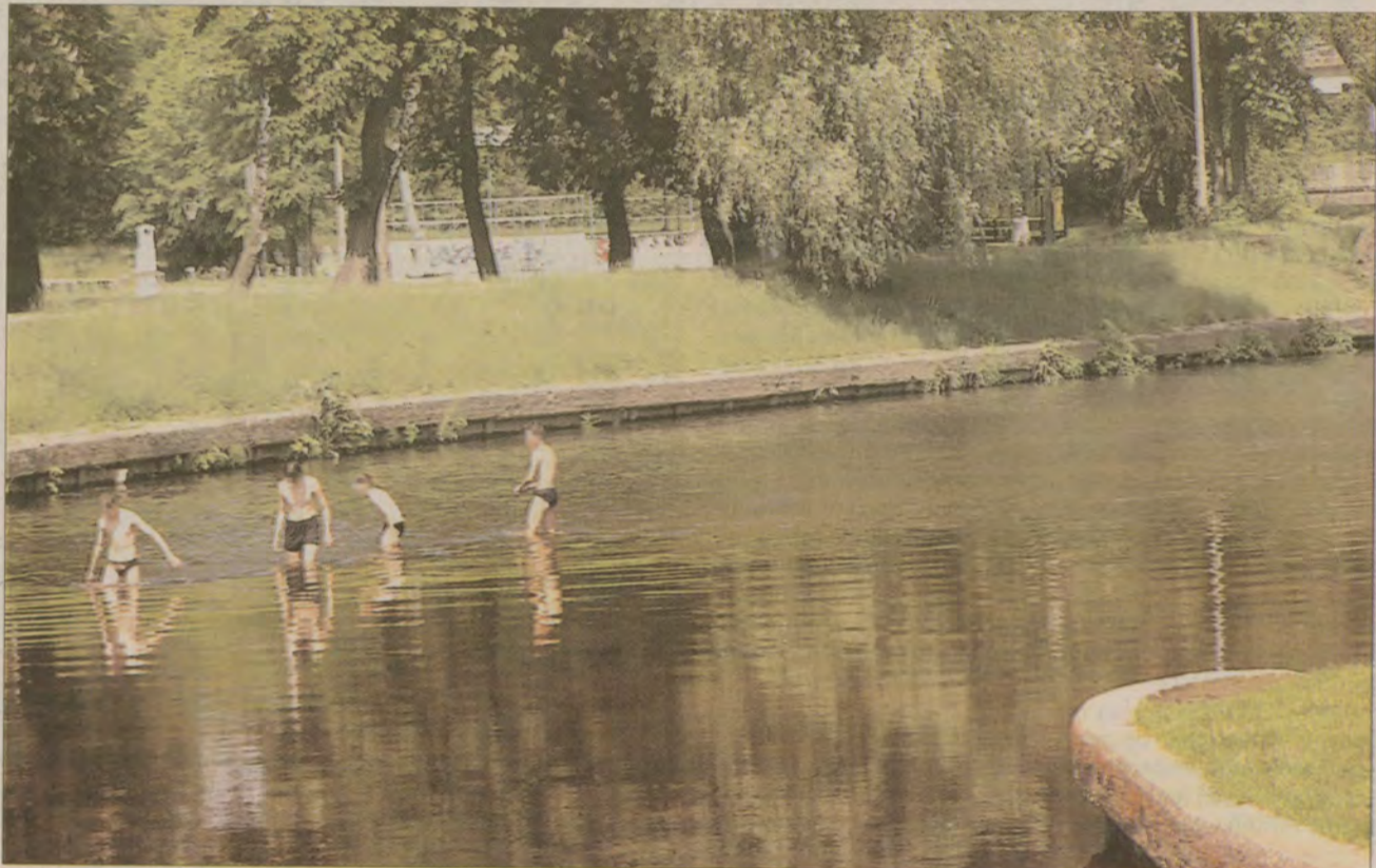
To zdjęcie zrobiliśmy podczas fali upałów dwa dni przed katastrofą ekologiczną w Raduni. Obecnie kąpiel w rzece może być niebezpieczna dla zdrowia.

Ryby w Raduni w okolicy Pruszcza Gdańskiego pojawiają się dopiero za cztery lata. Do pełnego odtworzenia ekosystemu sprzed katastrofy ekologicznej z 27 maja, do której doszło w dolnym biegu rzeki, potrzeba około dziesięciu lat - szacują członkowie Polskiego Związku Wędkarskiego w Gdańsku. Jest też kolejny aspekt sprawy - o kąpiel w Raduni w Pruszczu można w tym roku zapomnieć. Kąpielisko miejskie już w poprzednich latach było zamykane z powodu nadmiaru bakterii w wodzie. W tym roku Urząd Miasta nawet nie zgłosił akwenu do badania. Nie ma to większego sensu - woda długo będzie się oczyszczała z toksyn.