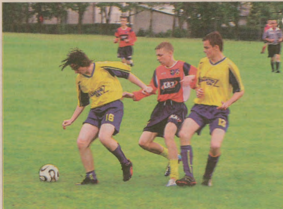
Mecz między Pszczółkami (w żółtych koszulkach), a Skarszewami zakończył się remisem 1:1.

- Takich turniejów musi być jak najwięcej. Powinni je obserwować profesjonalni trenerzy z gdańskich klubów. Wówczas każdy młody talent zostałby zauważony i mógłby być prowadzony w dobrym kierunku - dodał Janusz Kupcewicz.