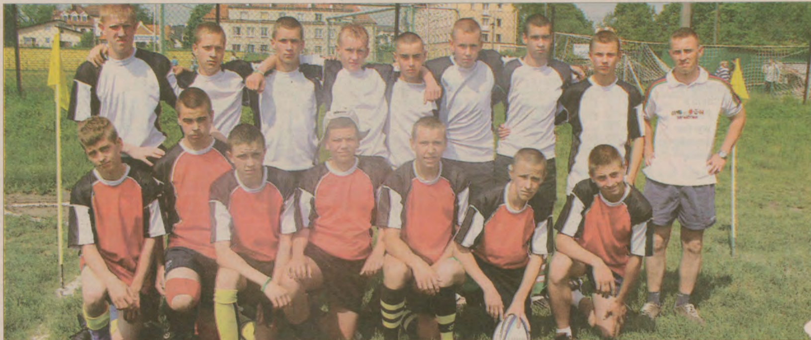
Pruszczańska drużyna rugby rocznik 1992 Mach Jantar, brązowi medaliści mistrzostw Polski.

- Pierwsze dwa mecze wygrał wysoko do zera. Doskonała, szybka obrona i silna