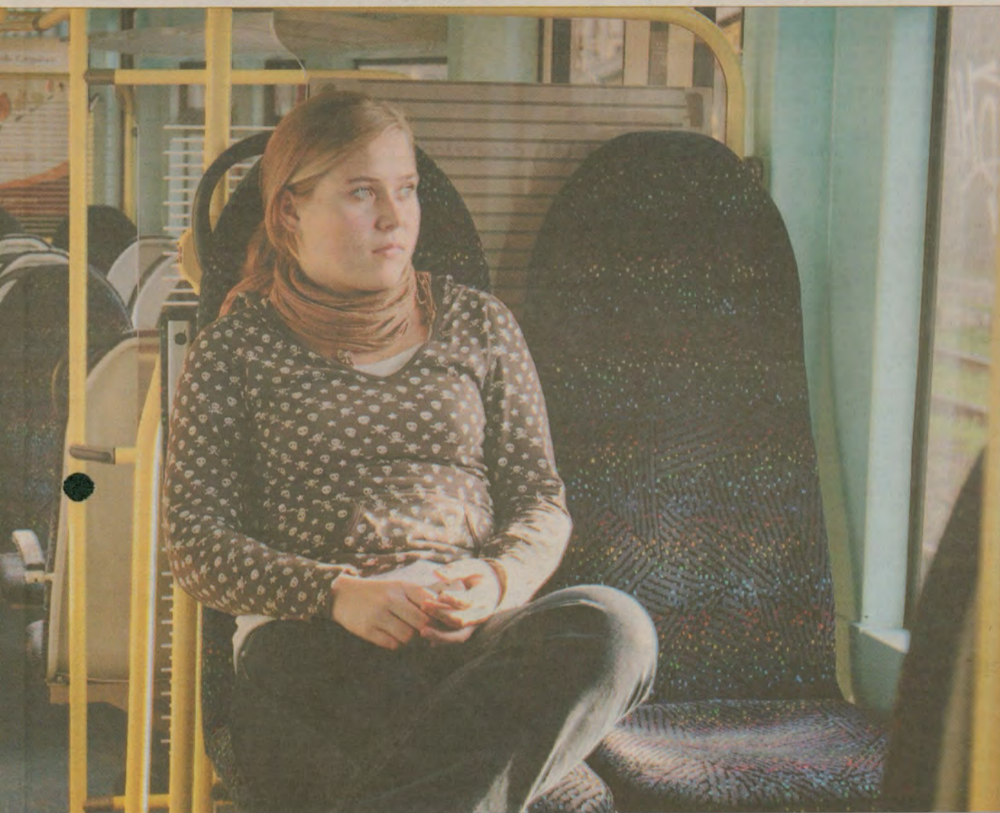
... pasażerów z Gdyni do Helu