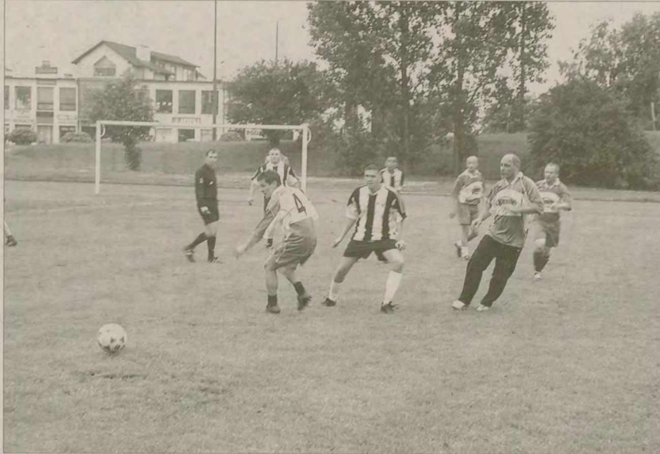
Na zdjęciu mecz Stara Wiara kontra ANR Pruszcz.