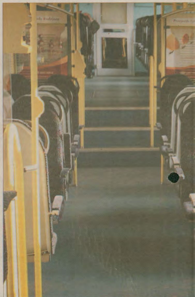
Takimi nowoczesnymi szynobusami PKP Przewozy Regionalne wożą pasażerów

Psa, nie więcej niż jednego, można przewieźć jeśli: ■ podróżny posiada bilet dla psa oraz aktualne świadectwo szczepienia psa ■ pies jest trzymany na smyczy i ma założony kaganiec Za jednorazowy przewóz psa (każdej wielkości), za wyjątkiem psa przewodnika osoby niewidomej, obowiązuje - niezależnie od odległości - opłata zryczałtowana w wysokości 4 zł. ■ Za małe zwierzęta pokojowe (oprócz psów) nie pobiera się opłat. Powinny być one umieszczone w odpowiednim opakowaniu (klatce, koszu, skrzynce) i nie mogą być uciążliwe dla pasażerów. Więcej o ofertach PKP Przewozy regionalne w internecie: www.pr.pkp.pl