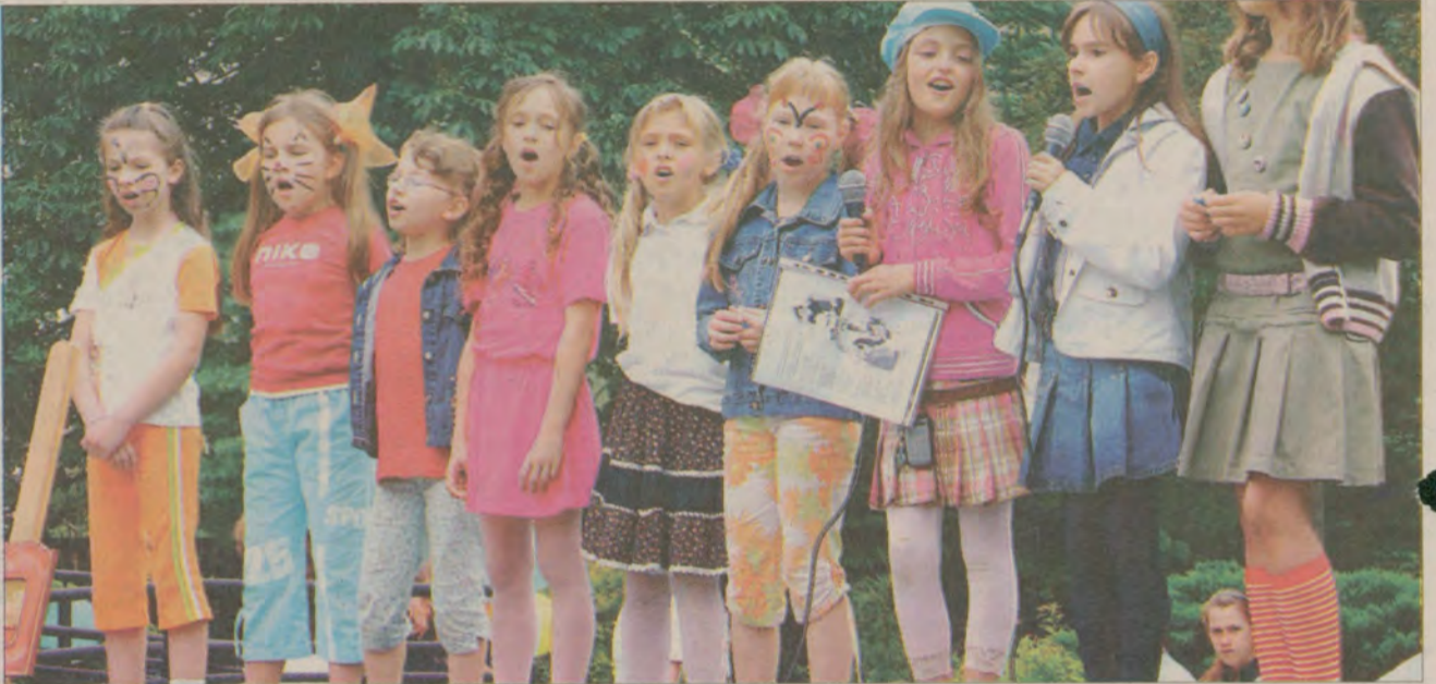
Nie ma lepszego nad Jana Pawła II - śpiewał o patronie szkolny chór, na melodię „Quanta la mera”.