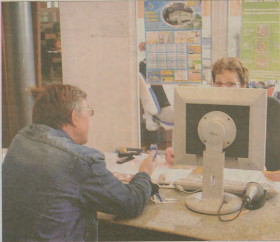
Odnowiony Wydział Komunikacji Starostwa Powiatowego w Pruszczu Gdańskim.

- To dobry pomysł. Nie będzie trzeba tracić czasu na stanie w gigantycznych kolejkach. Wcześniej był z tym