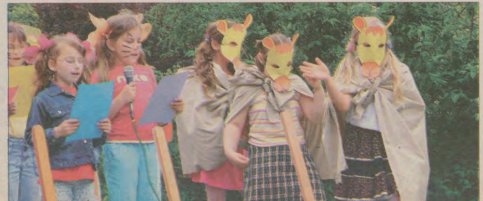
Uczniowie klasy drugiej SP w wesołej włoskiej piosence o wielbłądach.