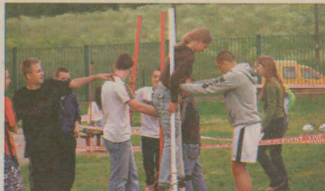
Podczas festynu w Kolbudach gimnazjaliści świetnie się bawili.

- Było mnóstwo śmiechu i zabawy. Dawniej tak nie bawiliśmy. Na co dzień nie mamy okazji „poszaleć”. Dziś każdy