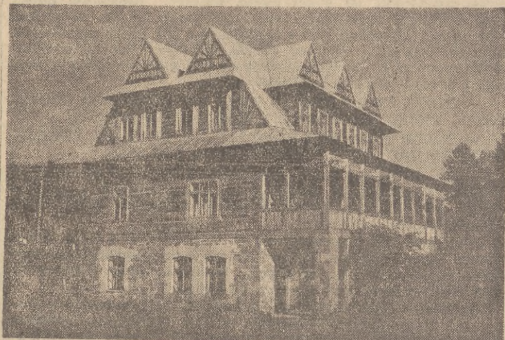
Dom, w którym mieszkał Włodzi mierz Lenin, jest dziś siedzibą muzeum.

ZAKOPANE (PAP). Dnia 22 bm. w 80 rocznicę urodzin genialnego wodza międzynarodowego proletariatu — Muzeum Lenina w Poroninie stało się celem licznych wycieczek z całego kraju.