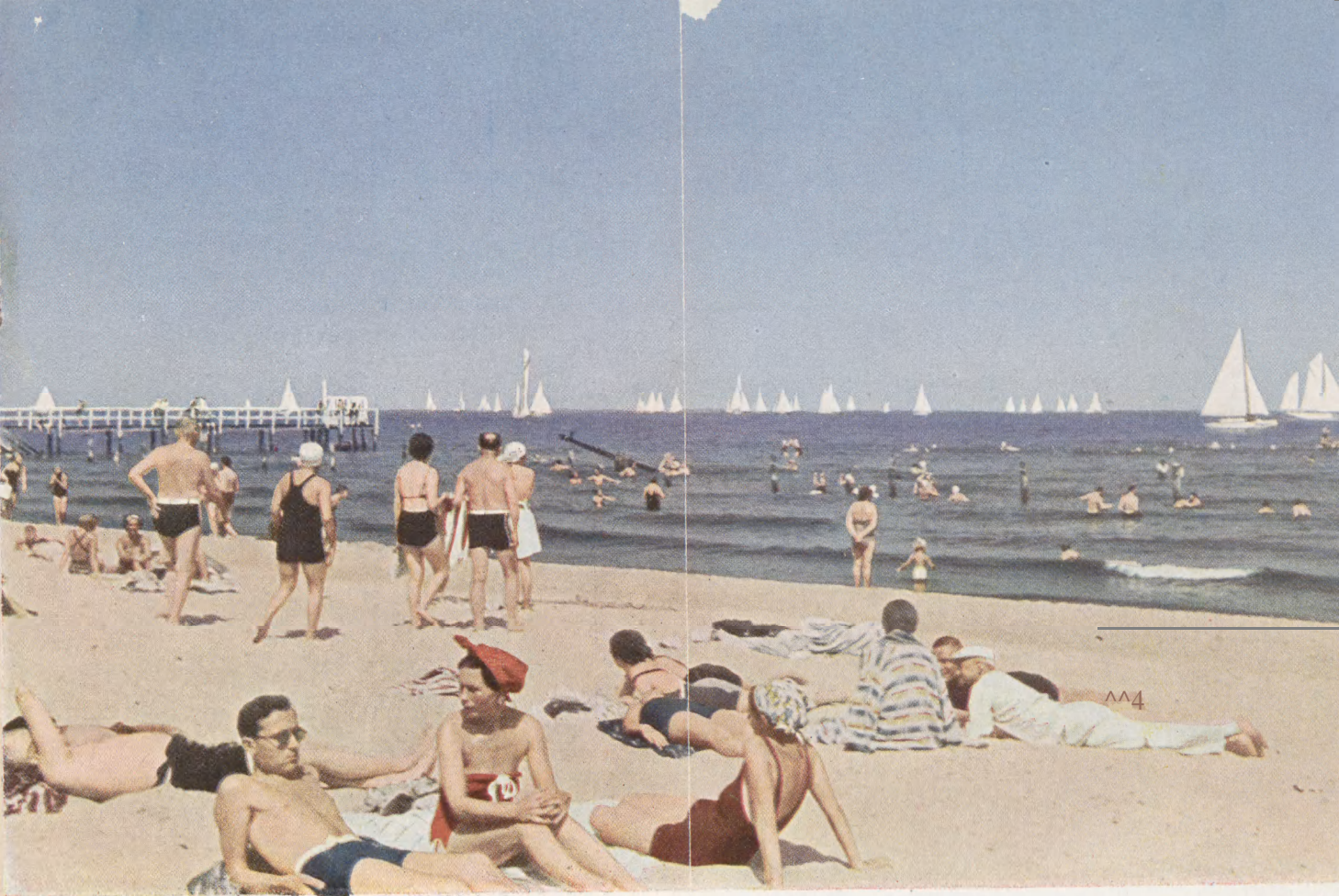
jarbfotoe: f). Sönnhe, Oamig

l ü b Sie am Stranö* unö Baöeleben teil» nehmen, ober an rulligen Stellen itire