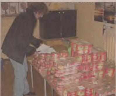
800 konserw trafiło do szkół.