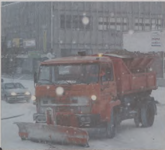
Zima nie powinna nas zaskoczyć.

29 października odbyło się spotkanie władz miasta Kościerzyna z przedstawicielami służb porządkowych i firm zajmujących się sprzątnięciem. Celem spotkania było zda-