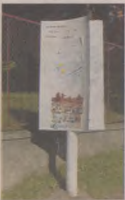
Plakatować można tylko w miejscach wyznaczonych.

Plakaty i ogłoszenia, które są masowo umieszczane na latarniach i ścianach budynków, szpecą wizerunek naszego miasta. W trosce o estetykę i przestrzeganie przepisów Straż Miejska w październiku usunęła wszystkie plakaty, które zostały powieszzone w miejscach niedozwolonych. Plakaty można umieszczać w miejscach specjalnie do tego wytyczonych, czyli na słupach ogłoszeniowych i tablicach informacyjnych. W porozumieniu z władzami miasta zainteresowani mogą umieszczać swoje plakaty w innych, wcześniej dokładnie ustalonych miejscach. Straż Miejska za umieszczanie plakatów w niewłaściwych miejscach karać będzie mandatami a sprawca zobowiązany zostanie do usunięcia własnych plakatów czy ulotek.