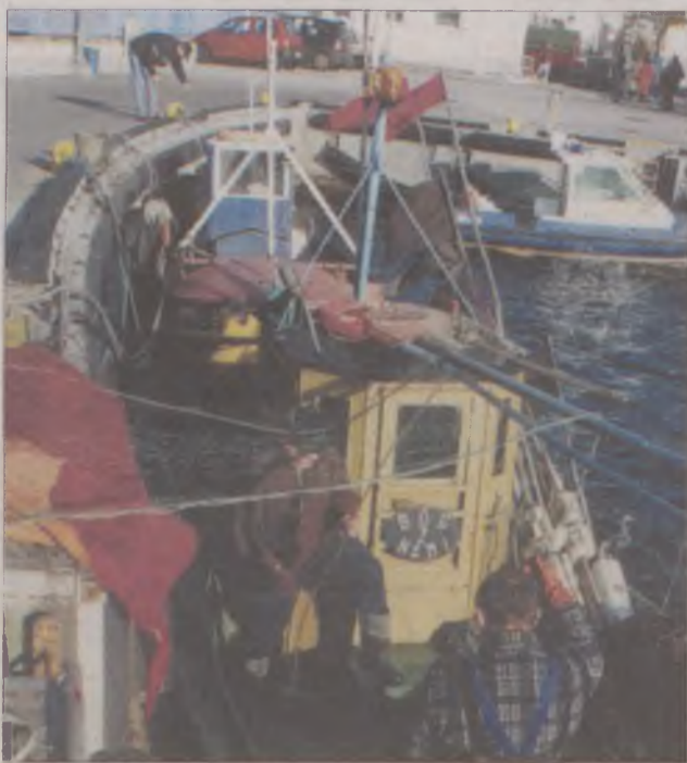
Rybakcy jeszcze w porcie.

Modernizacja portu kończy się. Większość funduszy pochodzi z budżetu państwa, natomiast organem prowadzącym jest Starostwo Powiatowe w Pucku. Dzięki tej i wielu innym inwestycjom powiat jest w ścisłej krajowej czołówce wśród najczęściej inwestujących.