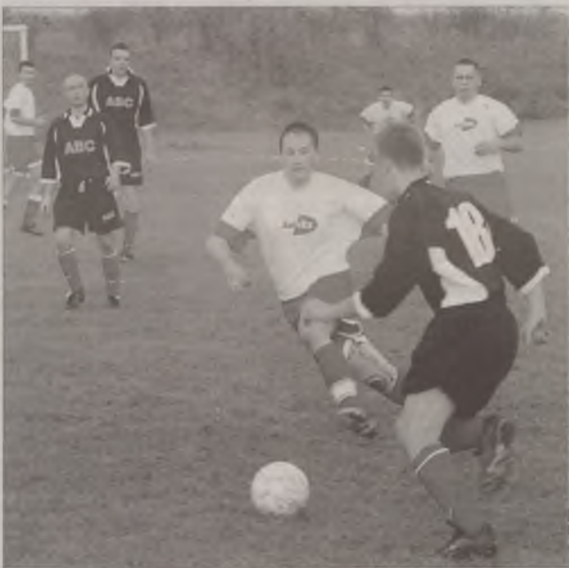
Piłkarze Kasztelanii (przy piłce) w meczu z Jareksem Grabowo.

Ton jesiennym rozgrywkom nadawała Chojniczanka II, Kasztelanія Garczyna, Huragan Nowe Polaszki i Jareks Grabowo. Głównie między