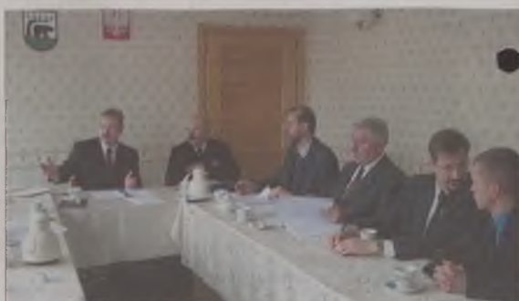
Twórcy idei budowy basenu spotkali się w Urzędzie Miasta