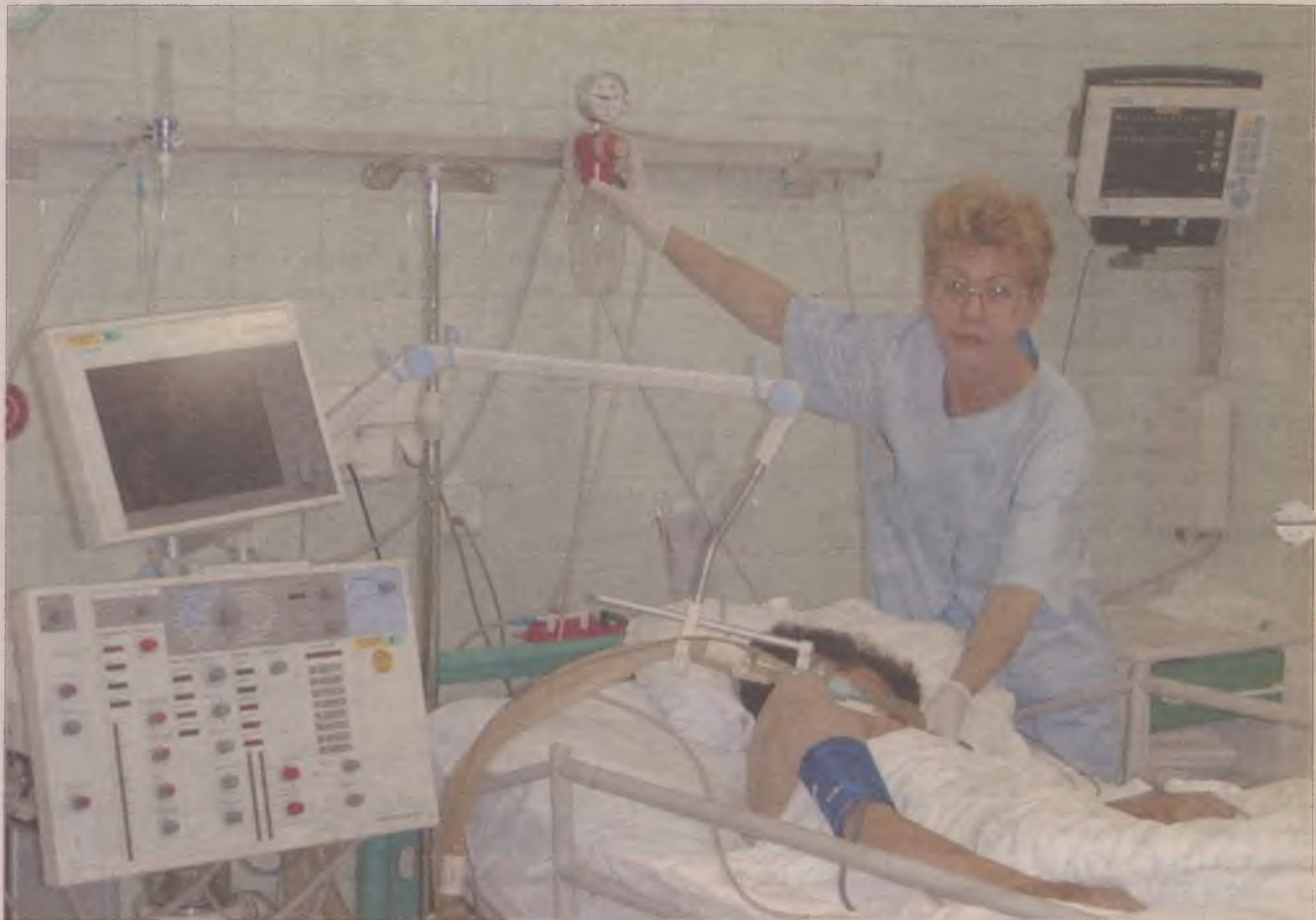
Obsługa tych skomplikowanych urządzeń nie stanowi większego problemu dla pielęgniarek anesteziologicznych.

D la każdego pacjenta i jego rodziny Oddział Intensywnej Opieki Medycznej to koniec świata, drzwi zamknięte, miejsce z którego się nie powraca. Nic bardziej mylnego. - Przyjmujemy wszystkich pacjentów w stanie zagrożenia życia, a ponadto tych, których pielęgnacja jest niemożliwa na innych oddziałach. Nasze pielęgniarki są