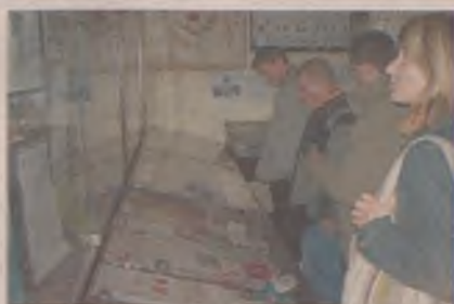
Wystawę PCK regularnie odwiedza młodzież szkolna.