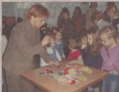
Organizatorzy festynu przygotowali wiele konkursów dla dzieci.

Klub Golfowy w Tokarach liczy 70 członków. Wpisowe dla seniorów wynosi 1500 zł, z kolei dla juniorów 300. Aby korzystać ze wszelkich przywilejów należy także ukończyć kurs na tzw. zieloną kartę. Później można do woli grać. Cena sprzętu golfowego zaczyna się od 500 zł, górnej granicy raczej nie ma. Naprawdę profesjonalne oprządowanie warte jest nawet kilkanaście tysięcy złotych.