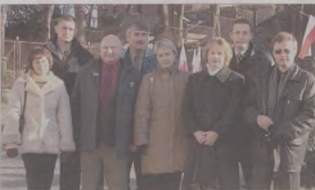
Delegacja ukraińska podczas zwiedzania miasta.