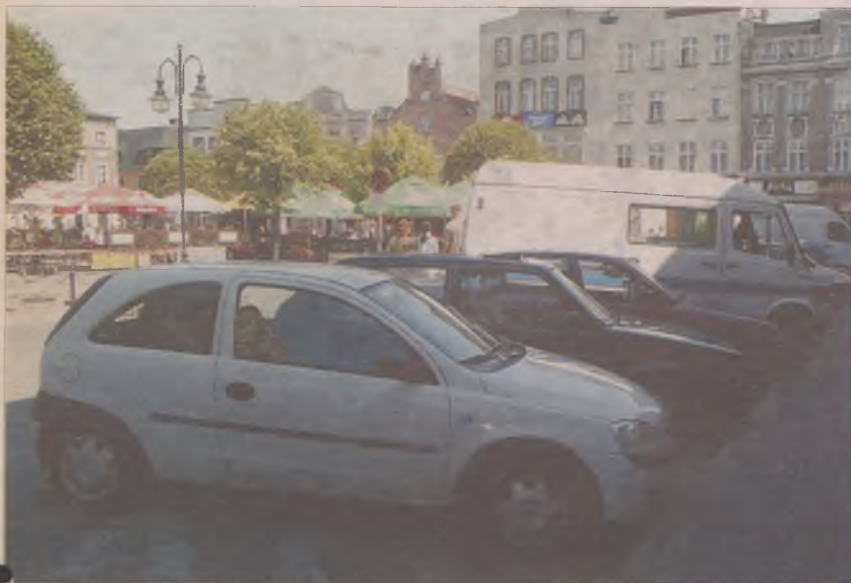
Najbardziej zastawiony samochodami Rynek jest latem.