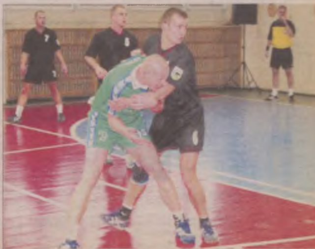
Sokół Vetrex przegrał na wyjeździe z Żukowem.