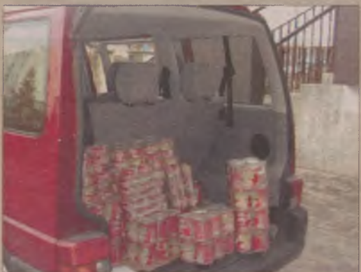
Do szkół podstawowych i gimnazjów w Kościerzynie trafiło prawie 800 konserw mięsnych.

KOŚCIERZYNA. Prawie 800 konserw mięsnych różnego rodzaju trafiło do wszystkich szkół podstawowych i gimnazjów na terenie Kościerzyny. Część z nich zostanie wykorzystana w szkolnych stołówkach dla dzieci, które są w trudnej sytuacji materialnej. Dzieci te również dostaną konserwy do swoich domów przed świętami Bożego Narodzenia.