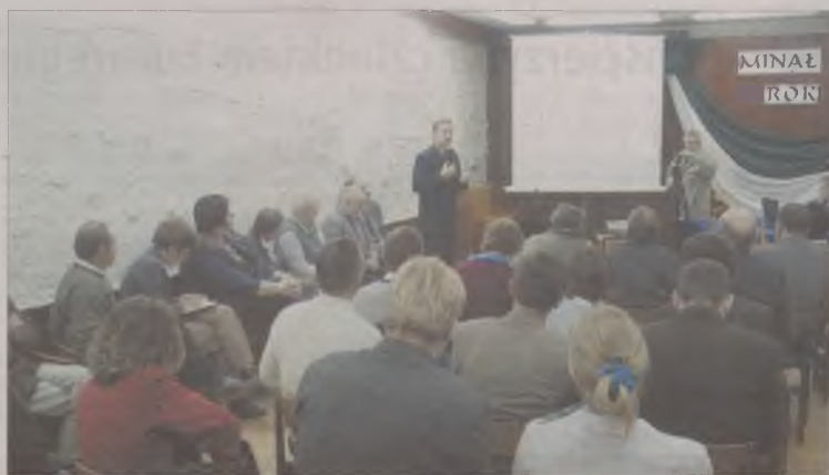
Kazimierz Stoltmann odpowiada na pytania mieszkańców.