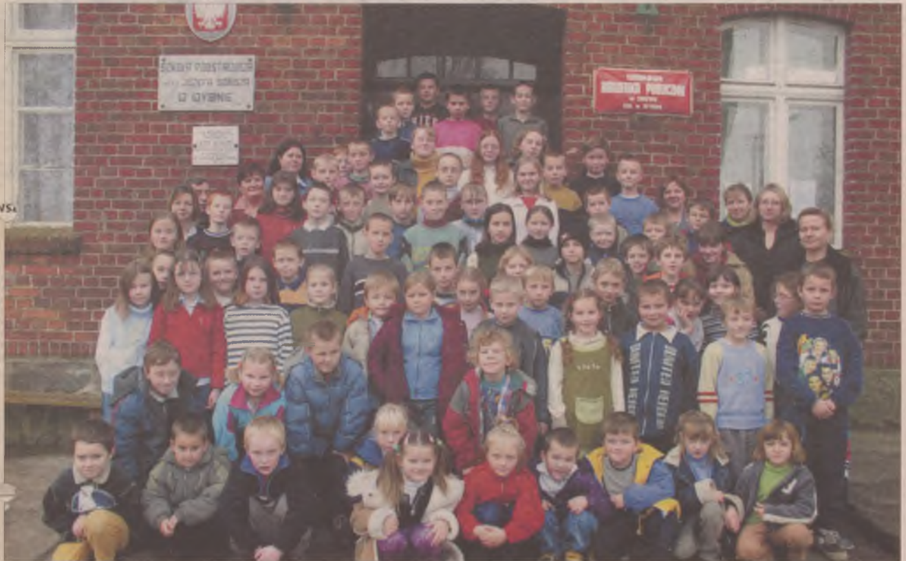
Uczniowie i nauczyciele Szkoły Podstawowej w Wysinie.

Uczniowie Szkoły Podstawowej w Wysinie uczą się w dwóch budynkach. Pierwszy z nich powstał jeszcze w 1871 roku, drugi jest o prawie sto