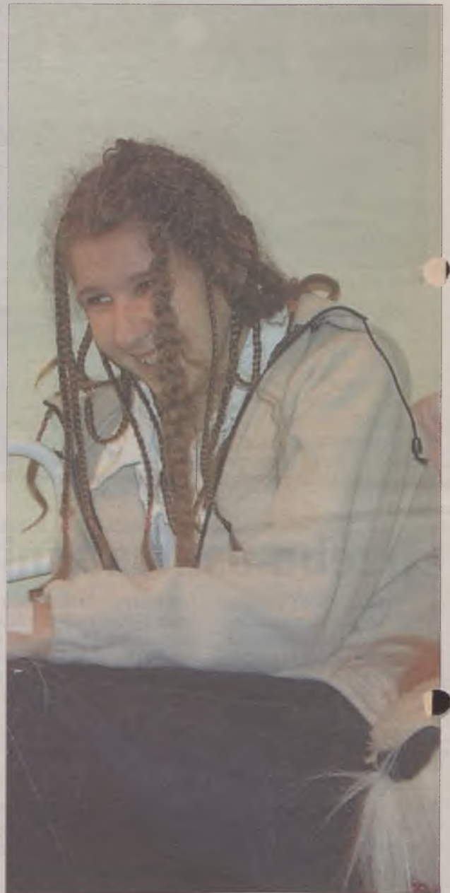
Asia przekazała pozdrowienia