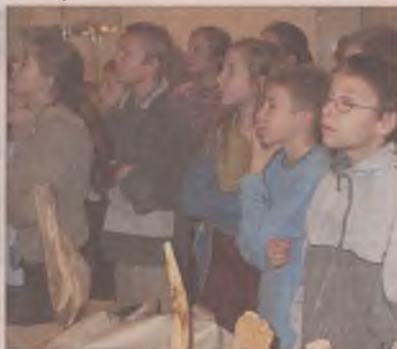
Klasa VI b z Zespołu Szkół Publicznych nr 1 na lekcji w Muzeum.