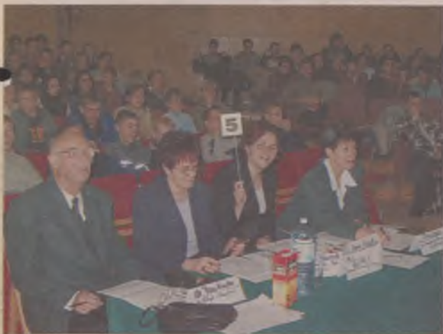
Jury w trakcie oceniania.