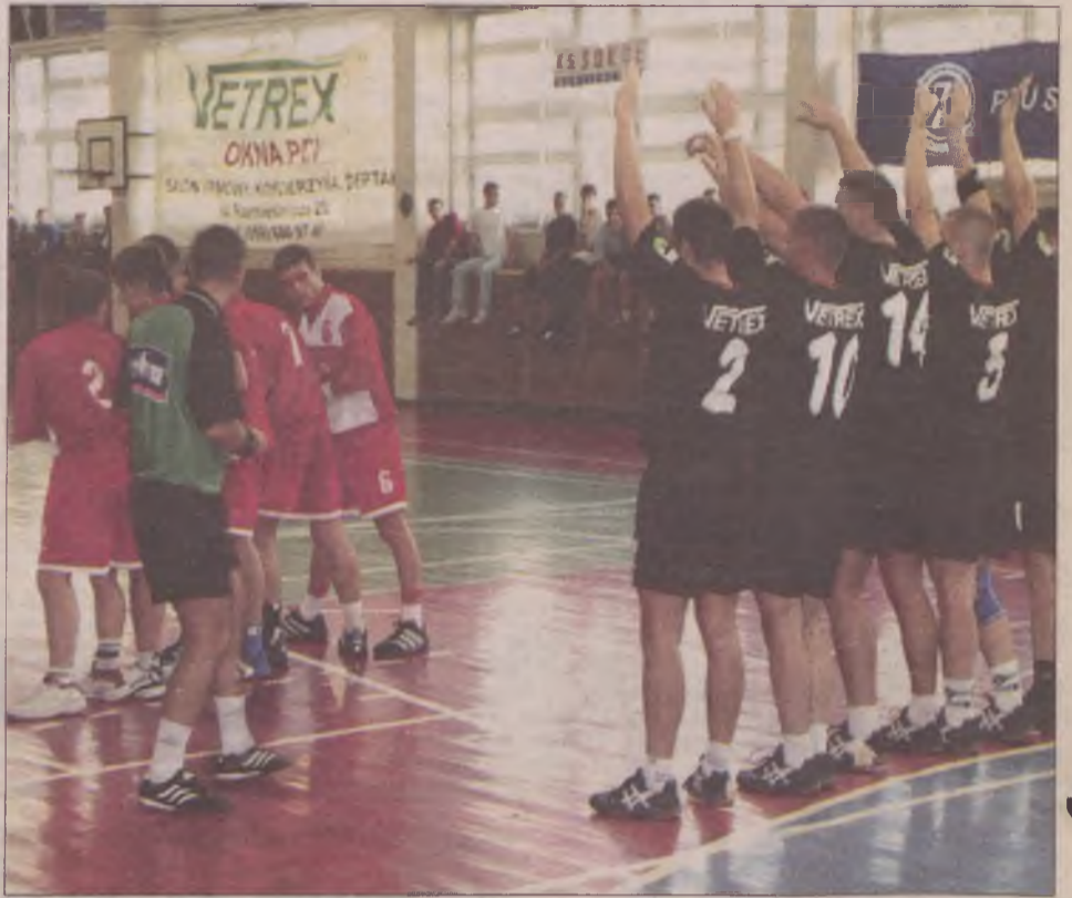
Miejmy nadzieję, że piłkarze Sokoła Vetrex podnosić będą ręce nie tylko w obronie, ale także z radości po wygranym meczu.

Teraz przed Sokółem mecz z jednym z faworytów