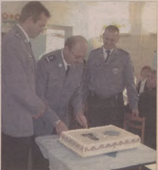
Na uczestników czekał wspaniały i bardzo słodki prezent.

- To już druga edycja programu i mam nadzieję, że będzie on kontynuowany w latach przyszłych. To bardzo cenna inicjatywa, która skierowana jest przede wszystkim do dzieci. W formie zabawy przekazywane są bardzo ważne informacje. Cieszy mnie, że nie tylko policja angażuje się w ten program, ale także inne instytucje.