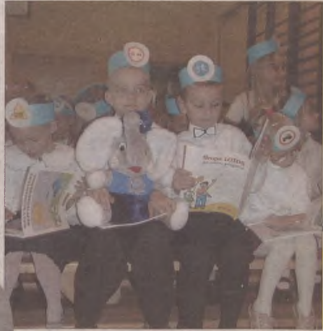
Kolorowe elementarze trafiły do każdego pierwszoklasisty.