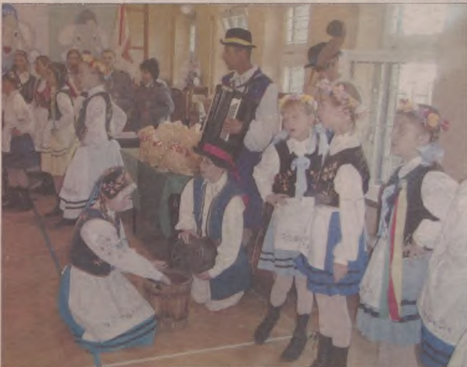
Imprezę uświetnił występ Zespołu Pieśni i Tańca Młoda Kościerzyna.