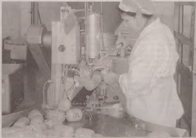
Kościerskie Zakłady Mięsne staną się teraz prywatną firmą.