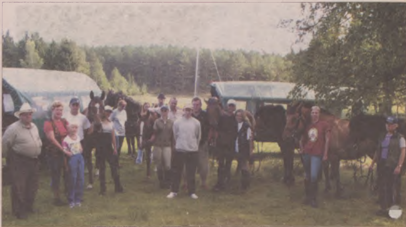
Podczas popasu w Wygodzie, gdzie kościerską ekspedycję przyjął jeden z gospodarzy.