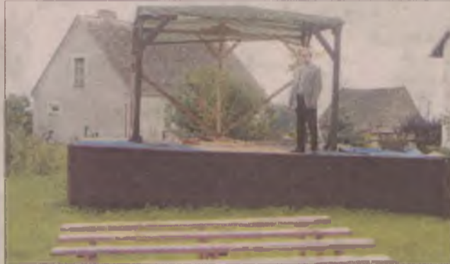
W okresie letnim msze święte odprawiano pod „gołym” niebem, tuż obok kościoła.