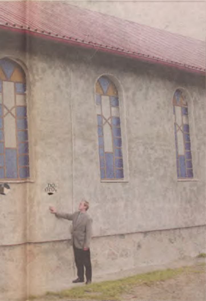
Prace na ścian kościoła po torkretowaniu.