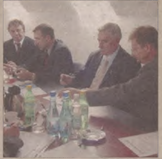
Moment uroczystego podpisania umowy kredytowej.