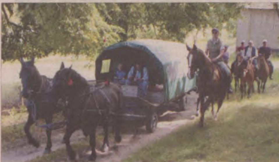
Po przerwie w Wygodzie ekipa ruszyła w drogę powrotną.