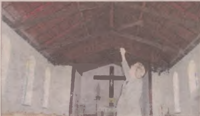
Dach rozpiął ściany kościoła, gdyby nie remont mogło być niebezpiecznie.

Tym, którzy zechcą wesprzeć remont kościoła w Lubaniu, podajemy numer konta: Parafia św. Michała Archaniola, Rekownica 5/1; 83-422 Nowy Barok; ZłBS Starogard Gd. O/Skarszewy filia w Nowej Karczmie. Nr konta 65 8340 0001 0120 4916 2000 0001.