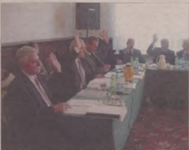
Zarząd powiatu kościerskiego podczas głosowania.