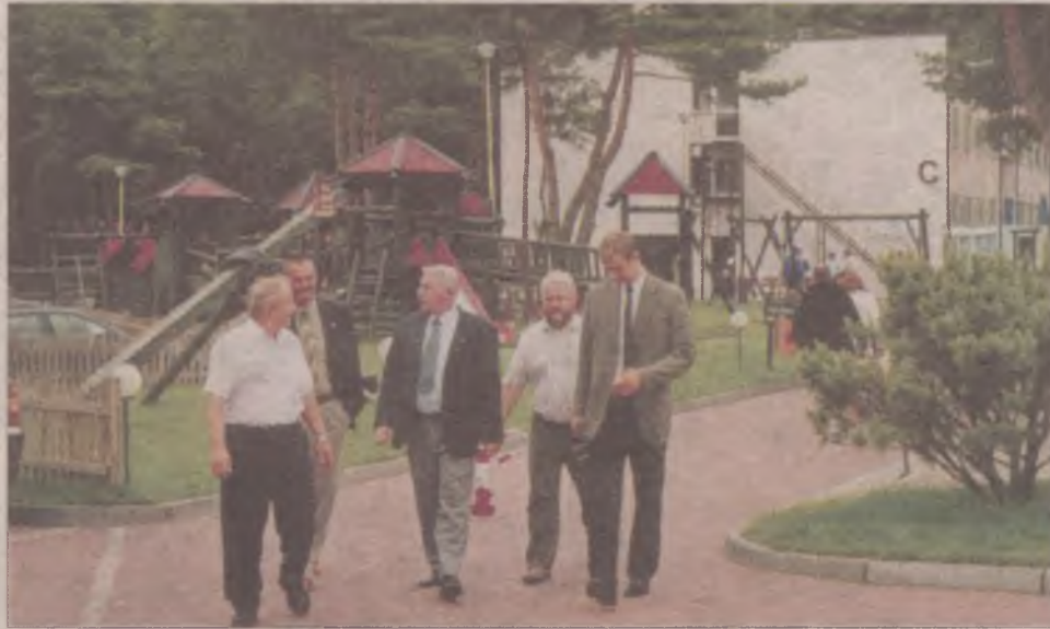
Zarząd Powiatu kościerskiego podczas zwiedzania zakładu przyrodoleczniczego w Jarosławcu.

- W związku z realizowanym programem przez Starostwo Powiatowe