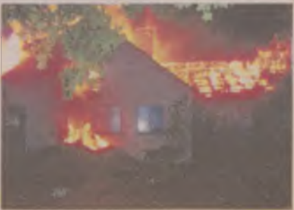
Budynek szybko ogarnął ogień.

rej Kiszewy, Liniewa, Bartoszegolasu, JRG z Kościerzyny, a także policja i pogotowie energetyczne, które odcięło dopływ prądu. O uratowaniu budynku nie było mowy, gdyż żywioł rozpełtał się na dobre, a sześć jednostek strażackich bezustannie próbowało go okiełznać. Co więcej, wewnątrz chlewni znajdowało się ok. 200 kur, które za nic nie chciały opuszczać mocno rozgrzanego pomieszczenia. Strażackie poświęcenie jednak nie ma granic. Człowiek czy kura, ratować trzeba.