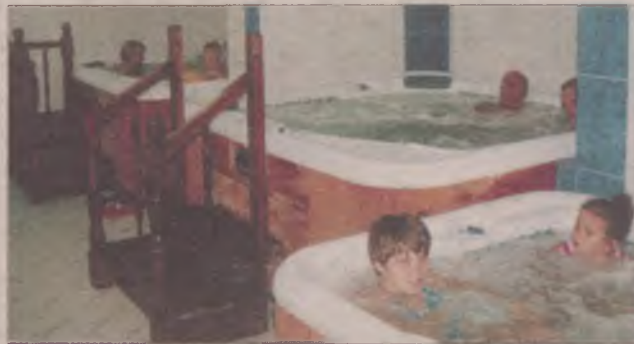
Kuracjusze korzystają z masażu wodnych jednej z wielu propozycji zdrowego wypoczynku w zakładzie przyrodoleczniczym.

22 września br. w Gdańsku odbędzie się konferen-