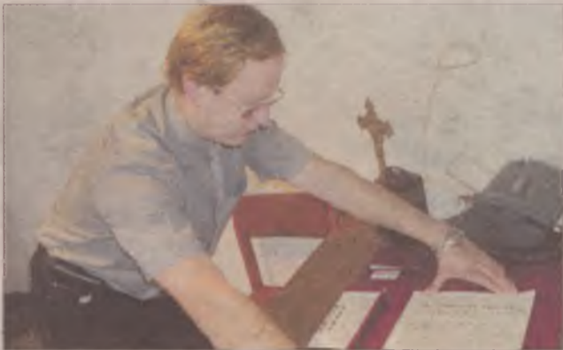
Akt erekcyjny pod budowę kościoła w Lubaniu.