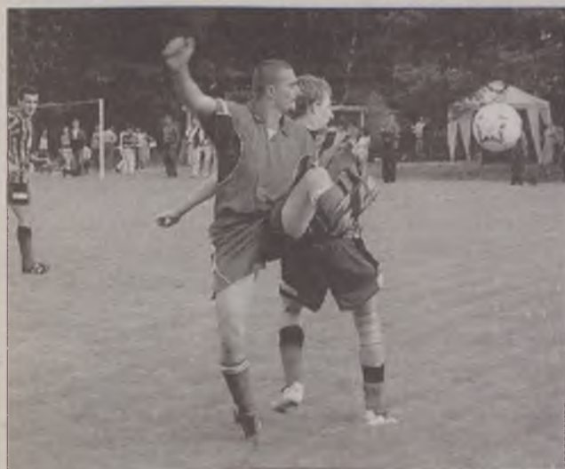
Nowi Nowa Cerkiew (jednolite koszulki) walczyć będzie o utrzymanie w A-klasie.