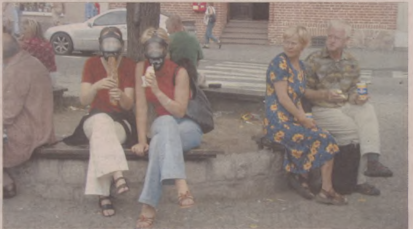
Właściwie taki widok nie powinien nikogo dziwić...

Jeśli spędzamy wiele czasu w okolicach Rynku, umawiamy się na płoteczki albo na obiad w ogródkach, musimy zdawać sobie sprawę, że znajdujemy się w bardzo zanieczyszczonym środowisku. Wdychamy przy okazji m.in.