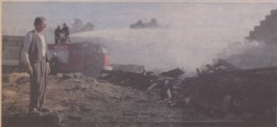
Tadeusz Westfal mówi, że wraz ze stodołą spłonęło 40 to zboża.