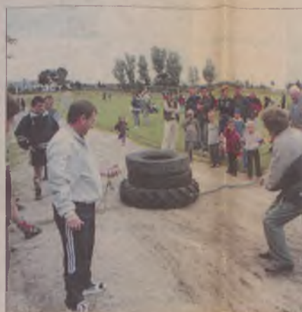
W rywalizacji rodzin, jedną z konkurencji były biegi na oponach.

Nie zawiedli sponsorzy, dzięki którym na najlepszych czekały nagrody.