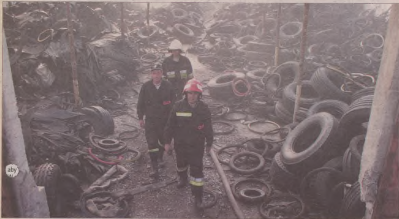
Te opony udało się oddzielić od reszty, która spłonęła.