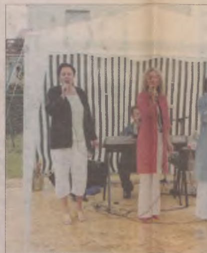
Zespół Agat z Gminnego Ośrodka Kultury i Rekreacji w Liniewie.

Superpuchar w turnieju piłki nożnej zdobyli piłkarze ABC. Ubiegłoroczny mistrz pokonał zwycięzców tej edycji, zawodników z Zakładu Mechanicznego w Tczewie. Dla dzieci i młodzieży