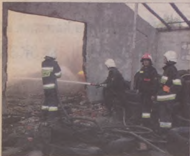
Strażacy z 9 jednostek gasili ogień przez 12 godzin.