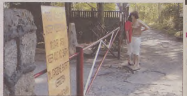
Na razie na bramie prowadzącej na koniec cypla widnieje zakaz wstępu...