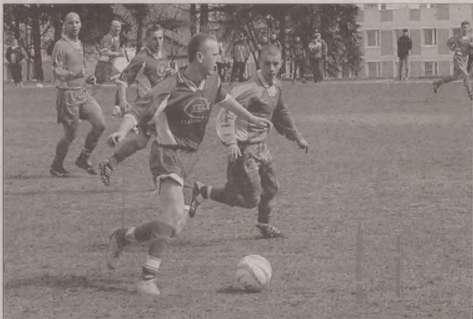
Drużyny grupy pierwszej A-klasy są już gotowe do występów.

- Zdajemy sobie sprawę z rangi pierwszych spotkań -