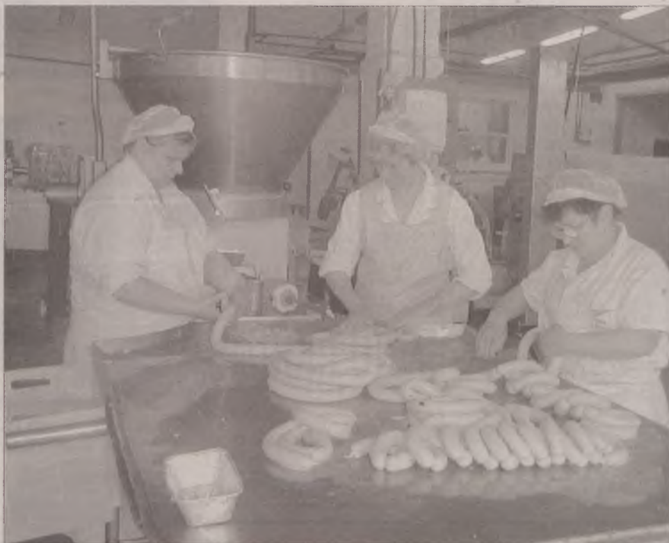
Pracownicy zakładów są zadowoleni, że będą mogli pracować jeszcze we wrześniu.