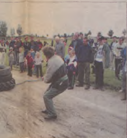
...jedną z konkurencji było przeciąga-