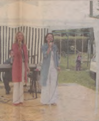
...nego Ośrodka Kultury, Sportu i Re-