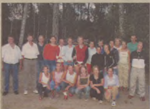
Zespół piłkarzy ręcznych wraz z trenerami i władzami klubu.

GARCZYN. Na obozie przygotowawczym w Powiatowym Ośrodku Szkoleniowo-Wypoczynkowym w Garczynie przebywał zespół drugoligowych piłkarzy ręcznych Kościerzyna. Szczypiornistki zaczęły już treningi przed ligą, która zaczyna się we wrześniu.