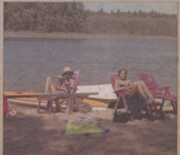
Paniom najbardziej odpowiadały kąpiele słoneczne.