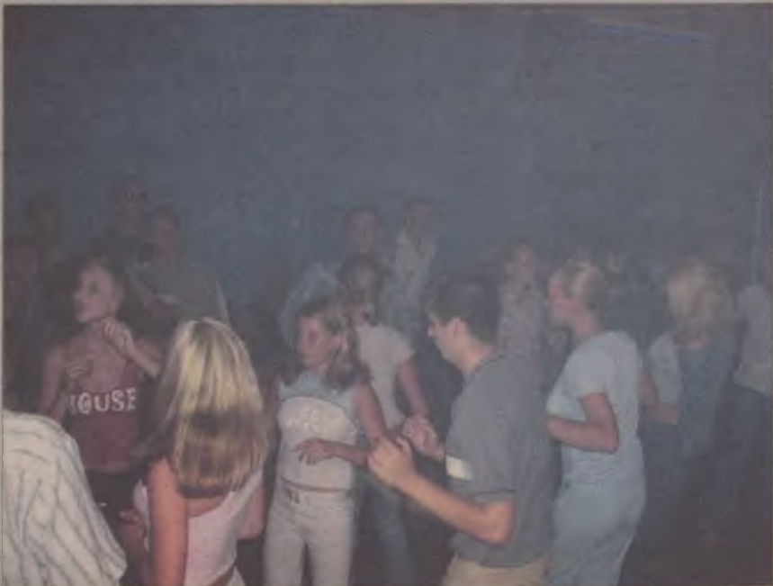
Miłośnicy dobrej zabawy cenią sobie dyskotekę Blue Orange.

Dyskoteka Blue Orange ma własną stronę internetową. Zainteresowanym podajemy adres: www.blueorange.gda.pl .