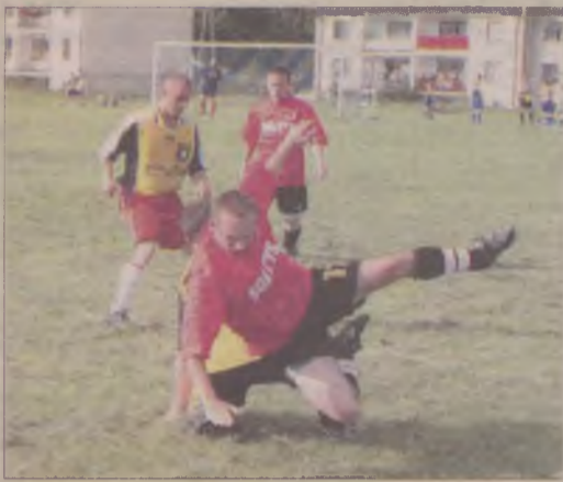
Dziemiany I zremisowały bezbramkowo z Wierzyca Stara Kiszewa.