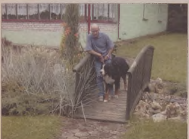
Pomysłowy mostek i dębowa podłoga urozmaicają ogród wodny