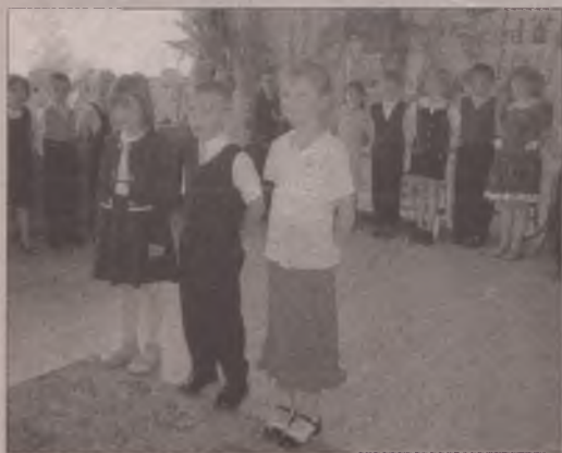
Dzieci pożegnały przedszkole, prezentując program kaszubski.