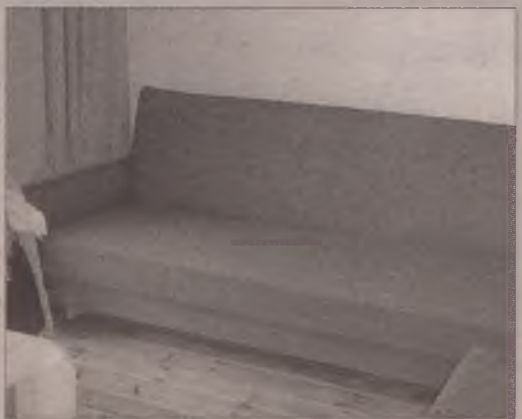
Mieszkanka Kościerzyny chce oddać meble, telewizor i kredens.