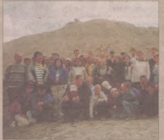
To były cudowne dni - stwierdziły dzieci po wyjeździe do Kościerzyny.