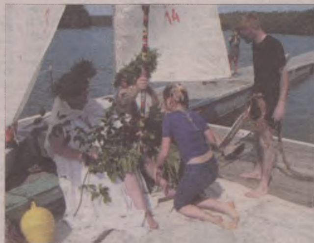
Każdy musiał pocałować Zeusa w kolano.