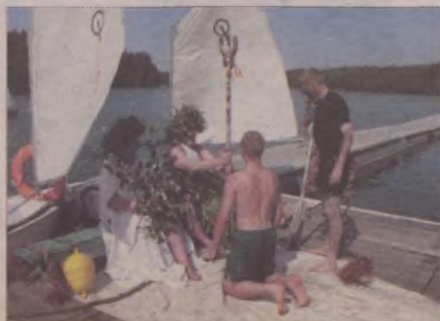
Zeus nadawał imię chrzczoneму.