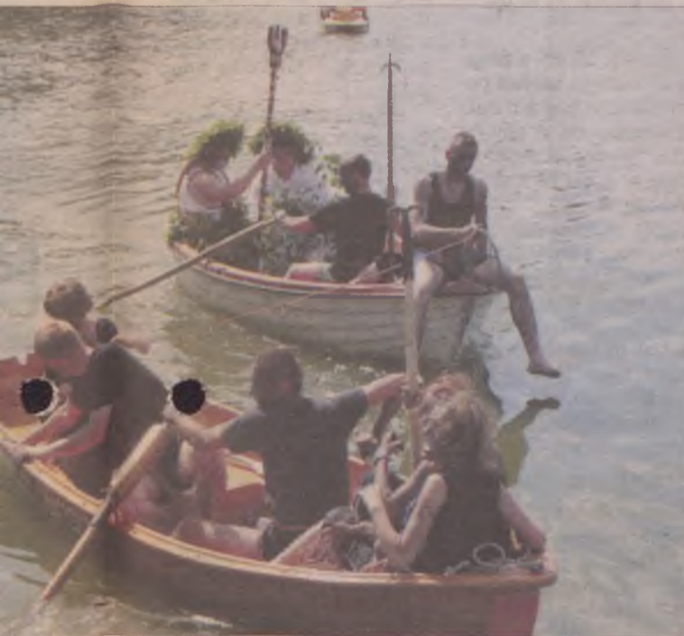
rzybył wraz z orszakiem.