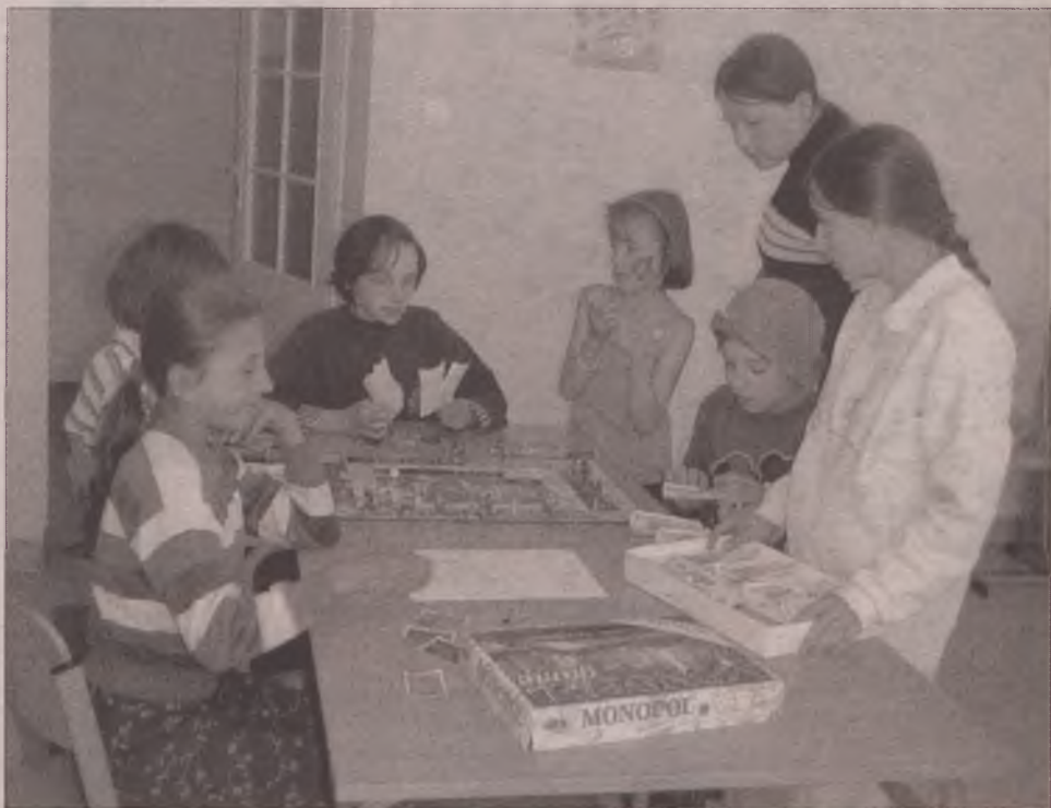
Dzieci, które nie wiedzą jak wypełnić wakacyjny czas, mogą przyjść do świetlicy i wziąć udział w różnych zabawach.

M iejski Ośrodek Pomocy Społecznej ma nową siedzibę, na ul. Jana Brzechwy, w budynku po byłym Przedszkolu nr 4. Dzięki temu mógł rozszerzyć swoją działalność. Z oferty ośrodka korzystają nie tylko osoby, które są w potrzebie, ale również te, które chcą na przykład w miłej atmosferze spędzić część dnia.