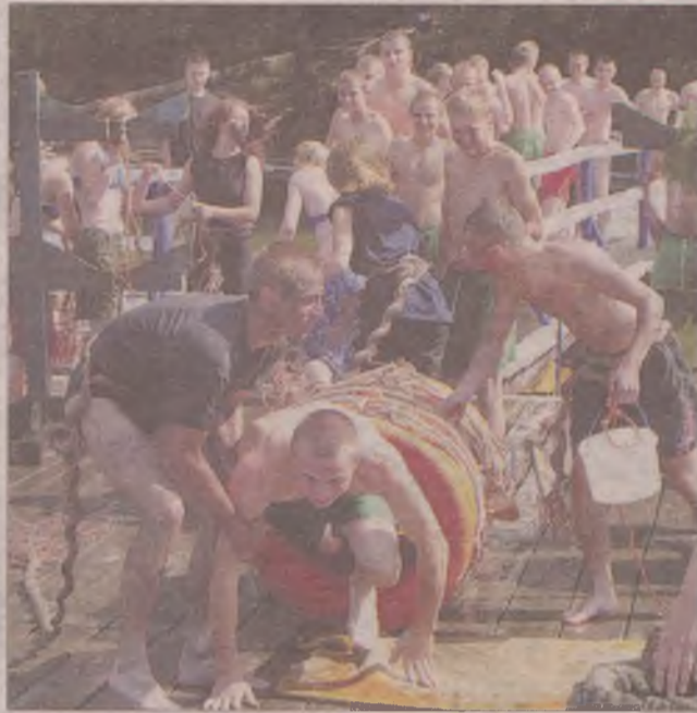
Młodzież klas pierwszych musiała przejść chrzest.