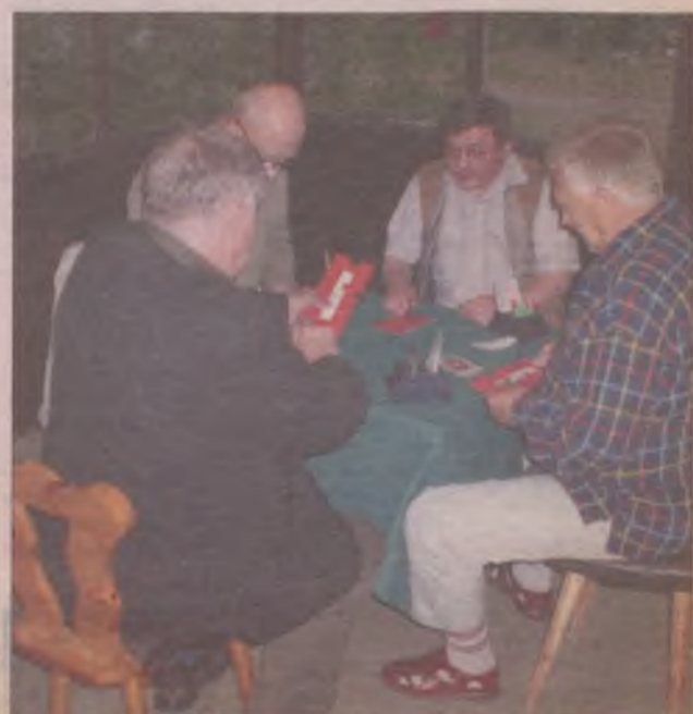
W Turnieju Brydża Sportowego udział wzięło ponad 40 zawodników z całej Polski.