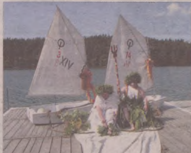
Ostatnie przygotowania przed chrztem młodych obozowiczów.