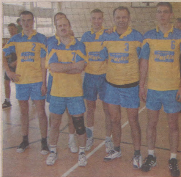
Zespół z Lipusza pewnie wygrał z Łubianą.