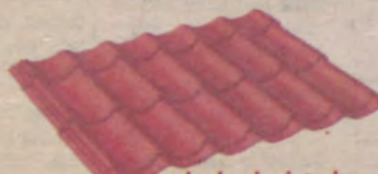
Błachodachówka Spektrum SPM