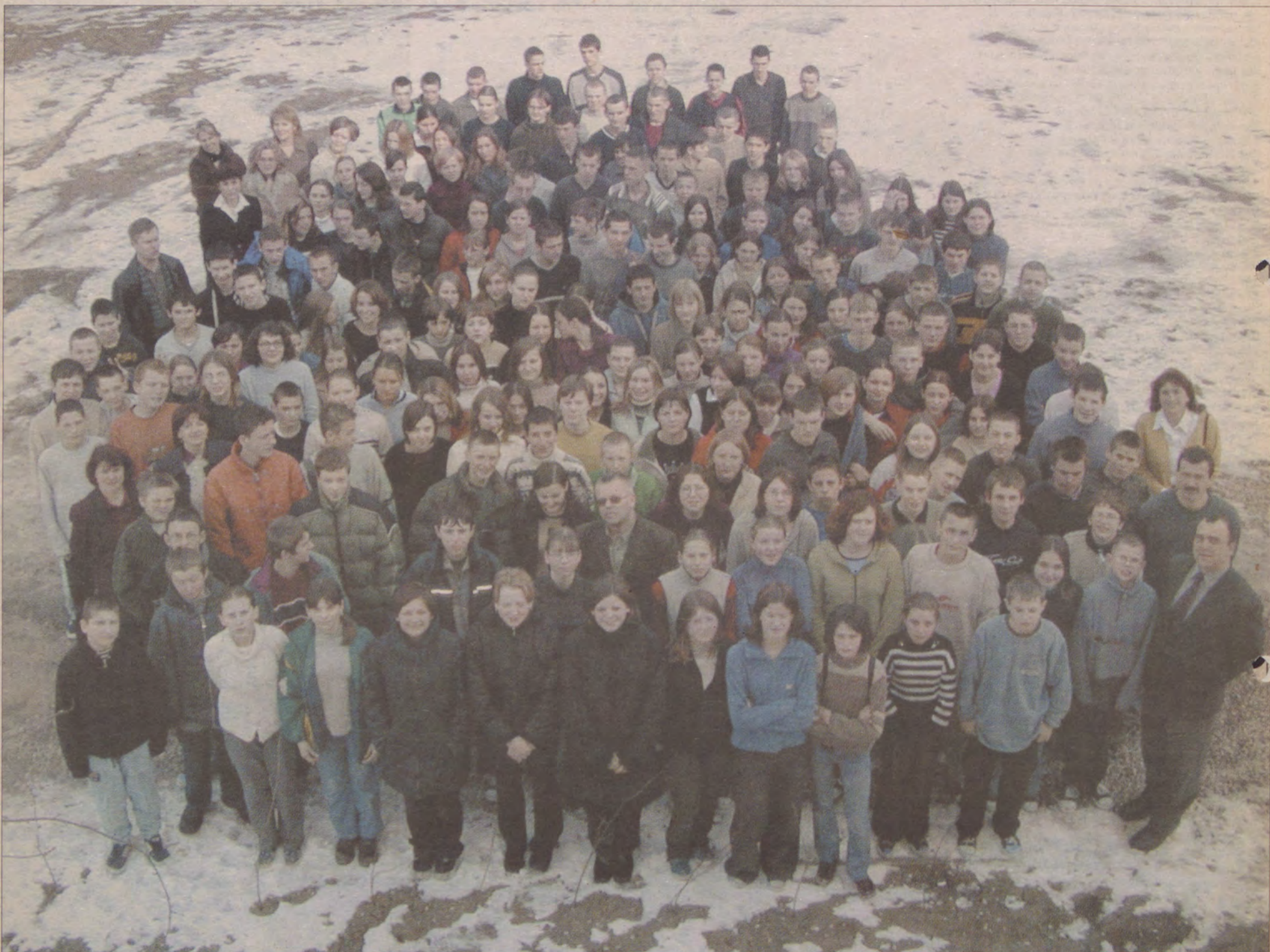
Uczniowie i nauczyciele Gimnazjum Publicznego w Liniewie.