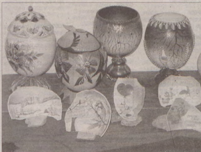
Jajka są tak cenne, że maluje się nawet skorupki.

- Za kilogram mięsa otrzymuje się 50 zł - dodaje Stanisław Armatowski. - W naszym kraju jest coraz więcej podmiotów zainteresowanych skupem mięsa strusi. Trafia ono przede wszystkim do ekskluzywnych restauracji. Natomiast samo strusie jajo kosztuje zwykle 70 zł. (jard)