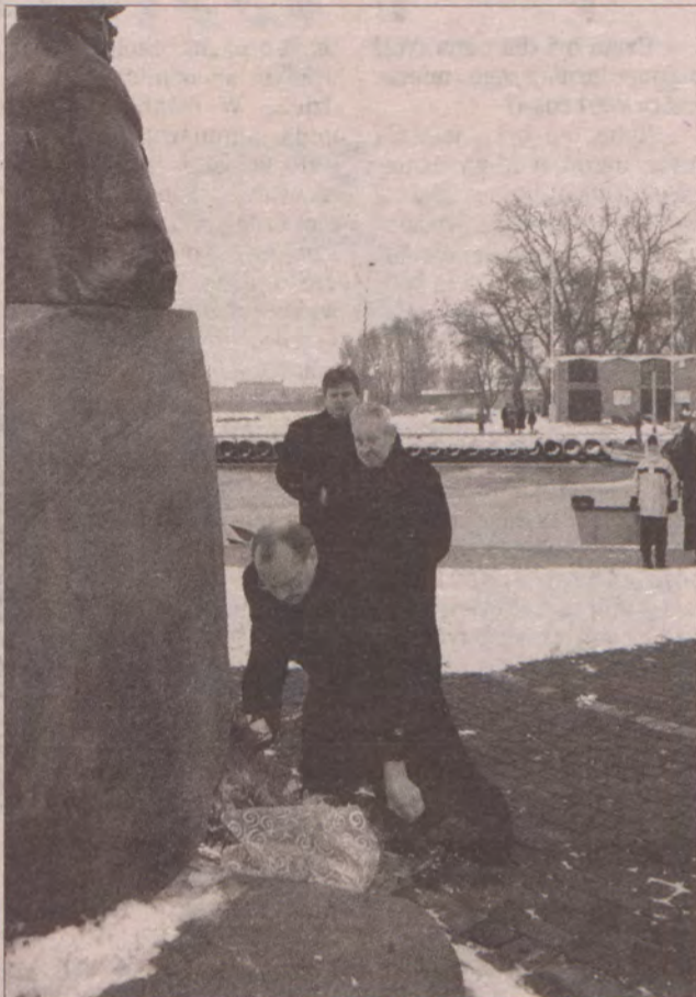
Uczestnicy zjazdu złożyli kwiaty pod pomnikiem gen. Józefa Hallera.