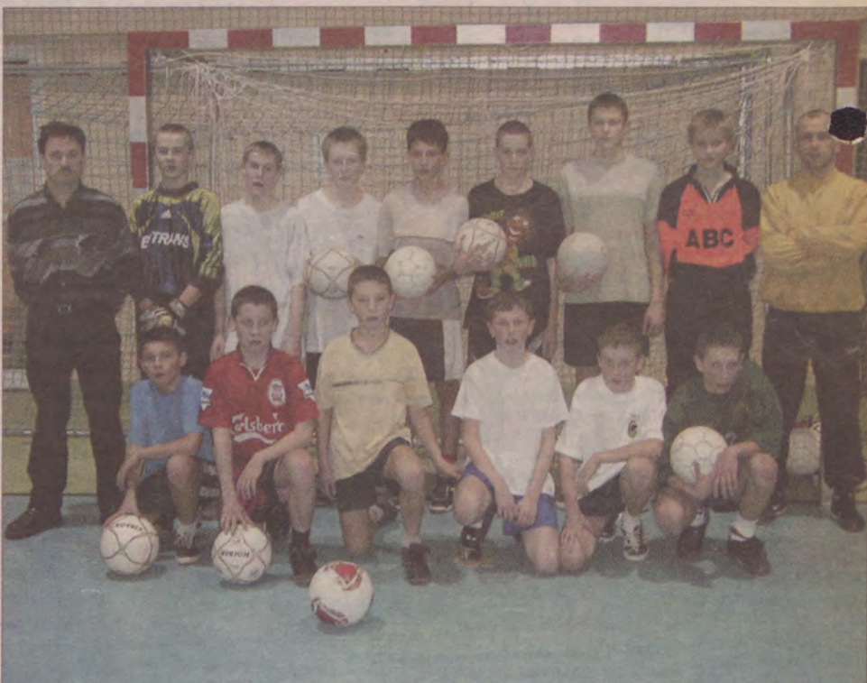
Piłkarze Kaszubii Kościerzyna rocznika 1989/90, wraz z trenerem i kierownikiem zespołu.