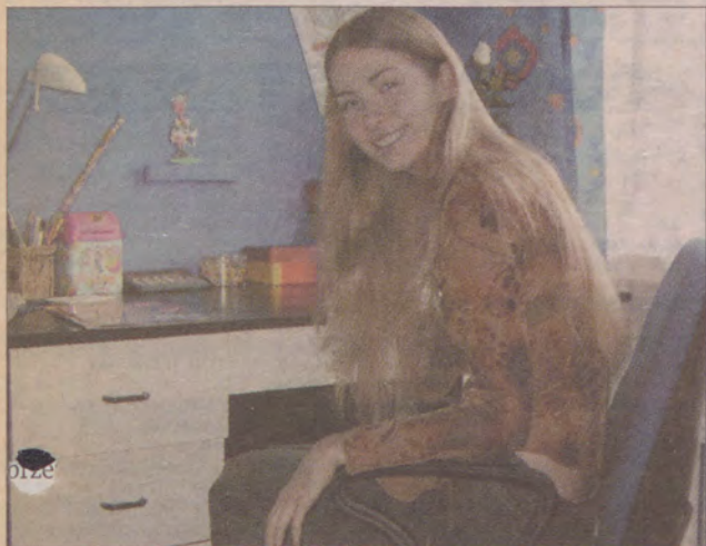
Wymiary Dziewczyny Roku to: 87/63/94, wzrost 178 cm.