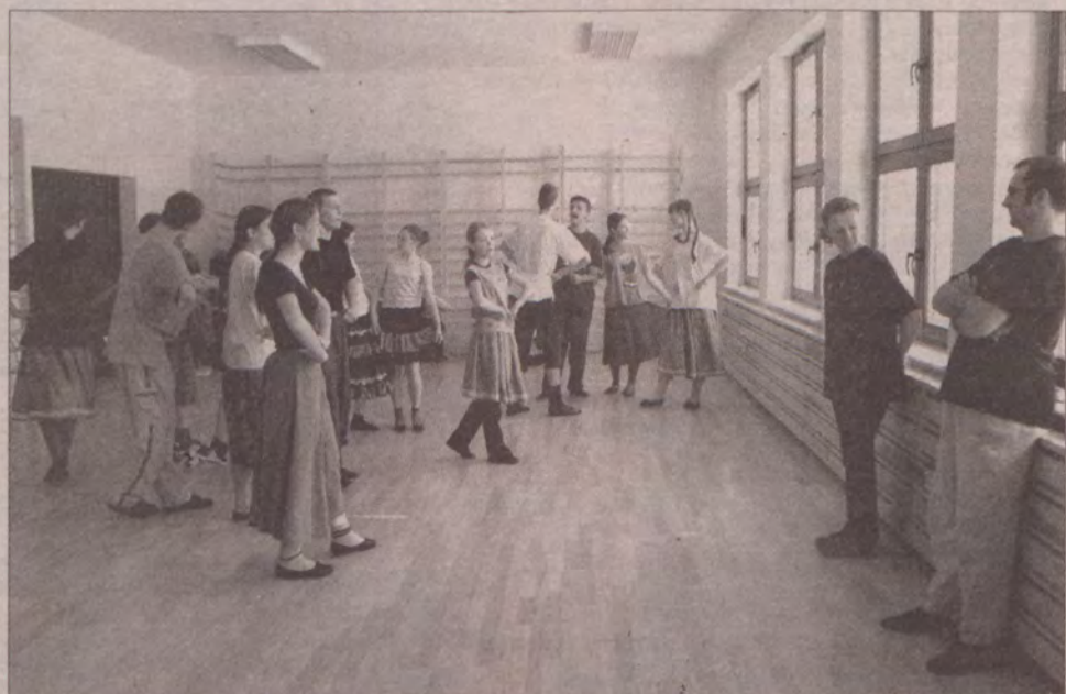
Młodzi górale uczą się kaszubskich tańców.