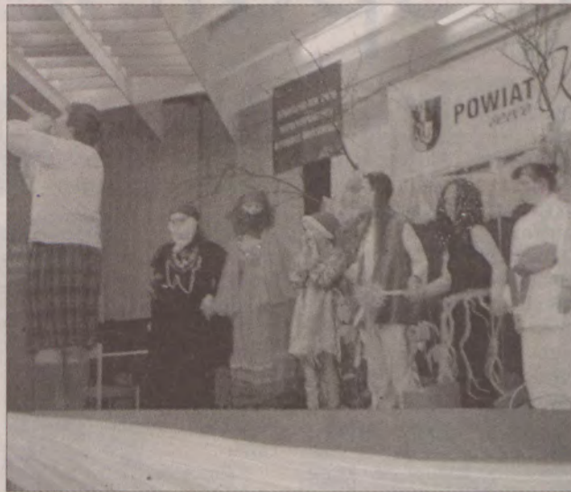
Publiczności bardzo podobał się występ młodzieży ze Środowskiego Domu Samopomocy Jesteśmy dla Ciebie.