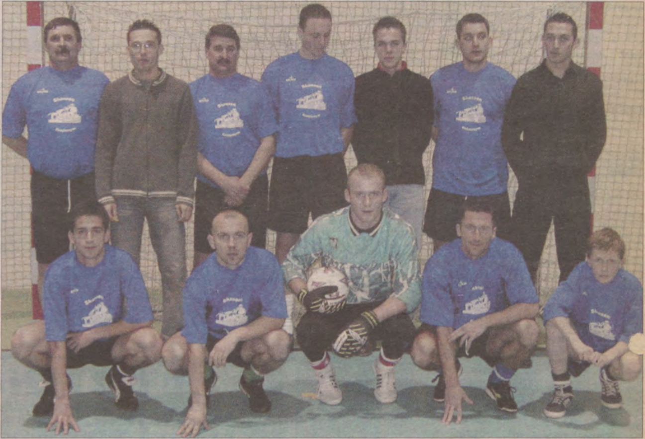
Ubiegłoroczny zwycięzca ligi, zespół Lokomotywa, na razie zajmuje czwarte miejsce w tabeli.