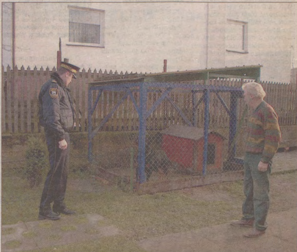
Rottweiler państwa Kreft utrzymany jest w warunkach nie stanowiących zagrożenia dla ludzi i zwierząt.

- Na terenie naszego miasta mamy około 50 psów, które należą do ras agresywnych