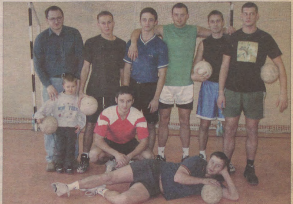
Drużyna Żaka nie dała szans Straży Pożarnej, wygrywając 3:0.