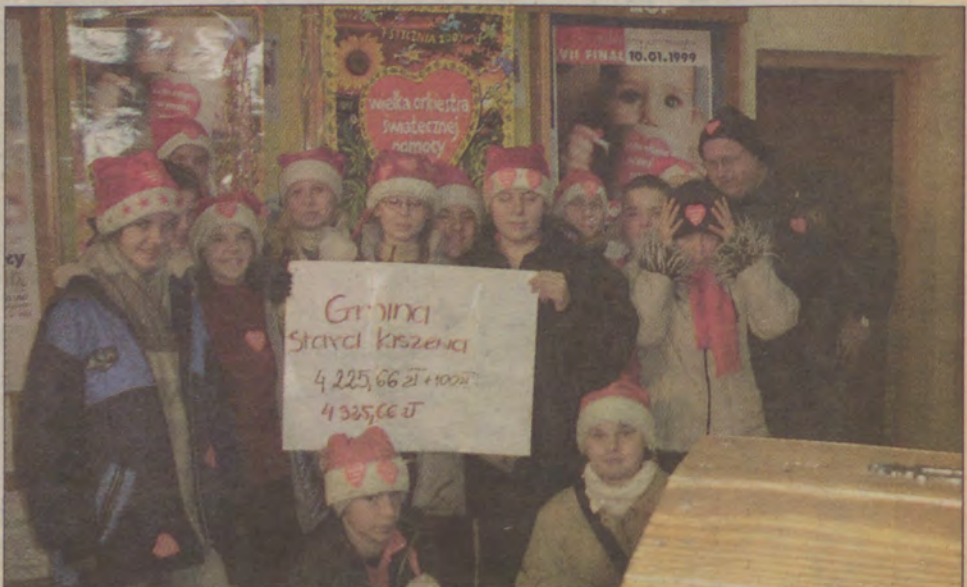
Wynik zebranych pieniędzy w gminie Stara Kiszewa był wielką niespodzianką. W sumie gmina ta zebrała 4.325 zł.