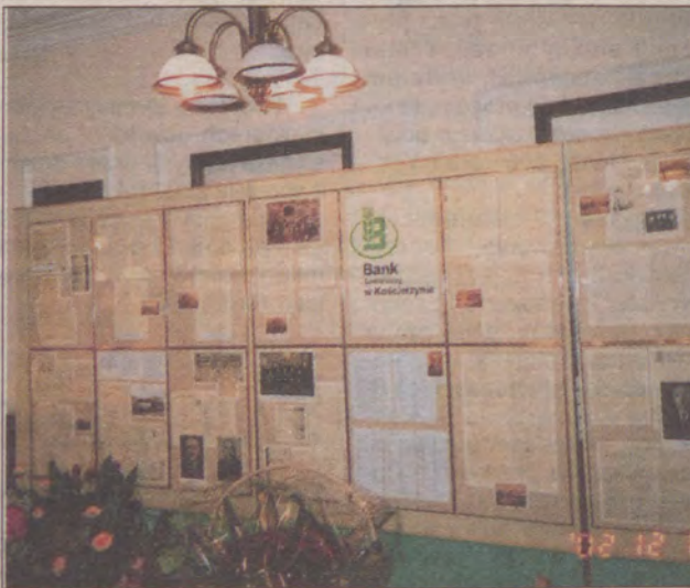
Okolicznościową wystawę przygotowaną z okazji jubileuszu 100-lecia Banku można oglądać w siedzibie placówki.