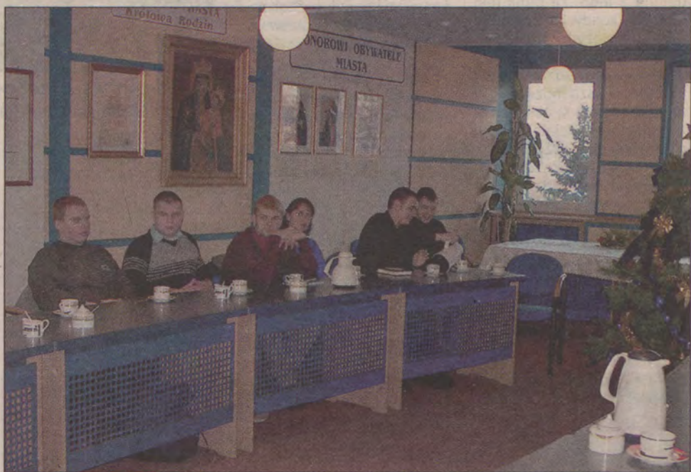
Spotkania młodzieży z władzami naszego miasta odbywają się zawsze w przyjaznej atmosferze.