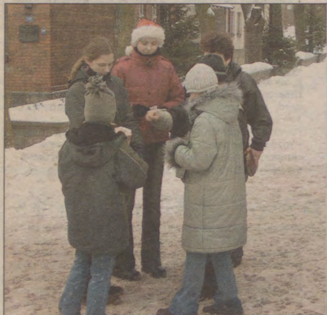
Na ulicach miasta Kościerzyna kwestowało 20 wolontariuszy.