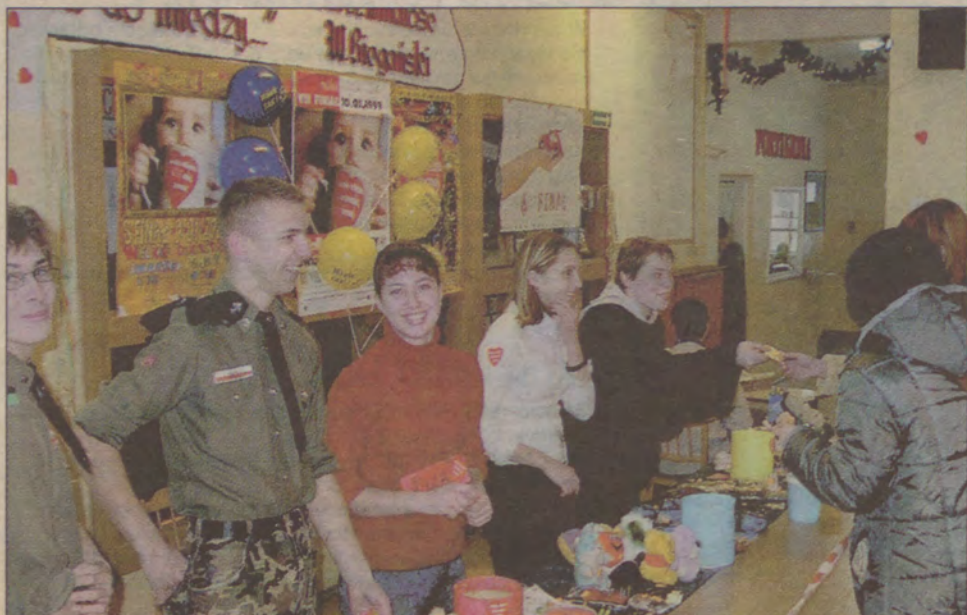
W sztabie działał sklepik, w którym można było kupić gadżety WOŚP.