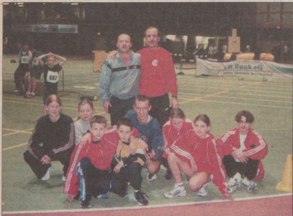
Zawodnicy Remusa uczestniczyli w towarzyskich zawodach, które odbyły się w Stadallendorfie w Niemczech.

T uż przed świętami Bożego Narodzenia zawodnicy Remusa wrócili z zawodów sportowych, które odbywały się Stadallendorfie w Niemczech.