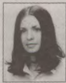
Fot. Joanna Surazyńska