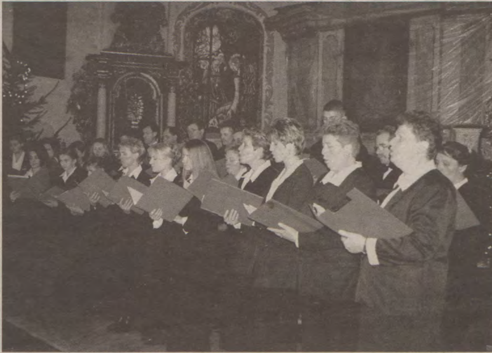
Występuje chór kościelny ze Stężycy.

Postanowiono, że od przyszłego roku zmieni się nieco formuła przeglądu. Ma on każdorazowo odbywać się w innym kościele. Na terenie gminy jest pięć parafii. Szczególnie zainteresowane są parafie w Szymbarku i Klukowej Hucie. Dzięki temu uczestnicy mają szansę dostrzec z pięknymi kolędami