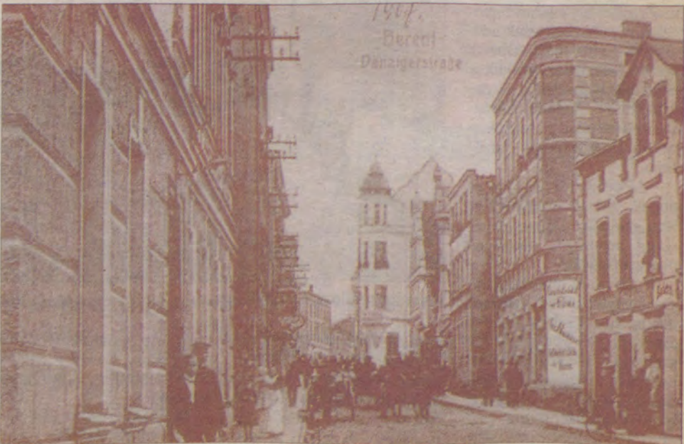
Tak ulica Gdańska prezentowała się w drugiej połowie XIX wieku.