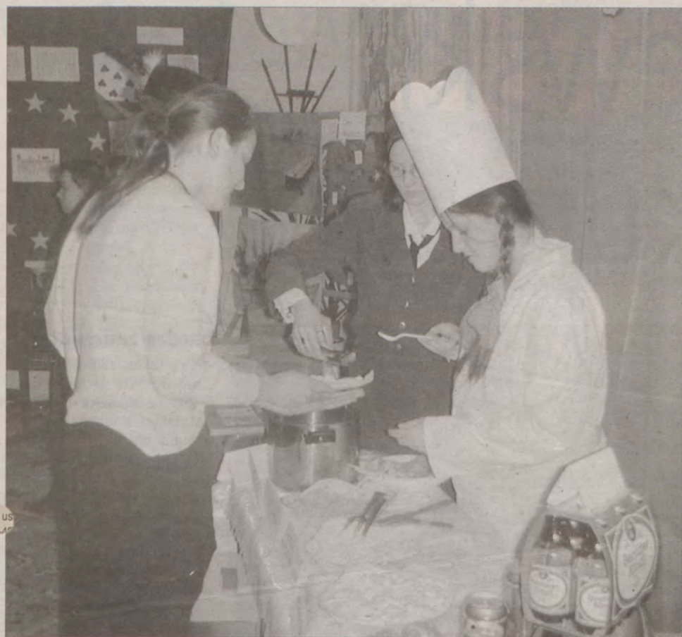
Uczestnicy spotkania poznali potrawy typowe dla prezentowanych państw Unii Europejskiej.