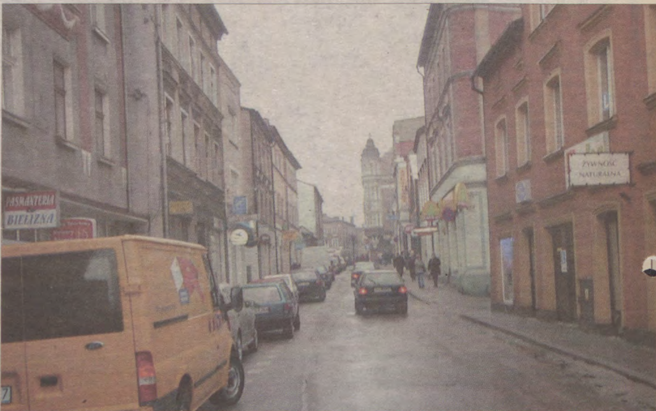
Ulica Gdańska obecnie