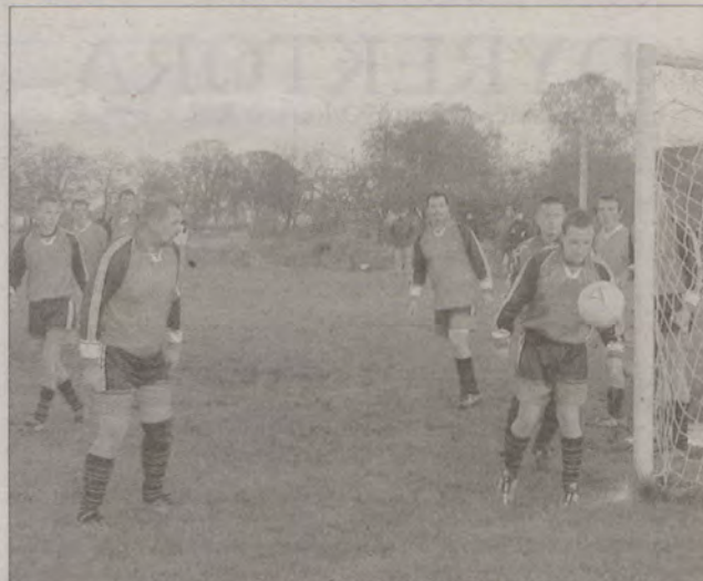
Żaden z piłkarzy Kaszubii Starzyna nie zamierza opuścić drużyny.

Kaszubia przez kilka sezonów grała w A klasie. Po spadku jesień nie była najlepsza w wykonaniu piłkarzy ze Starzyna i raczej myśli o powrocie do wyższej ligi trzeba będzie odłożyć na następny sezon. (jan)