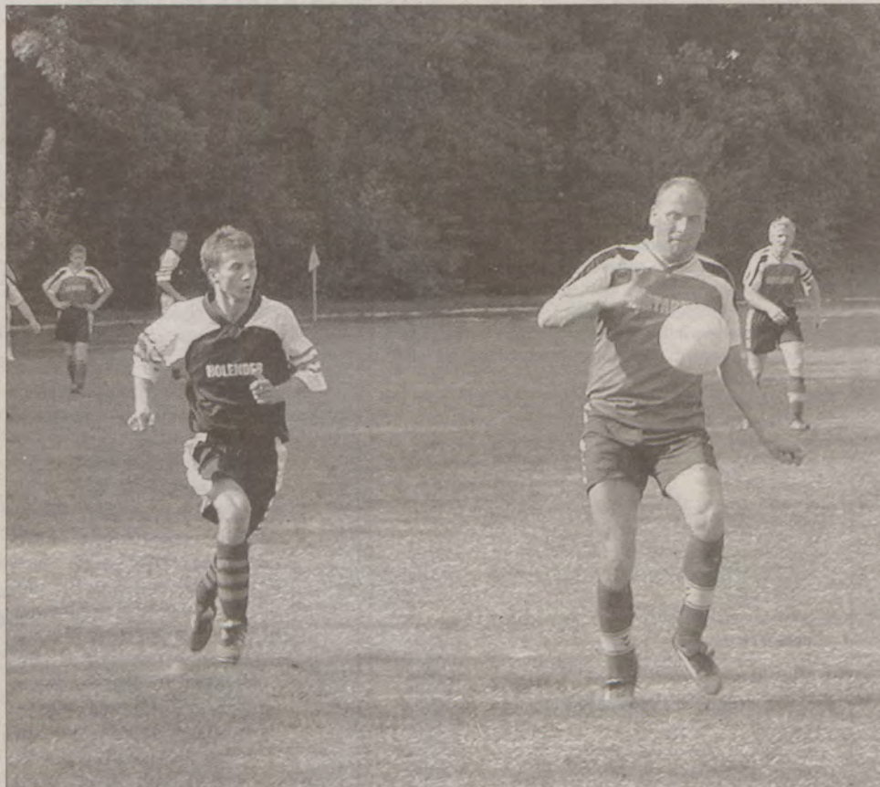
Mimo początkowych kłopotów, piłkarze Jastarni (przy piłce) jesienią uplasowali się w środku tabeli klasy A.

Zdecydowana większość piłkarzy drużyny mieszka lub pochodzi z Jastarni. W Chałupach mieszka bramkarz, jeden