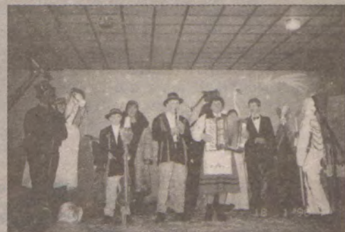
Zespół Gwiazdka z Żelistrzewa wprowadził podczas ubiegłorocznego konkursu dużo wesołości.