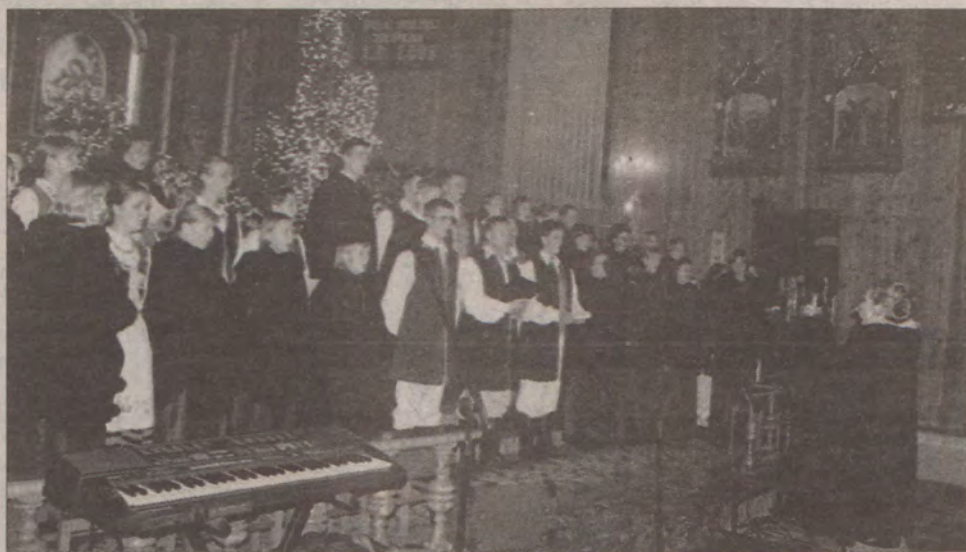
Wspólny występ chóru Bel Canto i Kaszubskiego Zespołu Pieśni i Tańca „Sierakowice”.

- Położyliśmy przede wszystkim nacisk na śpiew,