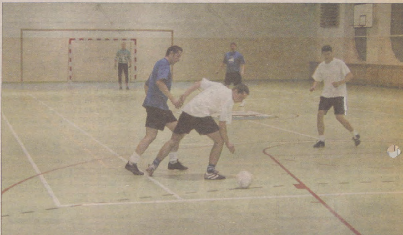
Mecz Lokomotywy (ciemne stroje) z Codanem zakończył się wynikiem 6:3.