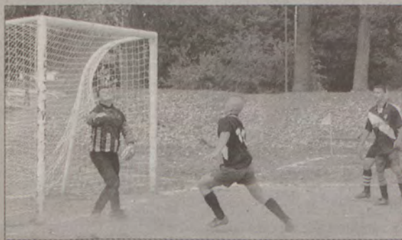
Drużyna Sprzęgła czeka na nowych piłkarzy.

- Obecnie przymierzamy się do sparingów z Iskrą Szemud - mówi prezes Kummer. - A dla chętnych, którzy chcieliby u nas grać podaję nr tel. 601-748-746. (jan)