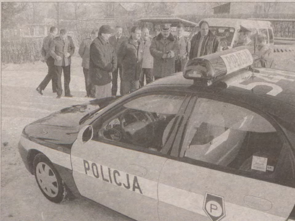
Od kilku dni posterunek policji w Dziemianach dysponuje nowym radiowozem.