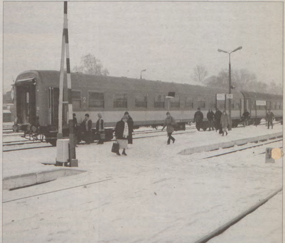
Wielu pasażerów marzło w ostatnich dniach w pociągach na trasie Chojnice - Kościierzyna.