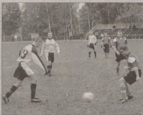
Drużyna puckiego Handlu (z lewej) zostanie odmłodzona.