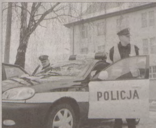
Policjanci z KPP w Kościerzynie liczą na współpracę z mieszkańcami miasta.