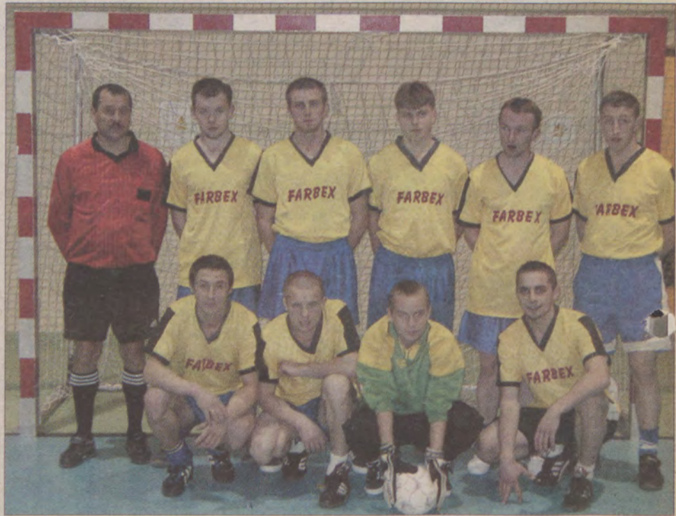
Farbex wygrał swój ostatni mecz i zajmuje 7 miejsce w tabeli.

W drugim pojedynku JB walczyło z Lokomotywą. Pierwsza połowa bardzo szybka i zacięta zakończyła się wynikiem 2:2. W drugiej obie drużyny w trosce o wynik zagrały z dużą asekuracją własnej bramki, poświęcając więcej uwagi obronie, przez co kibice nie zobaczyli więcej goli. Mimo to mecz stał na bardzo dobrym poziomie i wzbudzał sporo emocji.