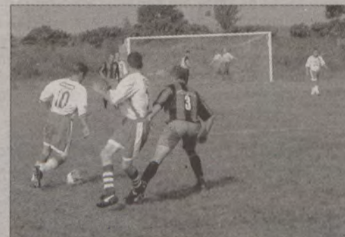
LKP Grabowo - Piłkarze LKP Jareks Grabowo (biało-czerwone stroje) przewodzą grupie kościerskiej klasy B.