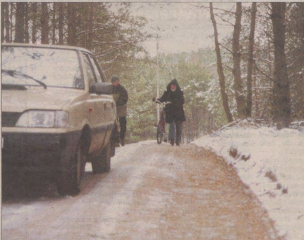
Mieszkańcy wsi Stacja Bąk mieli wielki problem z przejazdem drogą powiatową w kierunku Konarzyna.