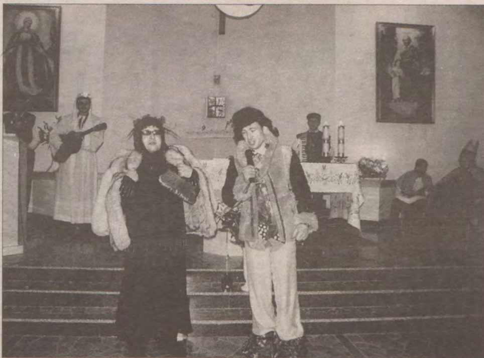
Przedstawienie w wykonaniu kleryków ma wymiar wybitnie liturgiczny.

Przed wszystkim odwiedzamy parafie, do których co roku jesteśmy zapraszani. Od niedawna zapraszają nas także party Zrzeszenia Kaszubsko-Pomorskiego, na przykład ostatnio występowałam w klubie kaszubskim w Gdańsku Mołnie. Jeździmy do probosz-