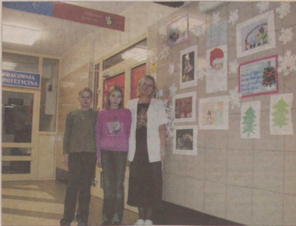
Przed wejściem do oddziału dziecięcego można zobaczyć prace małych pacjentów.

Przygotowania do występów trwały około tygodnia. Jasełka wystawiły dzieci, które w szpitalu przebywały m.in. na turnusach rehabilitacyj-