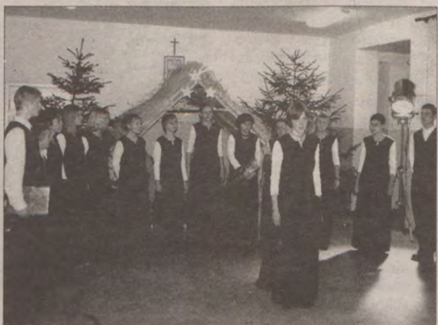
Występ chóru Bel Canto podczas uroczystości otwarcia wystawy.