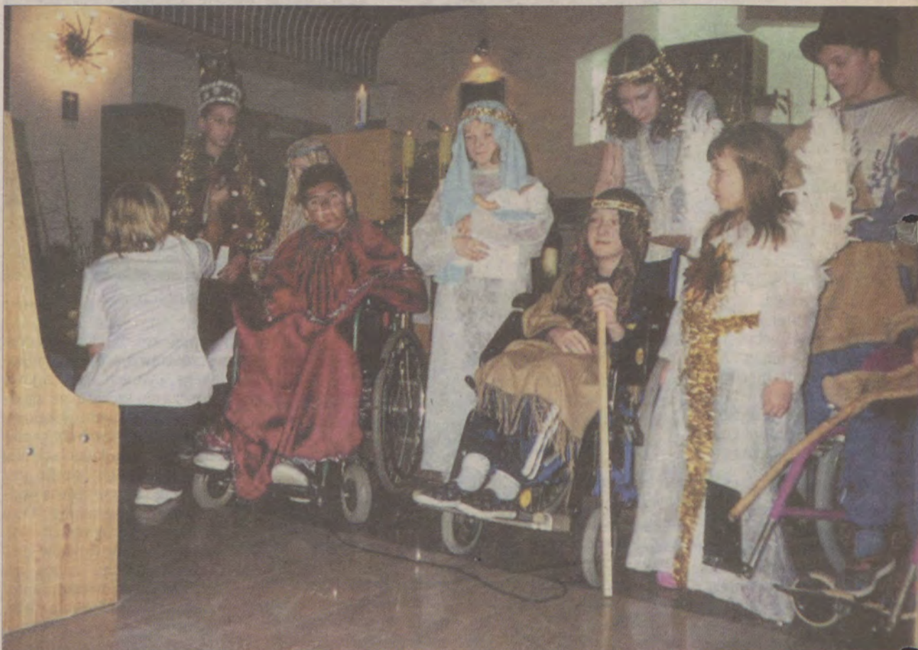
Młodzi aktorzy z oddziału dziecięcego przygotowali jasełka dla pacjentów kościerskiego szpitala.