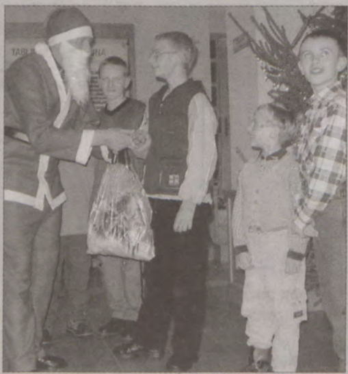
Wiele emocji wśród dzieci wzbudziła postać Mikołaja.