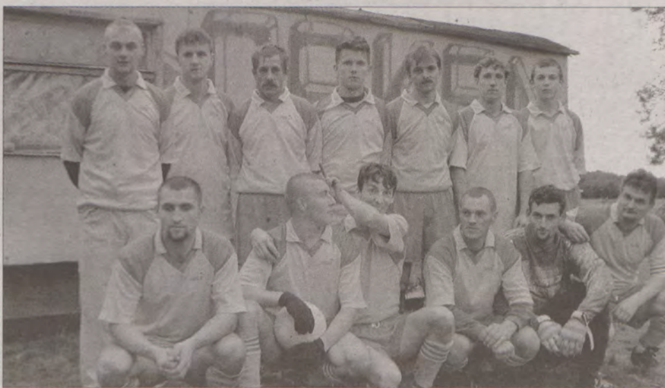
Drużyna Orkana Huta.

Mimo, iż Huta i Rudziny to niewielkie wsie, nigdy nie brakowało zawodników. Nawet, gdy na mecz w latach 80-